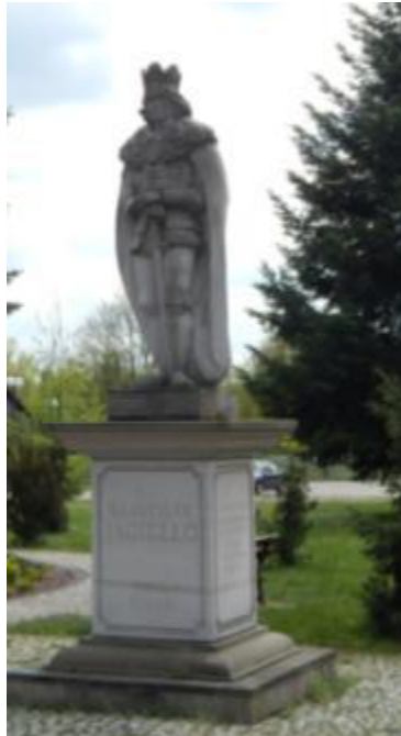
Pomnik Władysława Jagiełły w Bliżynie 1

Najstarsza datowana wiadomość o Bliżynie pochodzi z zapisu Jana Długosza w diariuszu podróży króla Władysława Jagiełły z Krakowa pod Grunwald w 1410 roku. Król nocował w Bliżynie z 21 na 22 czerwca 1410 r. prawdopodobnie u swojego dworzanina Piotra Szafrąca z Pieskowej Skały.