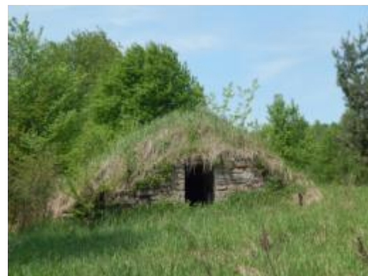
Piwniczka w Nowkach

Zagrożeniem dla tradycyjnego krajobrazu oraz utrzymania lokalnego charakteru miejscowej architektury i budownictwa jest potrzeba dostosowania budownictwa mieszkalnego do obecnych norm i potrzeb. Domy mieszkalne tracą swój charakter po przebudowie, rozbudowie, modernizacji, np. nadbudowy (zniekształcanie formy architektonicznej), wymiana okien (likwidacja detali architektonicznych), montaż nowoczesnych urządzeń, itp. Liczne szkody w tradycyjnej zabudowie przyniosło również zaprzestanie użytkowania, a co za tym idzie niszczenie obiektów. Nie zachowały - niegdyś bardzo liczne, związane ze Staropolskim Okręgiem Przemysłowym - się np. budowle kuźnic, młynów wodnych, mniejszych zakładów