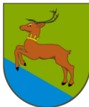
Herb Gminy Bliżyn