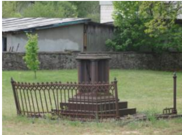
CMENTARZ DWORSKI PRZY KOŚCIELE w zespole kościół fil. p.w. św. Zofii w Bliżynie

Kaplica orientowana, ma plan wydłużonego ośmioboku. Od zachodu ma prostokątną przybudówkę, która pełni rolę kruchty. Od wschodu są trzy przybudówki, które pełnią funkcję zakrystii i kaplicy (umieszczone skośnie do osi) i prezbiterium (na osi głównej).