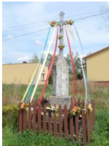
Krzyż kamienny z 1902 roku w Ubyszowie