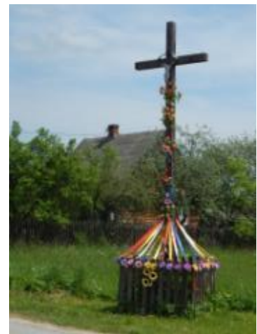
Krzyż drewniany w Nowkach