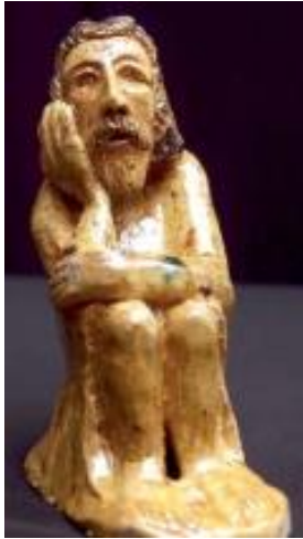
Drewniana rzeźba ludowa Władysława Berusa