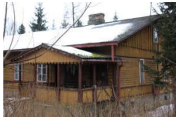
Dom urzędniczy w zespole osiedla Odlewni Żeliwa, ul. Kościuszki 95 w Bliżynie