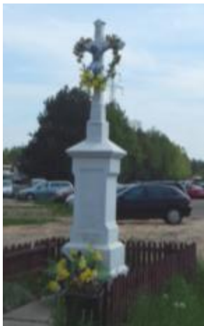
Krzyż kamienny z 1877 roku w Mroczkowie