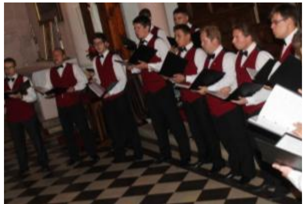
Koncert muzyki organowej i kameralnej