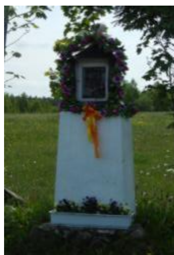
Kapliczka w Kucębowie