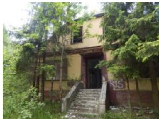
Budynek zarządu cegielni w Sołtykowie

Obiekty te są w ruinie, wymagają zabezpieczenia i ochrony, ponieważ stanowią znikomą część dawnych założeń fabrycznych. Najważniejszą formą ochrony powinno być zabezpieczenie tych relikwów przed zniszczeniem oraz wandalizmem w otoczeniu ich naturalnego zaplecza