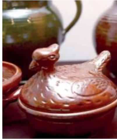
Ceramika Jarosława Rodaka