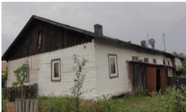
Dom robotniczy w zespole osiedla Odlewni Żeliwa, ul. Kościuszki 144 w Bliżynie

Zabudowa mieszkalna powinna być objęta ochroną jako dziedzictwo kulturowe Staropolskiego Okręgu Przemysłowego. W rejonie zachowały się obiekty SOP: fabryki, odlewnie, kuźnice, walcownie, urządzenia wodne, itp. Często są to obiekty w ruinie, nieużytkowane. Nie zachowały się natomiast zespoły zabudowy mieszkalnej i usługowej o charakterze wiejskim tego Okręgu.