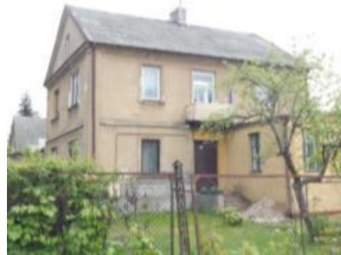
Zespół Nadleśnictwa., ul. Kościuszki 81 w Bliżynie

Zabytkowe nagrobki, zachowujące walory artystyczne znajdują się przede wszystkim na "starym cmentarzu" i cmentarzu przy kościele p.w. św. Zofii w Bliżynie. Nagrobki pochodzą z XIX w. i początku XX w. Najczęstszą formą są nagrobki w stylu neogotyckim, m.in.: na ośmiobocznej podstawie i zwieńczone krzyżem, różnego typu krucyfiksy na kamiennej podstawie, tablice oraz obramowania grobów. Często są elementy żeliwne (krzyże, obramowania grobów) lub całe żeliwne nagrobki - np. w formie pnia drzewa. Na innych pozostałych cmentarzach wymieszane są nagrobki stare (z początku XX w.) i nowe (współczesne), wśród których znajdują się liczne nagrobki będące także Miejscami Pamięci Narodowej.