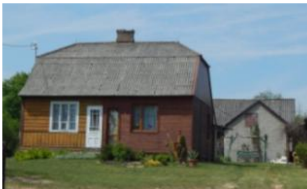
Dom drewniany z zagrodą w Nowkach