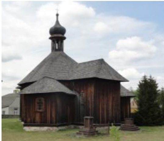
KOŚCIÓŁ FILIALNY PW. ŚW. ZOFII w zespole kościoła fil. p.w. św. Zofii w Bliżynie