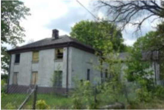
Oficyna w zespole Pałacyku Platerów