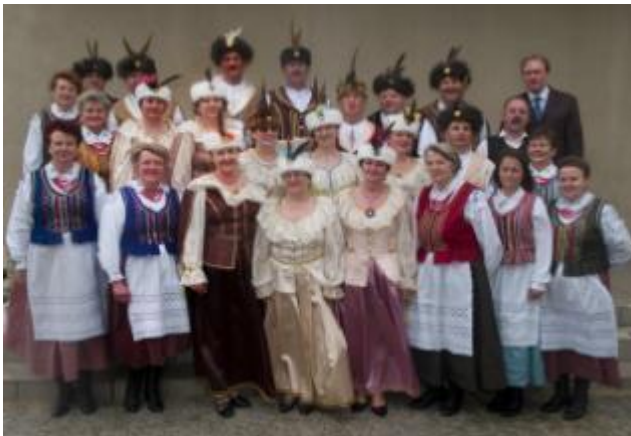
Zespół Pieśni i Tańca "Sorbin"