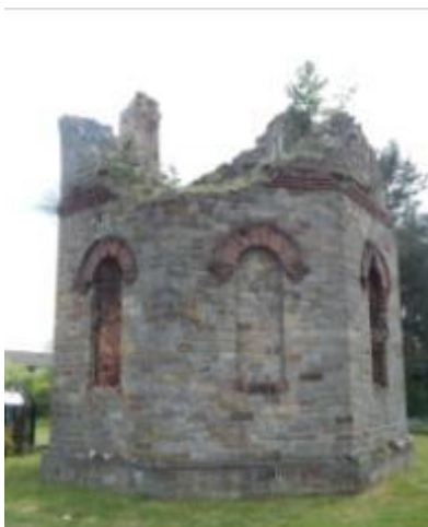
Pozostałości odlewni żeliwa „Ludwików”