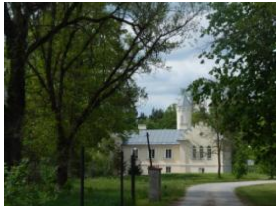
PARK w zespole Pałacyku Platerów w Bliżynie

Pozostałość dawnego założenia pałacowego - oficyna - wykonany w stylu neogotyckim. Leżący nieopodal klasycystyczny pałac z końca XVIII w. został zniszczony w 1 ćw. XX w., a jego reszta została przebudowana. W czasie II wojny światowej obiekt służył Niemcom jako komendantura obozu pracy i obozu koncentracyjnego - "filia Majdanka".