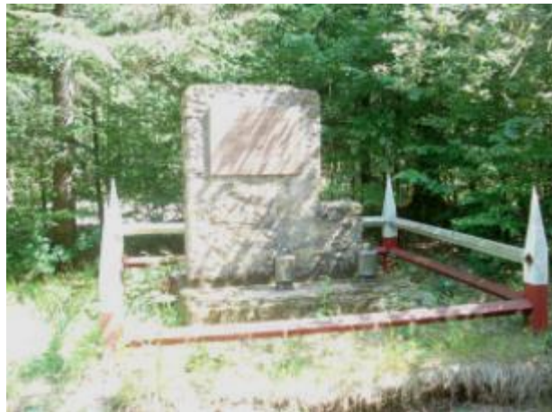
Miejsce bitwy oddziału mjr Hubala „Rogowy słup” w rejonie rezerwatu Świnia Góra