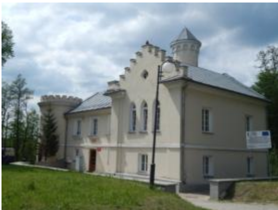
ZAMECZEK NEOGOTYCKI w zespole Pałacyku Platerów wraz z terenem w granicach działki nr 872/6 w Bliżynie