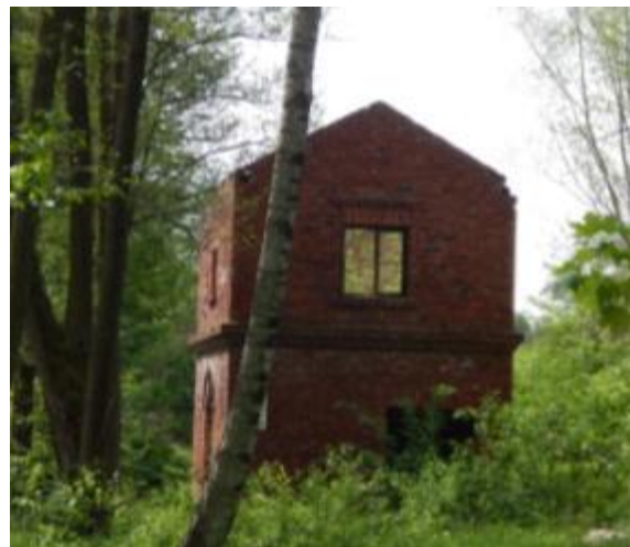
Młyn wodny w Gilowie