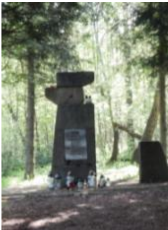
Cmentarz radzieckich jeńców wojennych 1941-1943 w Wojtyniowie

Na terenie gminy Bliżyn ważne dla regionu wydarzenia historyczne upamiętnione są pomnikami. Najczęściej Miejsca Pamięci Narodowej upamiętniają okres II wojny światowej, ważne bitwy tego czasu, ofiary obozu koncentracyjnego, itp. Ponadto na cmentarzach katolickich w gminie znajdują się liczne nagrobki - miejsca pochówku ofiar wojen.