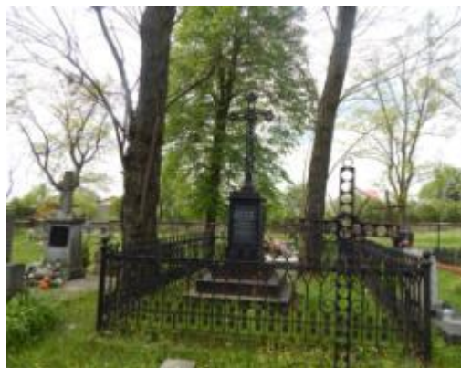
Nagrobki na "starym cmentarzu w Bliżynie

Zabytkowe nagrobki, zachowujące walory artystyczne znajdują się przede wszystkim na "starym cmentarzu" i cmentarzu przy kościele p.w. św. Zofii w Bliżynie. Nagrobki pochodzą z XIX w. i początku XX w. Najczęstszą formą są nagrobki w stylu neogotyckim, m.in.: na ośmiobocznej podstawie i zwieńczone krzyżem, różnego typu krucyfiksy na kamiennej podstawie, tablice oraz obramowania grobów. Często są elementy żeliwne (krzyże, obramowania grobów) lub całe żeliwne nagrobki - np. w formie pnia drzewa. Na innych pozostałych cmentarzach wymieszane są nagrobki stare (z początku XX w.) i nowe (współczesne), wśród których znajdują się liczne nagrobki będące także Miejscami Pamięci Narodowej.