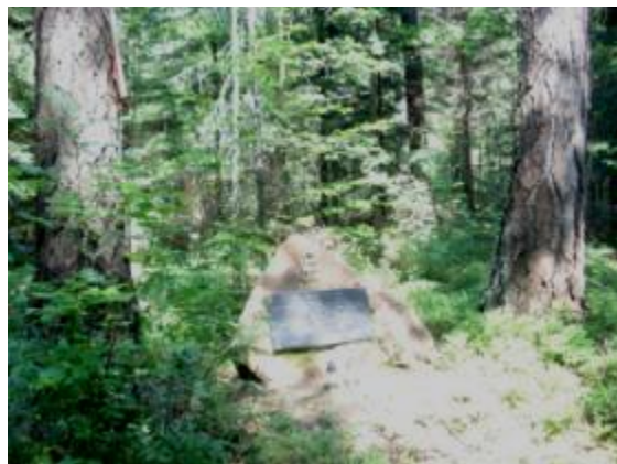
Głaz pamięci oddziałów partyzanckich "Nurta" w rejonie rezerwatu Dalejów