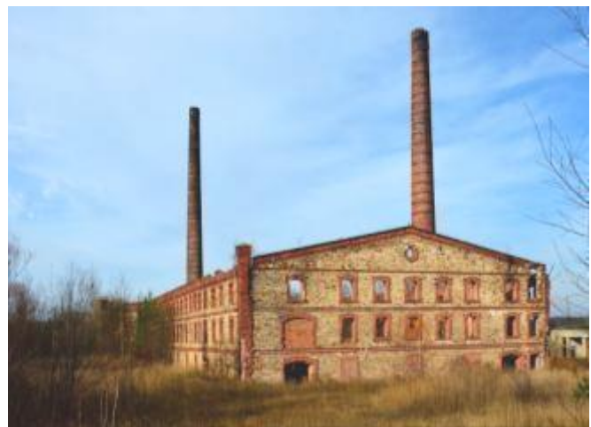
Ruiny cegielni w Sołtykowie

W roku 1928, ze względu na walory klimatyczne okolic, opracowano projekt luksusowego Uzdrowiska Sportowo-Klimatycznego, w którym przewidziano budowę obiektów do uprawiania większości ówczesnych dyscyplin olimpijskich. Planów tych nie zdążono zrealizować.