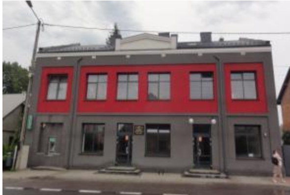
Dom ludowy stowarzyszenia kupców, ob. dom handlowy ul. Kościuszki w Bliżynie