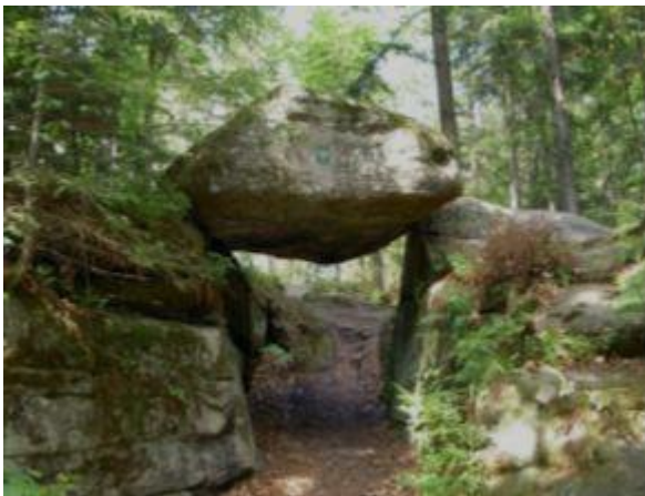
Brama piekielna w rezerwacie Świnia Góra