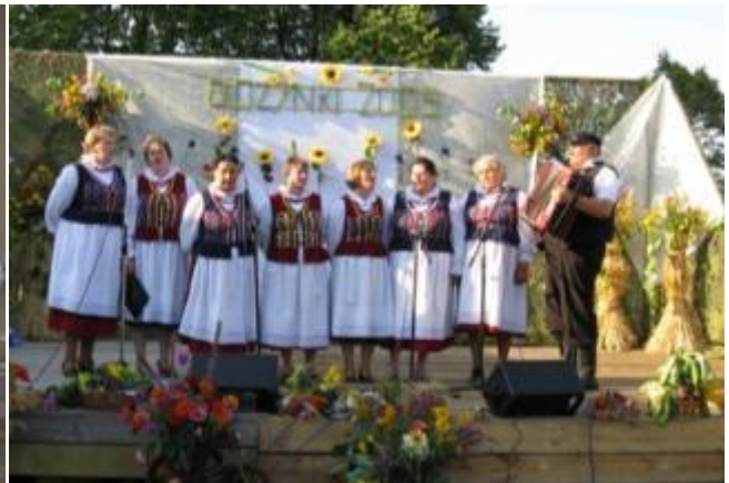
Zespół Ludowy "Kuźniczanki"

W gminie działa Koło Gospodyń Wiejskich w Sorbinie, które skupia kobiety kultywujące zwyczaje kulinarne i obrzędowość związaną ze świętami kościelnymi.