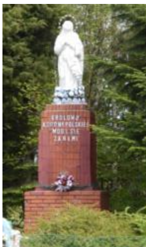
Współczesna figura Matki Boskiej w Piętach