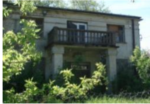
Stajnia w zespole Pałacyku Platerów

Bogatą historię kultury technicznej regionu dokumentują dziś nieliczne zabytki w Bliźnie i w Sołtykowie.