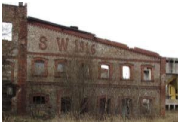
Ruina cegielni w Sołtykowie