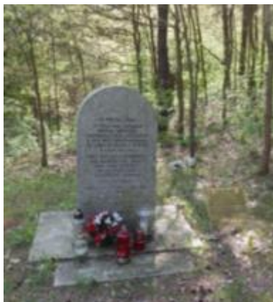
Pomnik upamiętniający śmierć więźniów obozu koncentracyjnego w Bliżynie