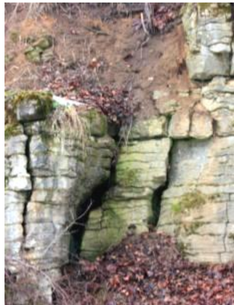
Kamieniołom w Gostkowie

Ponadto w gminie znajduje się kamieniołom w Gostkowie, składający się z 3 dużych, i kilku małych wyrobisk. W środkowym wyrobisku można na jednej ze ścian rozpoznać ślady po kominie krasowym; czyli pionowym lub bardzo stromym, biegnącym w górę odcinku jaskini, o zamkniętym przekroju, bez możliwości dalszego przejścia. W obrębie kamieniołomu (prawdopodobnie w najbardziej na zachód wysuniętym wyrobisku) leży niedostępna już dziś jaskinia.