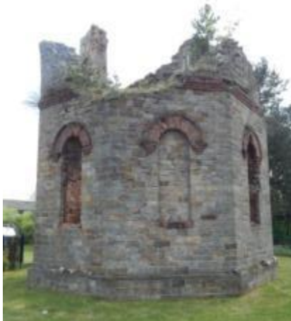
Fragment wieży ciśnieniowej ul. Rudowskiego w Bliźnie

Bogatą historię kultury technicznej regionu dokumentują dziś nieliczne zabytki w Bliźnie i w Sołtykowie.