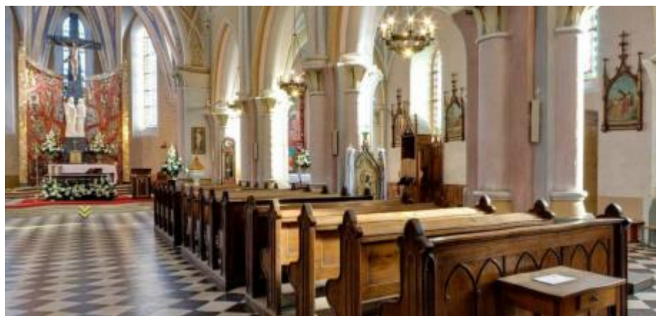
Wnętrze kościoła p.w. św. Ludwika w Bliżynie

Wśród zabytków ruchomych na terenie gminy znajdują się obiekty stanowiące wyposażenie kościołów: Bliżyn - p.w. św. Ludwika i p.w. św. Zofii, Mroczków - p.w. św. Rocha, częściowo przeniesione do kościoła p.w. Matki Boskiej Nieustającej Pomocy.