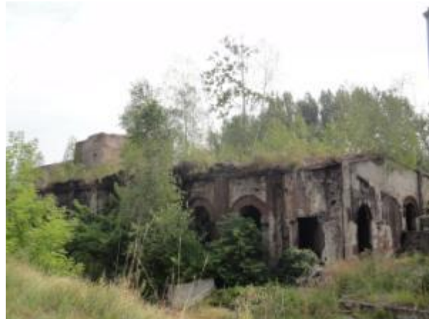
Pozostałości odlewni żeliwa ul. Staszica w Bliźnie