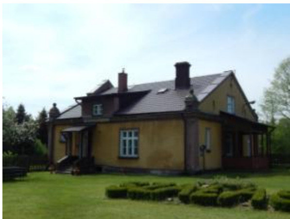
Leśniczówka w Szałasie

W miejscowościach spotyka się obiekty dawnej zabudowy wsi, głównie domy mieszkalne, ale też pojedyncze obiekty gospodarskie np. stodoły czy piwniczki ziemne, obiekty związane z działalnością okołorolniczą np. młyn. Są to obiekty będące własnością prywatną, w różnym stanie technicznym.