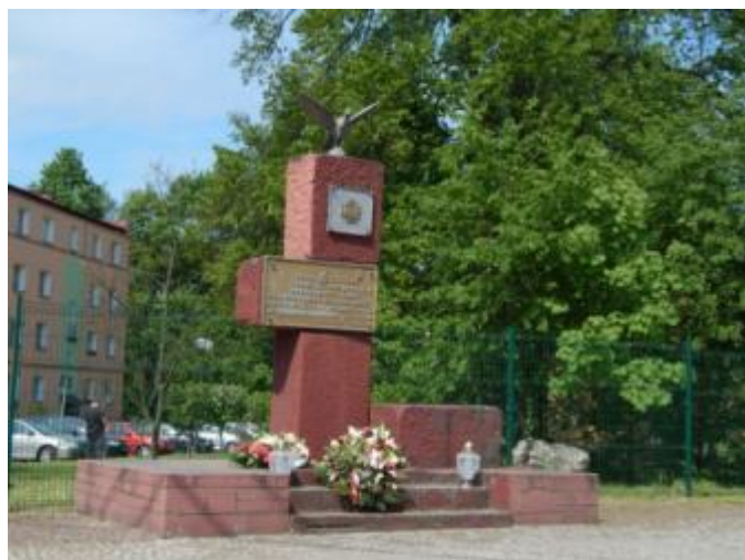
Pomnik ofiar II wojny światowej w Bliżynie

Częstym elementem krajobrazu gminy Bliżyn są kapliczki i krzyże przydrożne, o które dbają mieszkańcy poszczególnych miejscowości.