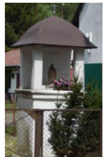
Kapliczka Matki Boskiej w Bliżynie