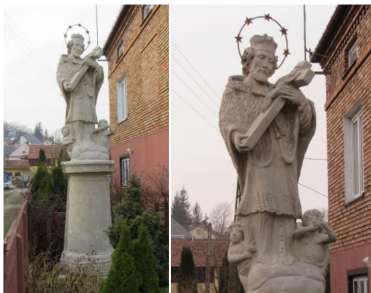
Figura przydrożna w miejscowości Chroberz wpisana do Rejestru Zabytków Nieruchomych Województwa Świętokrzyskiego decyzją z dnia 11.10.2010r., nr rejestru: 274B..