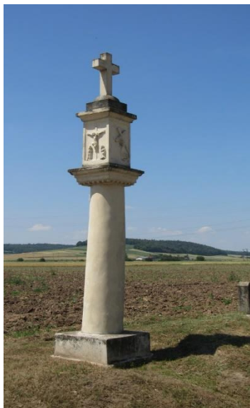
Kapliczka przydrożna w miejscowości Nieprowice wpisana do Rejestru Zabytków Ruchomych Województwa Świętokrzyskiego decyzją z dnia 04.06.2009r., nr rejestru:163B.