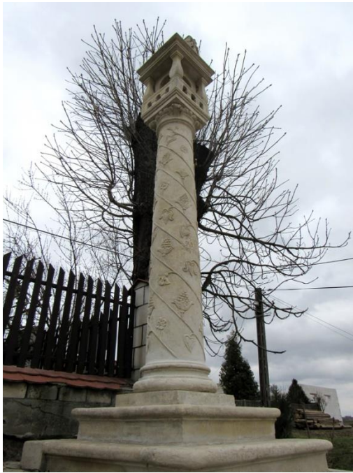
Kapliczka przydrożna w miejscowości Chroberz wpisana do Rejestru Zabytków Ruchomych Województwa Świętokrzyskiego decyzją z dnia 11.10.2010r., nr rejestru: 275B..

Kapliczka w formie słupa, latarni, wysoka. Kolumna na dwuchodowym postumencie, okrągła na małej bazie, z wijącym się motywem roślinnym winorośli na całej wysokości. Powyżej ozdobne zakończenie bez kapitelu, rozszerzające się, przechodzące w kwadratową latarenkę. Latarnia na ażurowej podbudowie, kolumny w formie tralek, na nich wsparty czterospadowy daszek. Na obramieniu latarni znajduje się inskrypcja: ANNO DNI 1677r. Prace konserwatorskie przeprowadzone w 2016r. (w trakcie prac odczytano datę: „1673”).