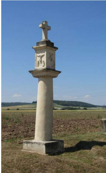
Kapliczka przydrożna w miejscowości Nieprowice wpisana do Rejestru Zabytków Ruchomych Województwa Świętokrzyskiego decyzją z dnia 04.06.2009r., nr rejestru:163B.