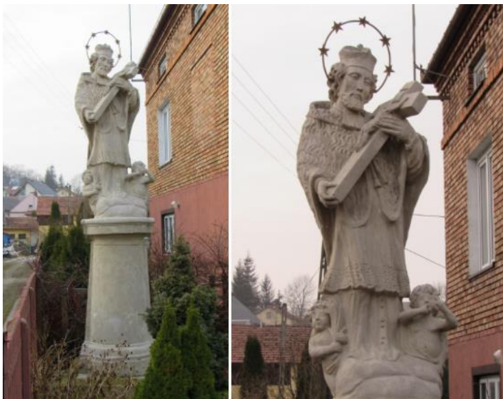
Figura przydrożna w miejscowości Chroberz wpisana do Rejestru Zabytków Nieruchomych Województwa Świętokrzyskiego decyzją z dnia 11.10.2010r., nr rejestru: 274B..