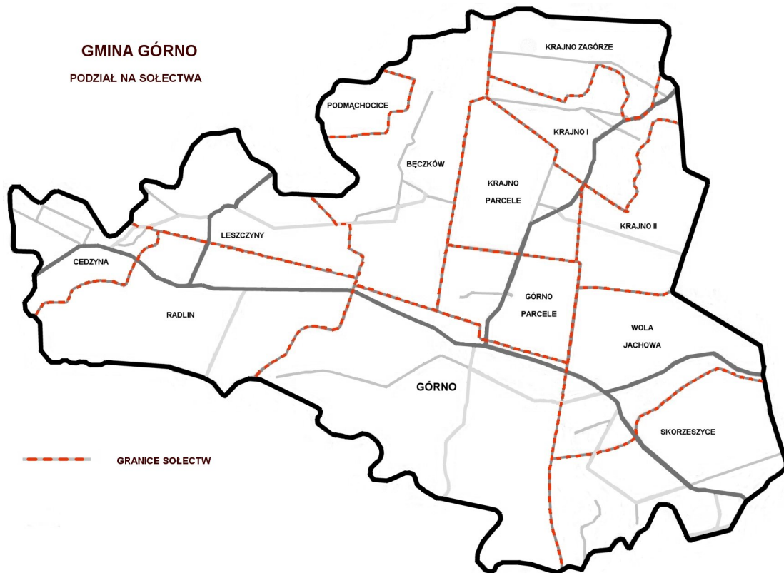
Mapa Gminy Górnó