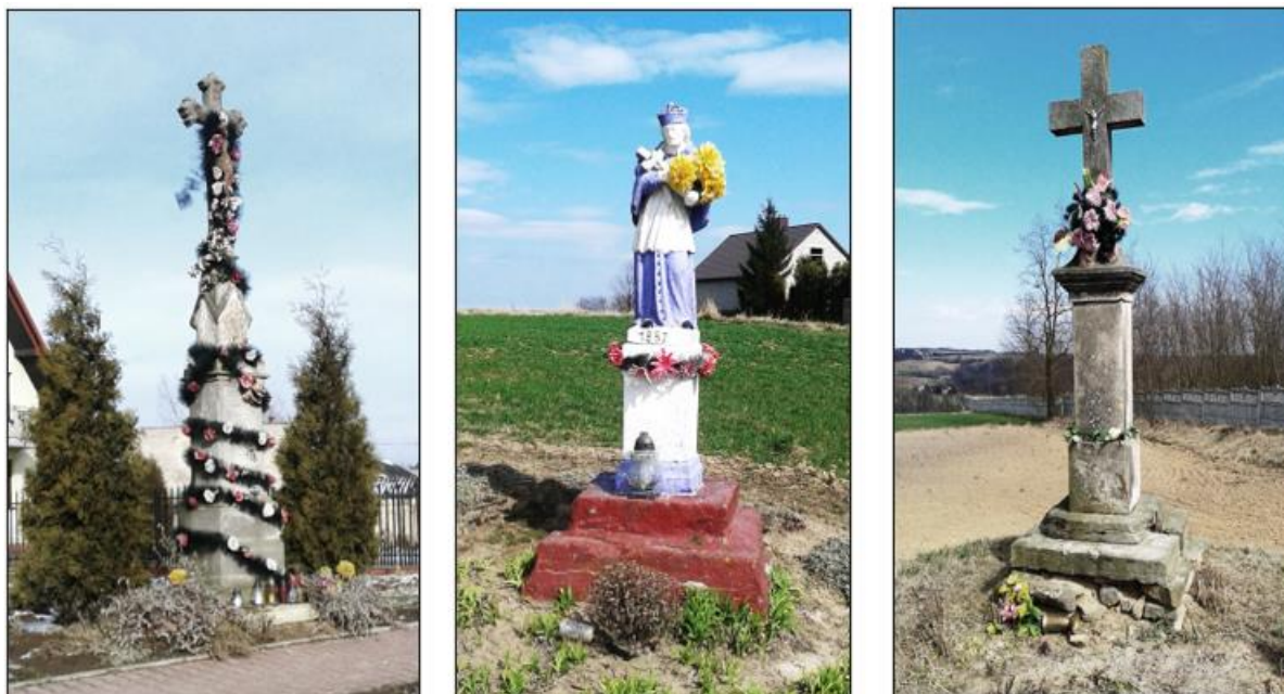
Fotografia 1. Przykłady figur i kapliczek przydrożnych na terenie gminy Waśniów.

Krzyże i figury zaopatrzone są w epigramy, zazwyczaj o charakterze wotywnym, choć często spotyka się inskrypcje odwołujące się do bożej opieki, lub rymowane sentencje modlitewne stanowiące ważny element kultury ludowej. Zły stan zachowania inskrypcji utrudniający ich odczytanie jest wynikiem nie tyle naturalnej erozji kamienia, co częstym malowaniem trwałymi farbami, które łącząc się z kamienną strukturą spowodowały jej łuszczenie i ubytki.