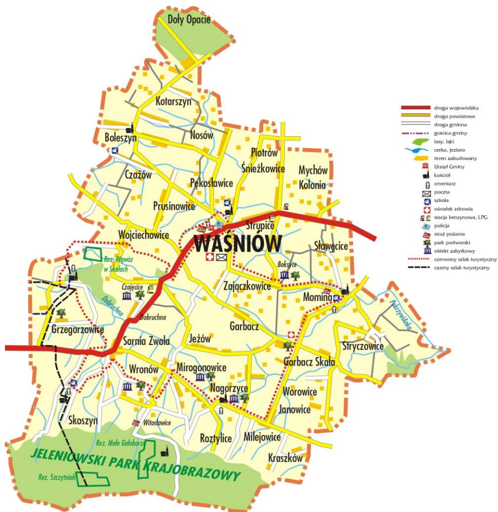
Rysunek 1. Granice administracyjne Gminy Waśniów.