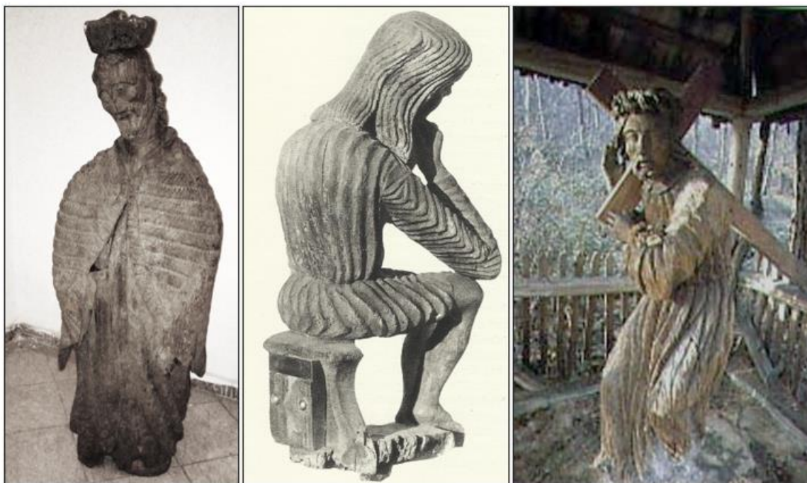
Fotografia 2. Obiekty rzeźby ludowej z terenu gminy Waśniów.

Wykaz obiektów ujętych w Rejestrze Zabytków Ruchomych, przedstawiono w poniższej tabeli.