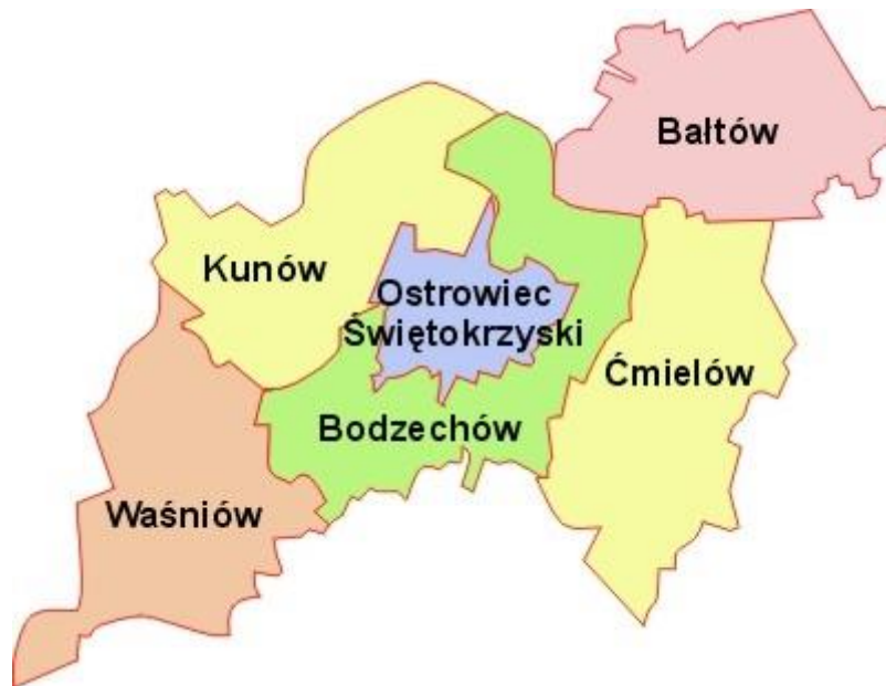
Rysunek 2. Położenie gminy Waśniów na tle powiatu ostrowieckiego.

Pod względem zajmowanej powierzchni Gmina Waśniów jest na czwartym miejscu wśród sześciu gmin powiatu ostrowieckiego. Zgodnie z podziałem fizyczno-geograficznym Polski wg podziału Kondrackiego, Gmina Waśniów położona jest w makroregionie Wyżyny Kieleckiej w obrębie mezoregionów: Wyżyna Sandomierska (Opatowska) i Góry Świętokrzyskie.