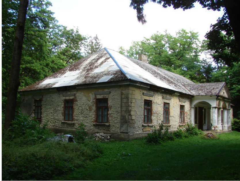
Dwór w Krzcięcicach