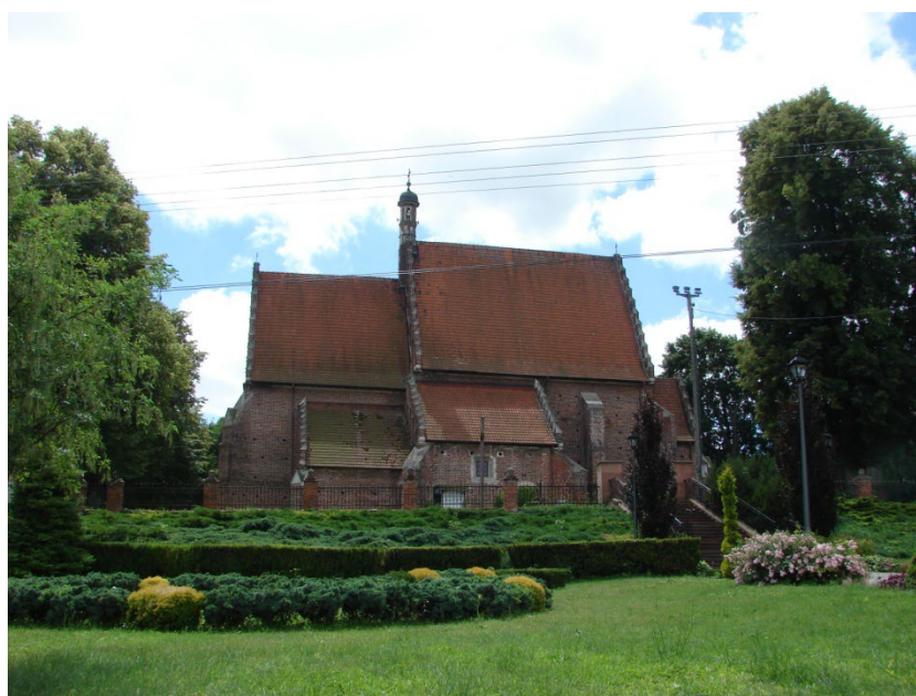
Kościół p.w. św. Prokopa w Krzcięcicach

Kolejnym elementem krajobrazu kulturowego są zespoły kościelne. Na terenie gminy Sędziszów znajdują się cztery kościoły, z czego trzy wpisane są do rejestru zabytków (Krzcięcice, Sędziszów, Tarnawa). Kościół w Mstyczowie znajduje się w Wojewódzkiej Ewidencji Zabytków. Najstarszy, późnogotycki kościół w Krzcięcicach, wybudowany w XVI wieku ma największe walory zabytkowe. Niewiele ustępuje mu XVIII wieczny kościół w Sędziszowie, który również posiada dużą wartość jako zabytek.