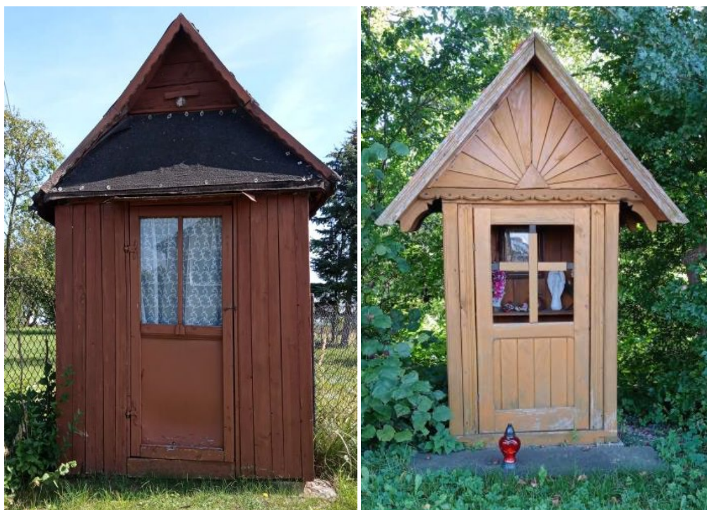
kapliczka w Białowieży i Mstyczowie

Charakterystyczne dla krajobrazu gminy Sędziszów są drewniane kapliczki domkowe w Białowieży, Mstyczowie i Klimontowie oraz murowana w Lipiu. Posiadają one duże wartości artystyczne. Spotykane są również kamienne i drewniane krzyże przydrożne.