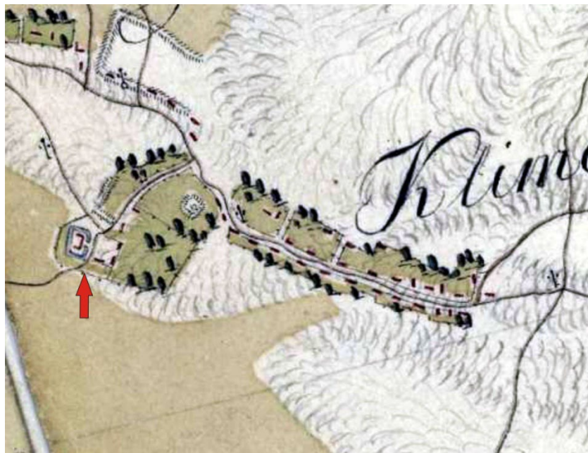
Klimontów na Mapie Galicji Zachodniej z lat 1801-1804 (czerwoną strzałką oznaczono dwór)

Kopiec ziemny, na którym znajdował się dwór otoczony był fosą, której pozostałości widoczne są w terenie.