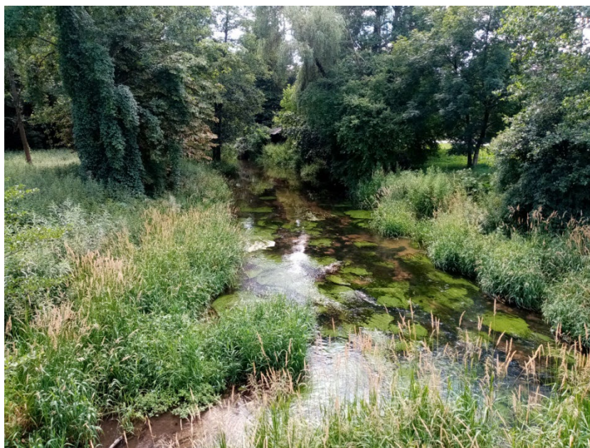
Rzeka Mierzawa w Sędziszowie

Przez teren gminy przepływa rzeka Mierzawa oraz jej dopływy - ciek wodne: „Lipka”, „od Słupi”, „Łowinianka”, które ją zasilają. Towarzyszą im starorzecza i tereny podmokłe, na których wykształciły się zbiorowiska łąkowo-szuwarowo-bagienne. Są to miejsca występowania rzadkich gatunków ptaków wodno-błotnych. Dolina Mierzawy posiada wysokie walory krajobrazowe. Charakterystycznym elementem szaty roślinnej są bogate zbiorowiska kserotermiczne. Zachodnia i południowo-zachodnia część gminy położona jest w Miechowsko-Działoszyckim Obszarze Chronionego Krajobrazu (M-DzOChK). Obejmuje ona także fragment obszaru Dolina Górnej Mierzwy, w ramach sieci NATURA 2000. W Gminie Sędziszów znajdują się następując pomniki przyrody: buk szkarłatny - przy ul. Dworcowej w Sędziszowie, 4 dęby szypułkowe w miejscowości Mstyczów, dąb szypułkowy w miejscowości Szałas, modrzew europejski w miejscowości Mstyczów.