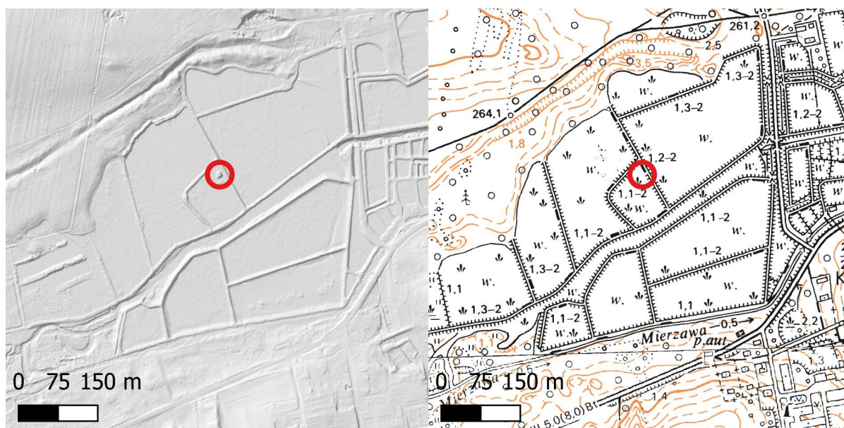
Położenie gródka - reliktyw rezydencji możnowładczej w Krzelowie (stan. 3 AZP 92-57/27)