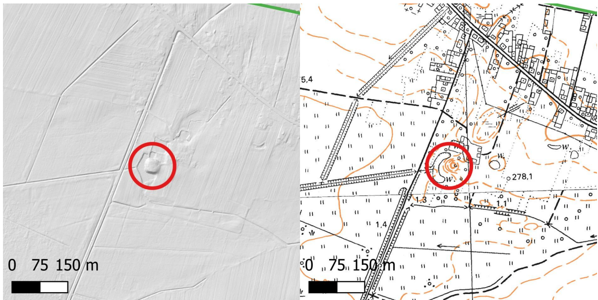
Położenie kopca ziemnego i reliktyw dworu w Klimontowie (stan. 7 AZP 93-57/2)

Kopiec ziemny, na którym znajdował się dwór otoczony był fosą, której pozostałości widoczne są w terenie.