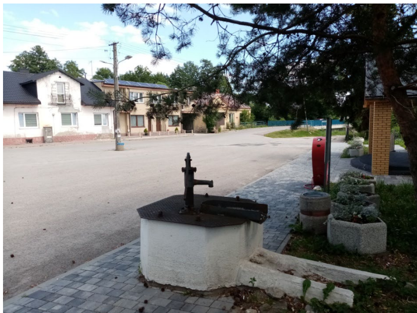
Rynek w Sędziszowie