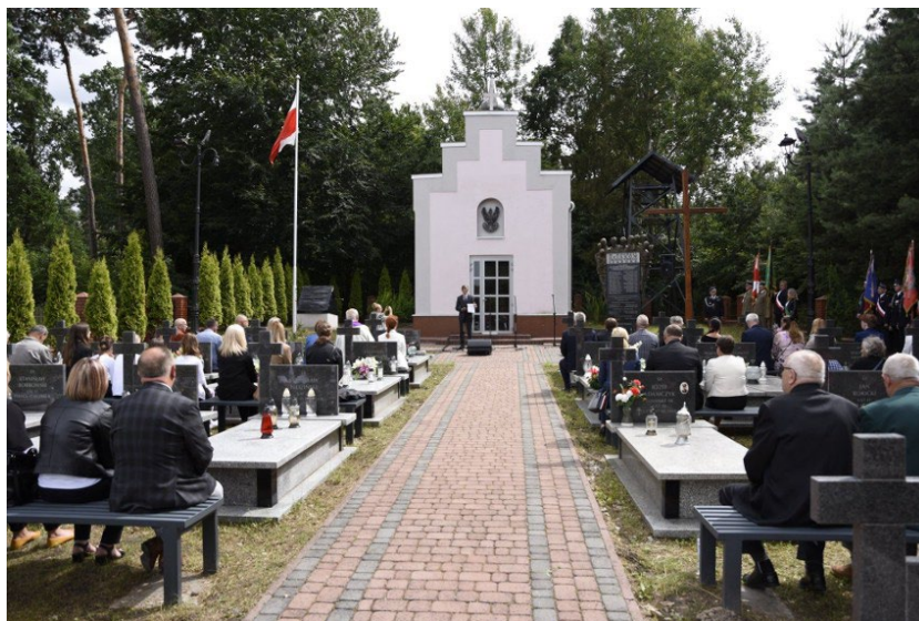
Cmentarz Ofiar Egzekucji z 1944 roku (źródło: https://echodnia.eu/swietokrzyskie/uroczystosc-na-cmentarzu-ofiar-egzekucji-w-swaryszowie-w-gminie-sedziszow-upamietniono-pomordowanych-mieszkancow-wsi-polskiej )

W latach 2018-2021 odremontowano cztery budynki na Osiedlu Drewnianym poprzez wymianę stolarki okiennej i drzwiowej, docieplenie stropów i ścian zewnętrznych, wykonanie nowego deskowania elewacji. Na trzech blokach wymieniono także pokrycie dachowe na nowe. Koszt inwestycji wynosił 2 361 803,60 zł. W ostatnich latach został również odremontowany zespół kościoła parafialnego w Sędziszowie.