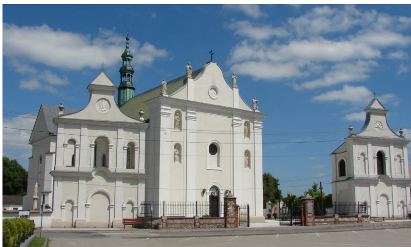
Kościół p.w. śś Piotra i Pawła w Sędziszowie

W latach 2018-2021 odremontowano cztery budynki na Osiedlu Drewnianym poprzez wymianę stolarki okiennej i drzwiowej, docieplenie stropów i ścian zewnętrznych, wykonanie nowego deskowania elewacji. Na trzech blokach wymieniono także pokrycie dachowe na nowe. Koszt inwestycji wynosił 2 361 803,60 zł. W ostatnich latach został również odremontowany zespół kościoła parafialnego w Sędziszowie.