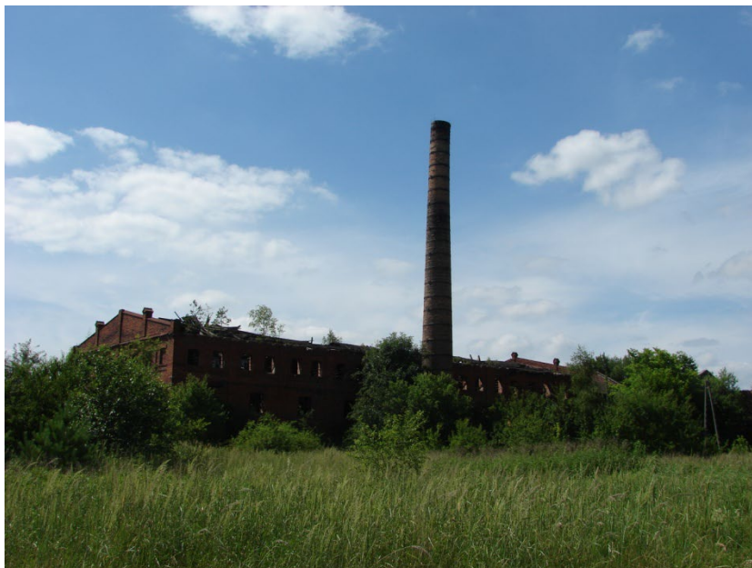
Ruiny cegielni w Mstyczowie

młyny wodne w Krzcięcicach i Sędziszowie, dwór i park w Krzcięcicach oraz Mstyczowie, a także kapliczka w Białowieży.