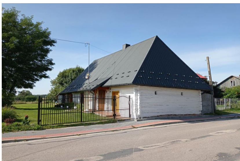
Dom w Mstyczowie

Typowa zabudowa wsi to ulicówka, gdzie domy skupione są wzdłuż głównej osi w postaci drogi. Tradycyjne, drewniane budownictwo zachowało się w niewielkim stopniu, jedynie miejscowość Klimontów może poszczycić się drewnianą, regionalną zabudową. Tylko jeden dom z Mstyczowa znajduje się w Gminnej Ewidencji Zabytków. Jest to dom drewniany, w konstrukcji zrębowej, bielony, nakryty dachem czterospadowym, krytym blachą.