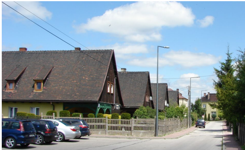
Ulica Kolejowa w Sędziszowie

Ponadto w latach 1939 - 46 powstało osiedle mieszkaniowe pracowników kolei z domkami jednorodziennymi przy ulicy Kolejowej oraz domami wielorodzinnymi na obecnym osiedlu Drewnianym.