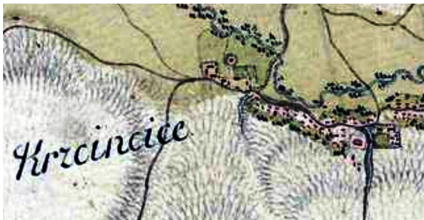
Krzcięcice na Mapie Galicji Zachodniej z lat 1801-1804