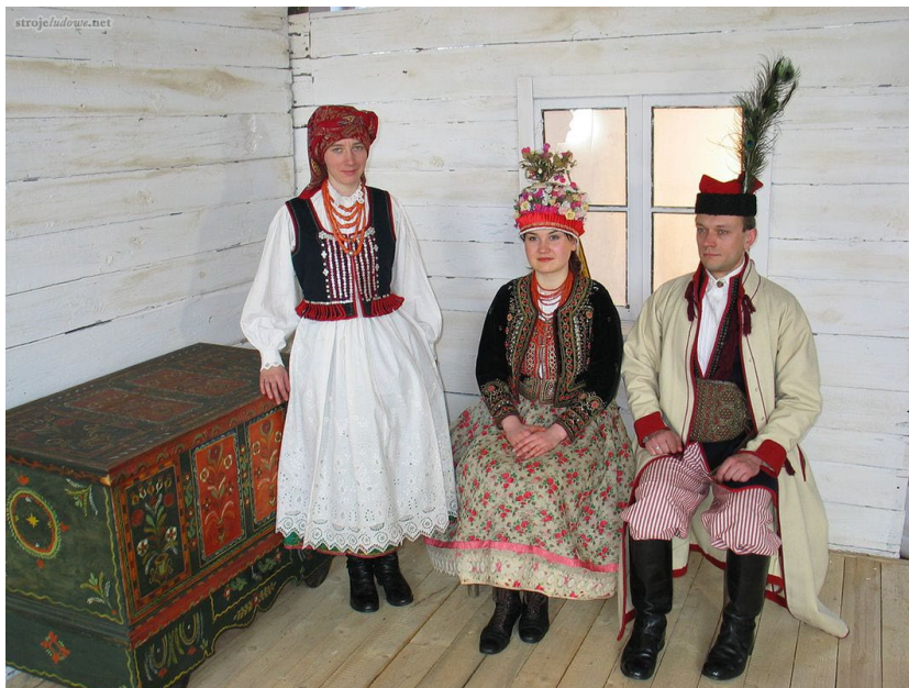
Stroje Krakowiaków Zachodnich

W ujęciu etnograficznym gmina Sędziszów leży na pograniczu grup Krakowiaków Wschodnich i Zachodnich. Męski strój ludowy Krakowiaków Zachodnich to biała koszula i granatowy kaftan, granatowe lub niebieskie, płócienne lub z sukna spodnie w czerwone lub niebieskie prążki, wysokie buty, skórzany pas nabijany gwoździkami, biała, zapinana na haftki i ozdobiona czarnymi lub amarantowymi frędzlami sukmana jako okrycie wierzchnie, czerwona rogatywka z pawim piórem obszyta barankiem (tzw. krakuska). Kobiety natomiast nosiły białą haftowaną koszulę, płócienną halkę, kwiecistą spódnicę, zapaskę i gorset, na głowie białe lub czerwone, haftowane chusty. Gorsety były koloru czarnego lub granatowego, ozdobione haftem, guzikami perłowymi, koralikami, cekinami itp. Noszono również duże kraciaste chusty naramienne. Ważnym elementem stroju były czerwone korale.