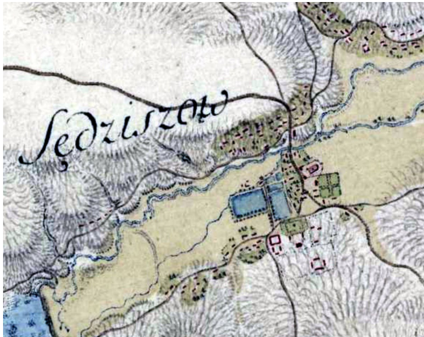
Sędziszów na Mapie Galicji Zachodniej z lat 1801-1804

Bardzo ciekawe założenie posiadał Sędziszów. Składał się z dworu, parku, folwarku, stawów i ogrodów. Zabudowa wiejska znajdowała się po obu stronach Mierzawy. Na lewym brzegu rzeki, na mapie XIX-wiecznego Sędziszowa widoczny jest pusty plac, który obecnie nazywany jest Rynkiem. Być może jest to pozostałość próby założenia miasta. Do dziś pozostała widoczna charakterystyczna zabudowa dwóch stron placu, co przypomina „niedokończony” rynek. Niestety pierwotny Sędziszów został przecięty linią kolejową, która poważnie zaburzyła układ ruralistyczny.