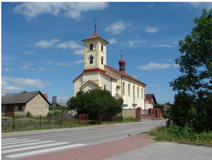
Kościół pw. św. Marcina w Tarnawie

Inne miejscowości takie jak: Piołunka, Łowinia, Pawłowice, Gniewięcin posiadają równie starą średniowieczną metrykę.