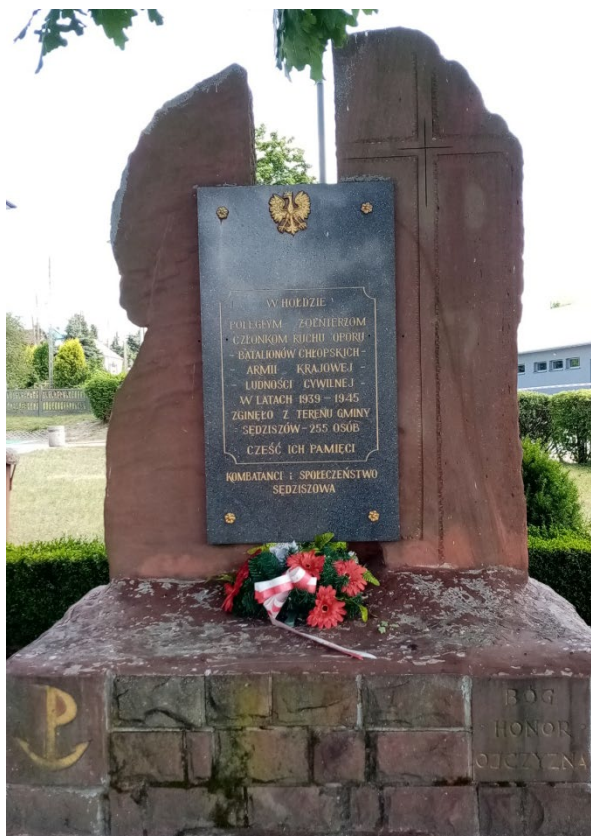
Pomnik w hołdzie poległym żołnierzom w czasie II wojny światowej w Sędziszowie

Typowa zabudowa wsi to ulicówka, gdzie domy skupione są wzdłuż głównej osi w postaci drogi. Tradycyjne, drewniane budownictwo zachowało się w niewielkim stopniu, jedynie miejscowość Klimontów może poszczycić się drewnianą, regionalną zabudową. Tylko jeden dom z Mstyczowa znajduje się w Gminnej Ewidencji Zabytków. Jest to dom drewniany, w konstrukcji zrębowej, bielony, nakryty dachem czterospadowym, krytym blachą.