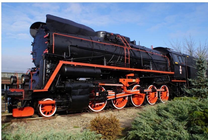
Lokomotywa parowa Ty51-15 stojąca przy ulicy Dworcowej w Sędziszowie

Prawa miejskie otrzymał Sędziszów w 1990 roku.