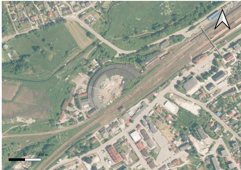
Zdjęcie lotnicze zespołu dworca kolejowego z parowozownią wachlarzową

Ponadto w latach 1939 - 46 powstało osiedle mieszkaniowe pracowników kolei z domkami jednorodziennymi przy ulicy Kolejowej oraz domami wielorodzinnymi na obecnym osiedlu Drewnianym.