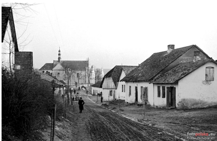
ulica Polna z widocznym kościołem w Sędziszowie

Po zbudowaniu linii kolejowej, stacji i parowozowni zabudowa Sędziszowa przesunęła się w kierunku południowo-zachodnim. Centrum Sędziszowa znajduje się obecnie wokół stacji kolejowej. Powstało wówczas szereg budynków takich jak dworzec kolejowy, budynek kolejowy, budynek administracyjny, wieża ciśnień oraz szczególnie cenna, jako zabytek techniki, parowozownia wachlarzowa z obrotnicą. Wybudowana została w latach 1882-84 do obsługi parowozów kursujących na trasie Dąbrowa Górnicza - Sędziszów. W 1927 roku została zamknięta dla celów trakcyjnych, ale podczas okupacji ponownie uruchomiona. W czasie II wojny światowej dobudowano wachlarz na 37 stanowisk oraz budynki zaplecza, w tym nową wieżę ciśnień. Po wojnie nadal funkcjonowała, powstał również zakład naprawy elektrowozów. Obiekt zakończył swoją działalność na początku lat 90. XX w. Obecnie parowozownia jest w złym stanie. Na jej terenie znajduje się sortownia śmieci.