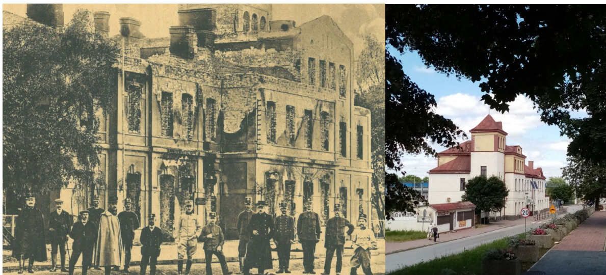
Dworzec kolejowy w Sędziszowie w latach 1914-16 i obecnie

Kolejnym elementem krajobrazu kulturowego są zespoły kościelne. Na terenie gminy Sędziszów znajdują się cztery kościoły, z czego trzy wpisane są do rejestru zabytków (Krzcięcice, Sędziszów, Tarnawa). Kościół w Mstyczowie znajduje się w Wojewódzkiej Ewidencji Zabytków. Najstarszy, późnogotycki kościół w Krzcięcicach, wybudowany w XVI wieku ma największe walory zabytkowe. Niewiele ustępuje mu XVIII wieczny kościół w Sędziszowie, który również posiada dużą wartość jako zabytek.