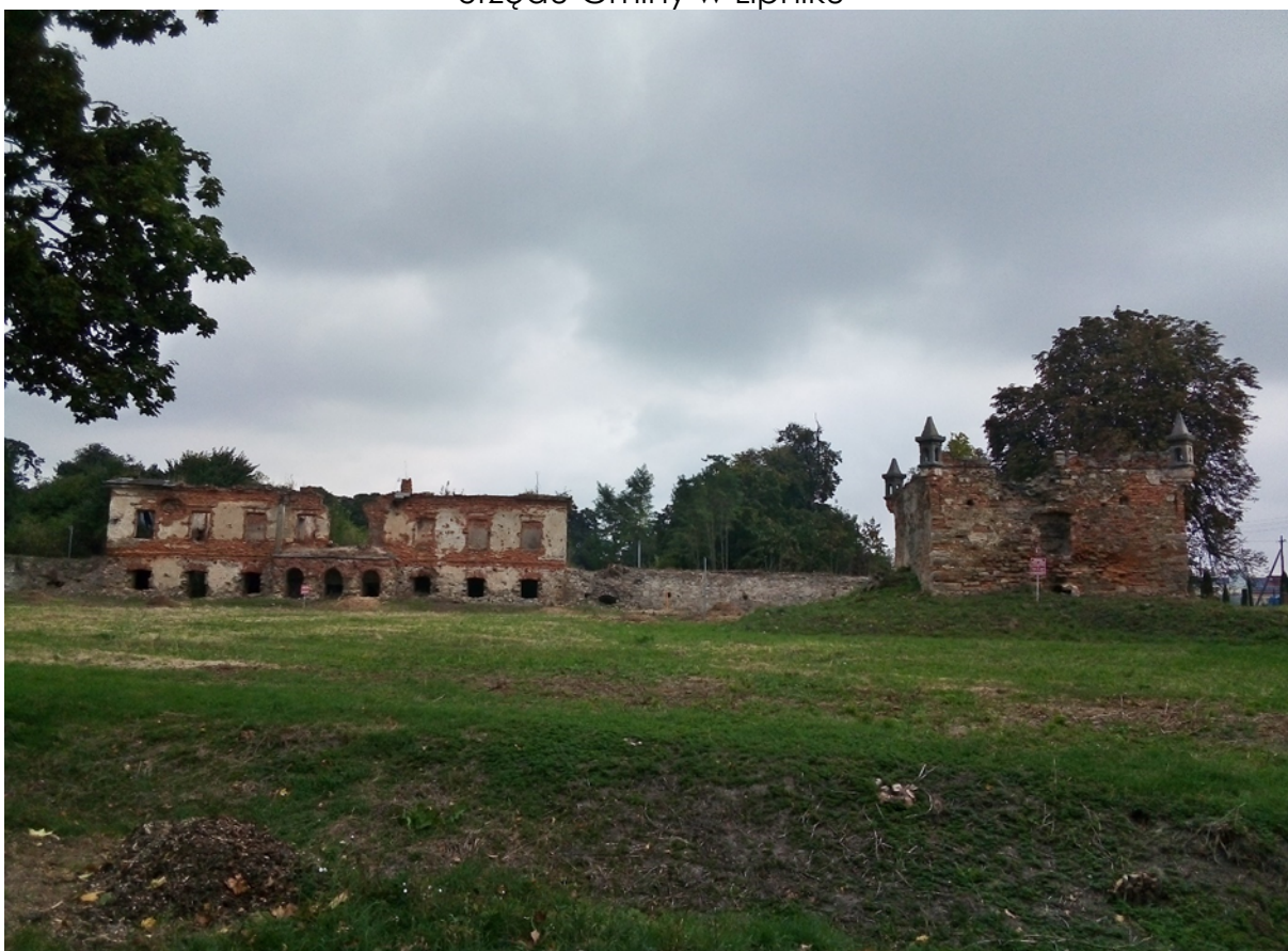
Ruiny oficyny we Włostowie, archiwum Urzędu Gminy w Lipniku