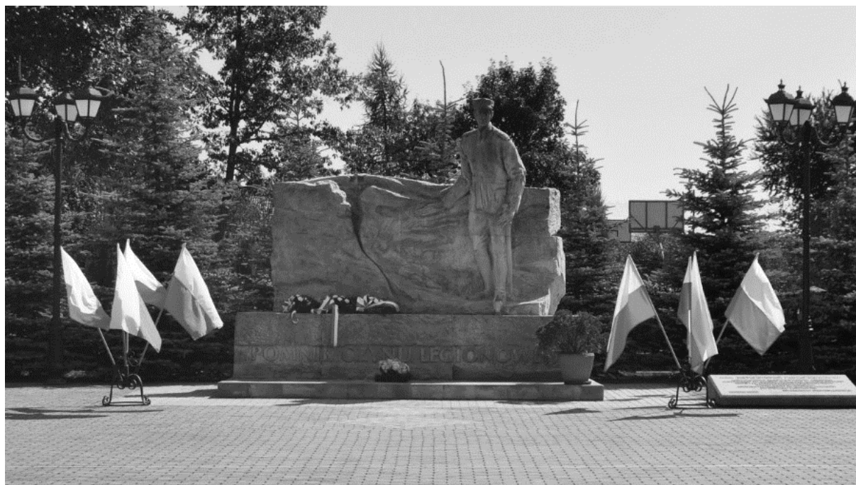
Pomnik „Czynu Legionowego” w Lipniku