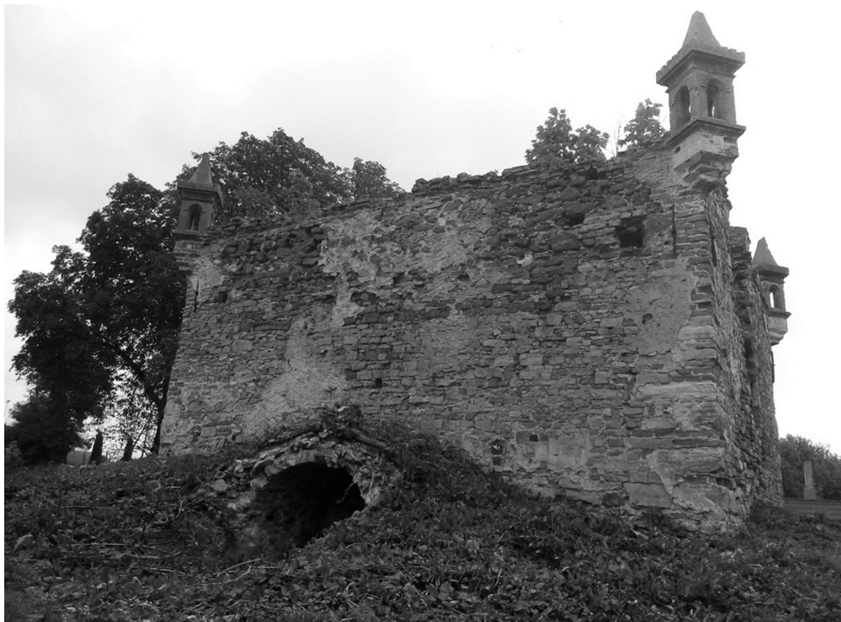
Zbór ariański- lamus widok obecny