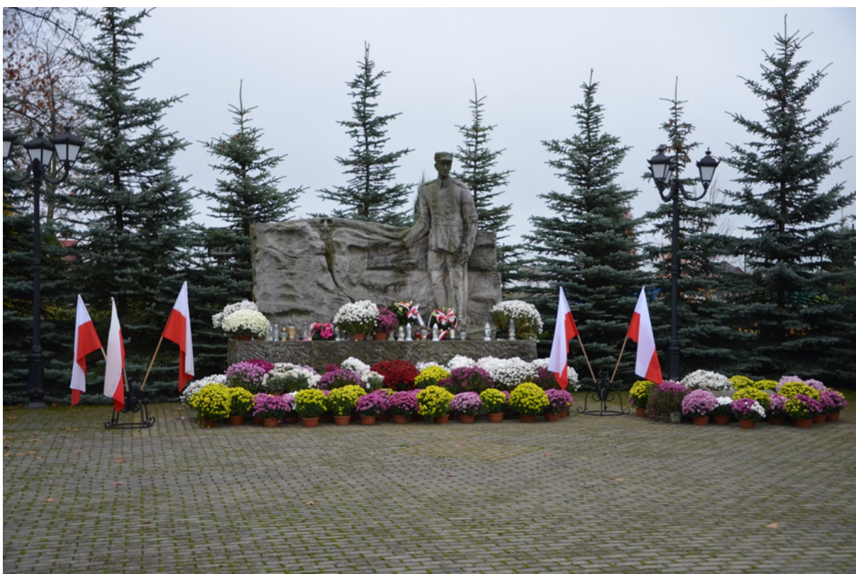
Lipnik, gmina Lipnik, archiwum Urzędu Gminy w Lipniku Gmina Lipnik z lotu ptaka,