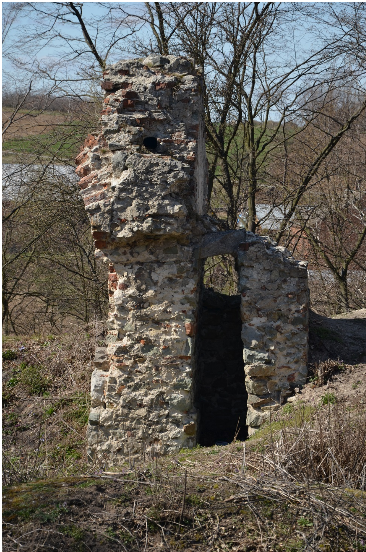
Ruiny zamku w Międzygórze, gmina Lipnik