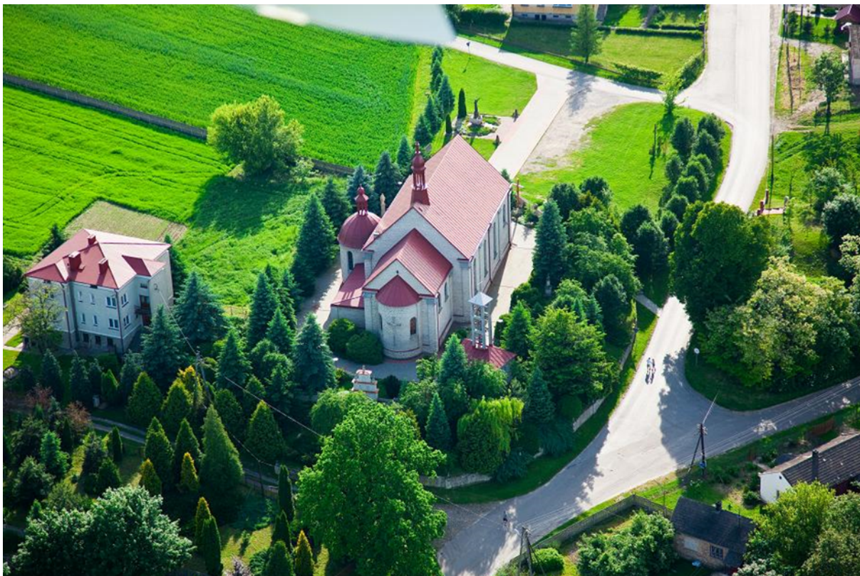
Malice Kościelne