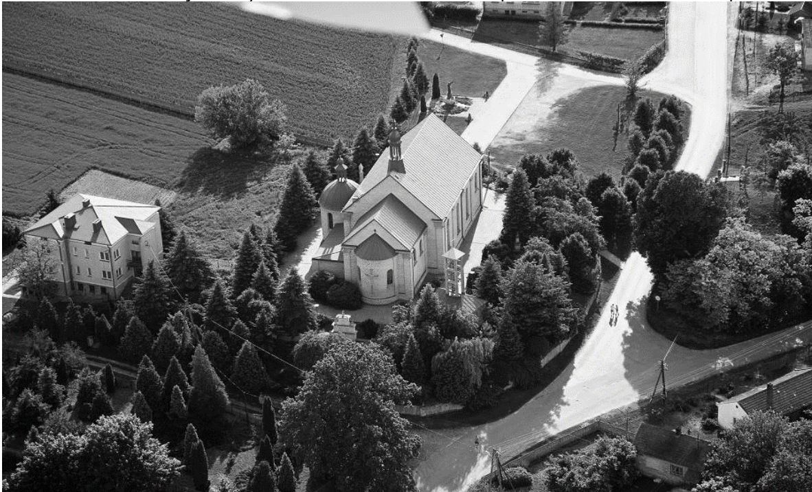
Kościół w Malicach Kościelnych w lotu ptaka

Jedna z najstarszych wsi sandomierskich położona w dolinie Opatówki.