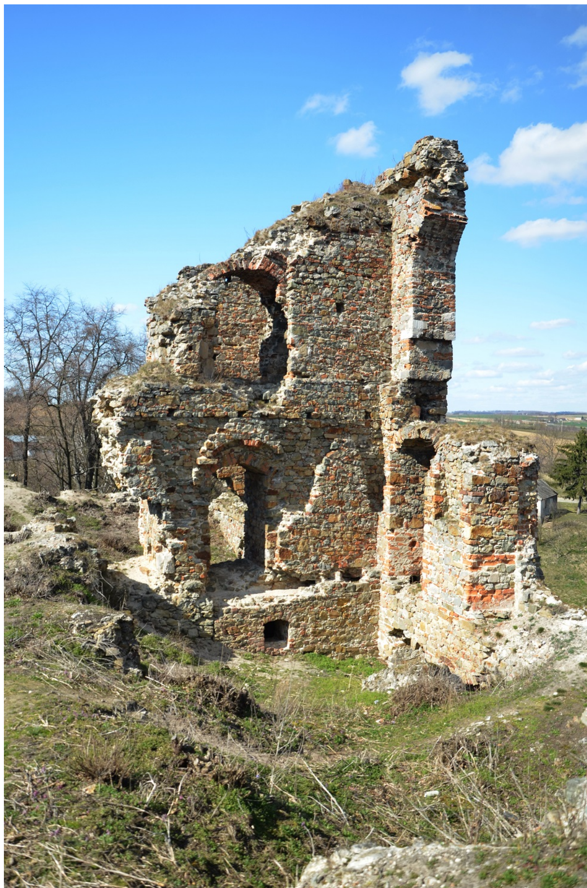
Ruiny zamku w Międzygórzcu, gmina Lipnik