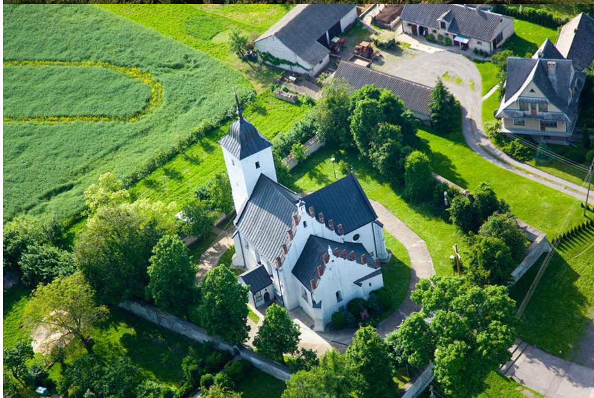
Gmina Lipnik z lotu ptaka, Włostów, archiwum Urzędu Gminy w Lipniku Kościół parafialny we Włostowie