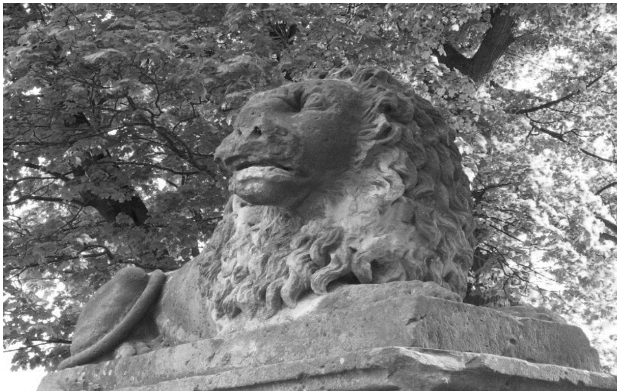
Brama główna z lwami