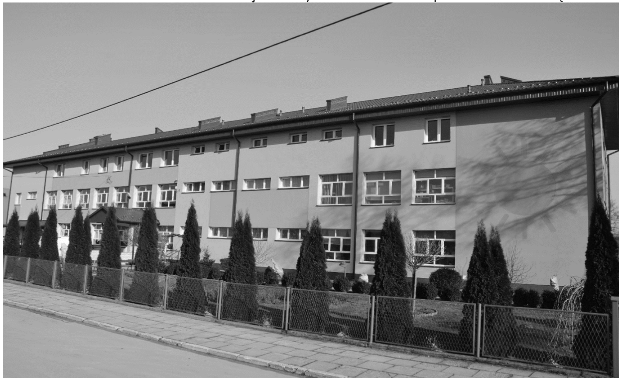
Zespół Szkolno-Przedszkolny w Lipniku

Stara wieś położona przy rozwidleniu ruchliwej szosy Warszawa-Rzeszów i Opatów-Sandomierz, gdzie powstaje swoista strefa gospodarcza nastawiona na obsługę transportu drogowego i podróżnych. Siedziba gminy. Obecnie ma prawie 350 ha powierzchni, 96 domów i około 380 mieszkańców. Jan Długosz zapisał, że Lipnik miał w XV w. jeden folwark, sześć łanów kmiecych, karczmę i dwóch ogrodnarzy. W XIV, XV, XVI i XVII w. Lipnik należał do Lipnickich, możnego rodu sandomierskiego, który pieczętował się herbem Hołobok i wieś ta była ich rodową siedzibą. Jednakże w XV w. ich dobra w ziemi sandomierskiej zostały skonfiskowane ponoć za zdradę.