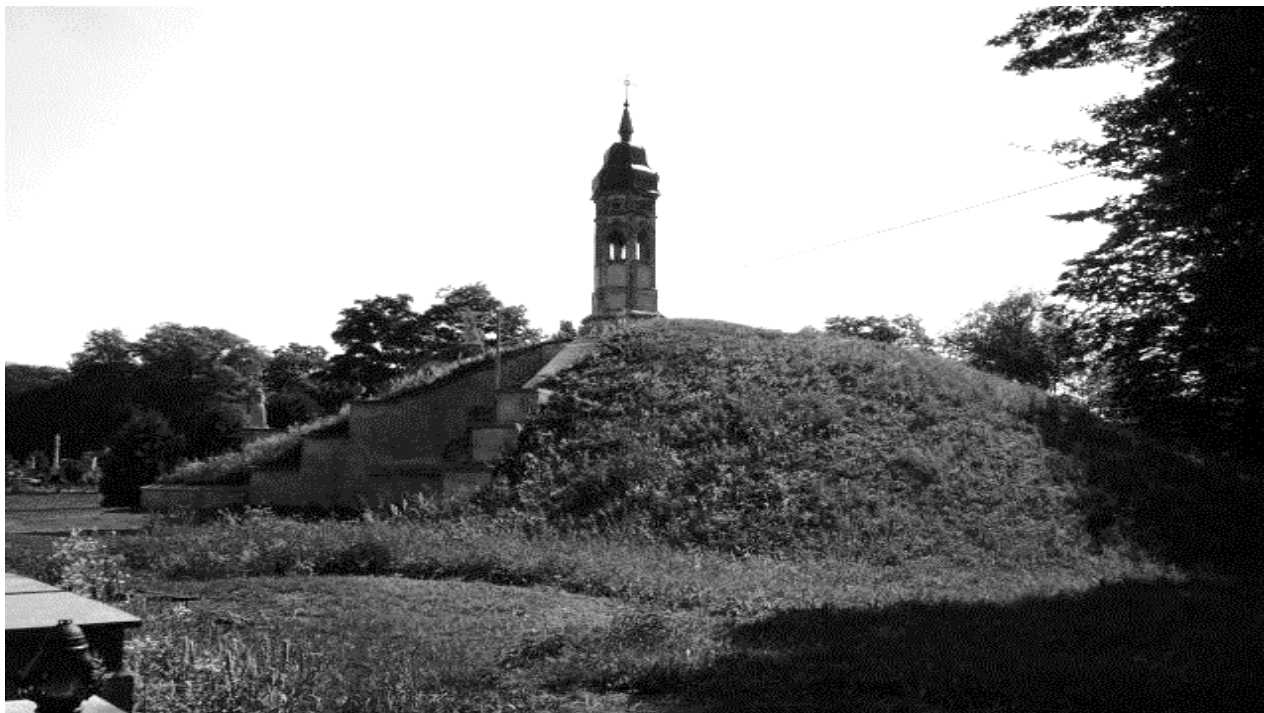
Kaplica grobowa Karskich