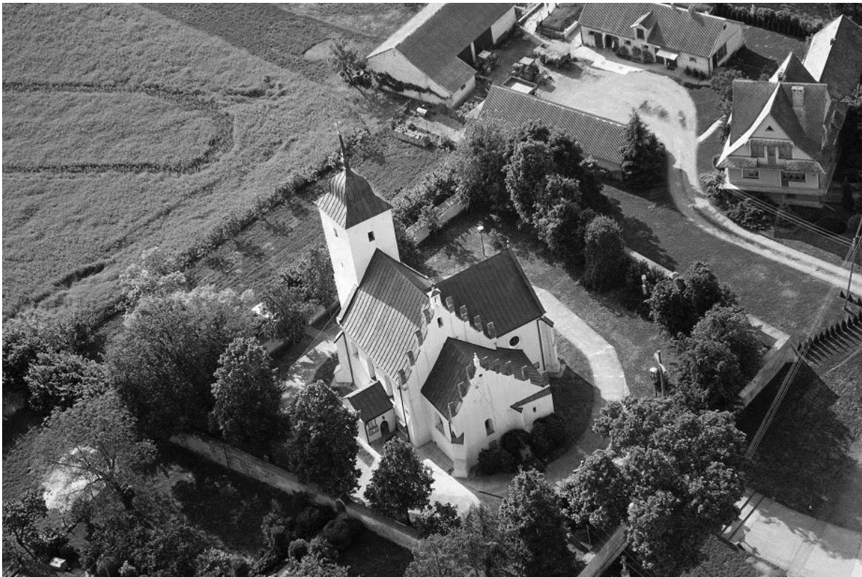
Kościół parafialny we Włostowie z lotu ptaka

Zachowany do dzisiaj kościół włostowski - mimo późniejszej rozbudowy - zawiera średniowieczny trzon. Zapewne wybudowany został w drugiej połowie XIII w., co można wnioskować po późnoromańskim (lub wczesnogotyckim) stylu, a właściwie to przejściowym, od romańskiego do gotyckiego. Widać to wyraźnie w prezbiterium, w jego jednoprzęsłowym sklepieniu krzyżowym, a także w oknach północnej ściany nawy. Pierwszą rozbudowę kościół przeszedł w XIV w. Wtedy też mógł otrzymać wieżę.