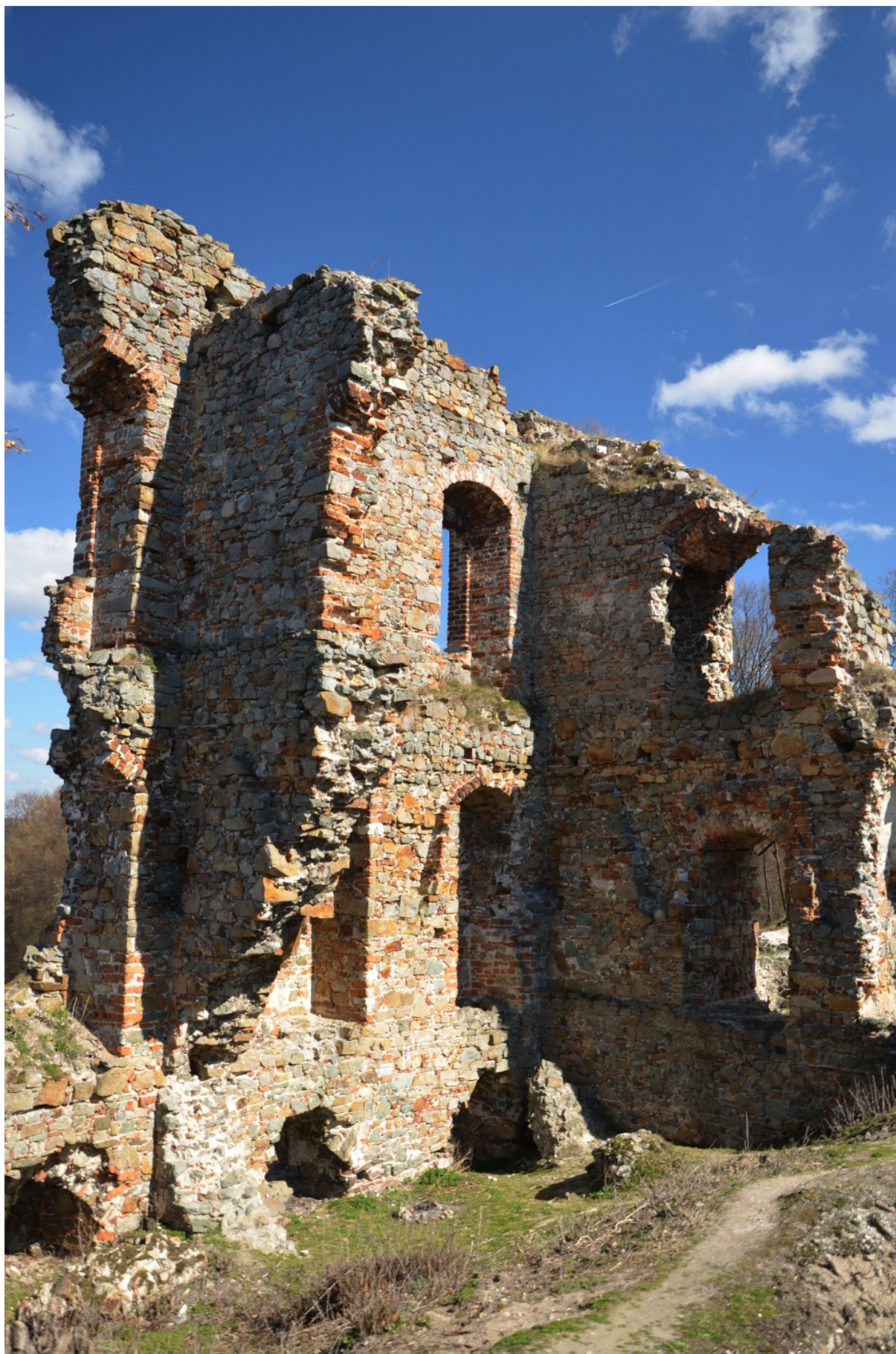
Ruiny zamku w Międzygórzu, gmina Lipnik, archiwum Urzędu Gminy w Lipniku