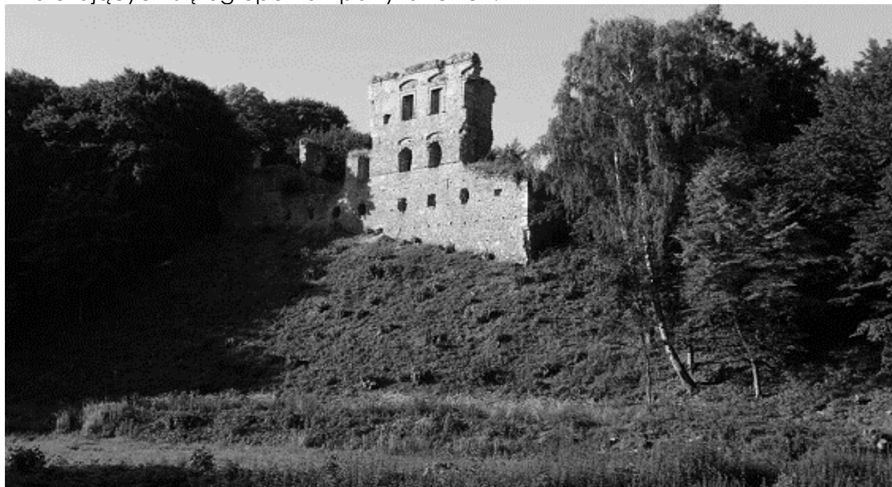
Ruiny zamku w Międzygórze

zamordowany na progu słabuszewickiego dworu w wyniku porachunków dwóch zwalczających się ugrupowań partyzanckich.