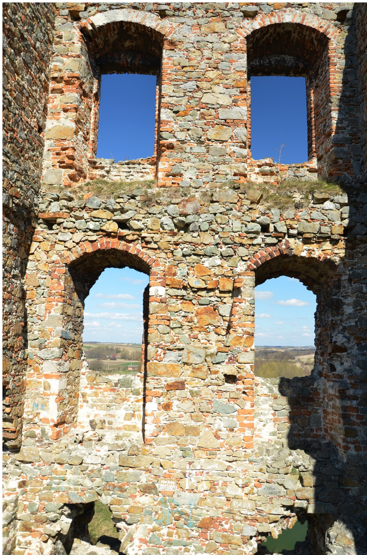
Ruiny zamku w Międzygórzu, gmina Lipnik, archiwum Urzędu Gminy w Lipniku