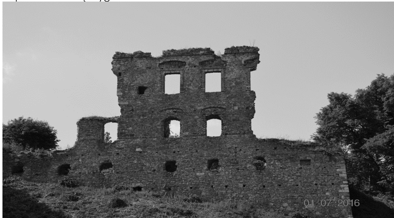
Ruiny zamku w Międzygórzu