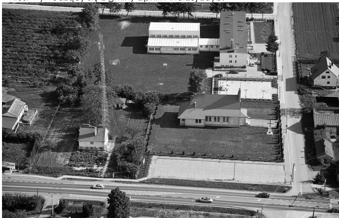
Kaplica i Zespół Szkolno- Przedszkolny w Lipniku z lotu ptaka