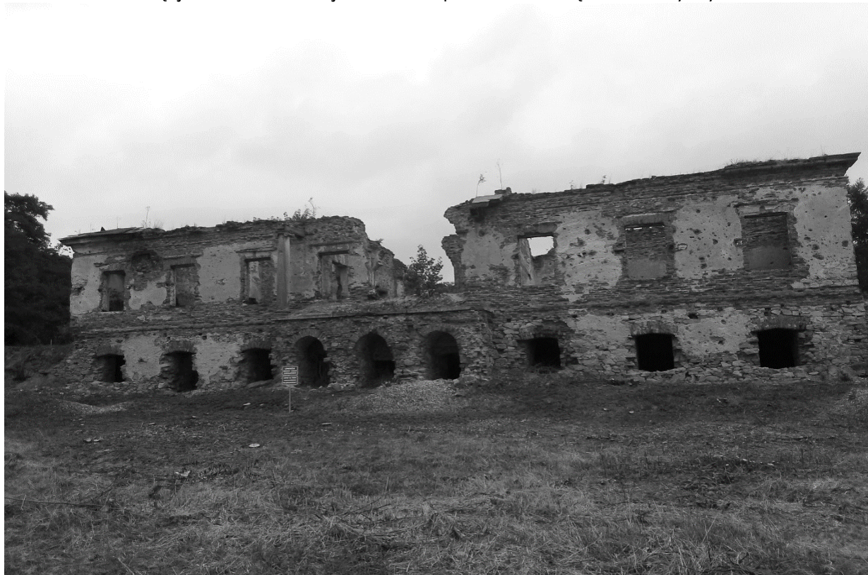
Oficyna Pałacowa we Włostowie widok obecny

tym regionie. W 1945 r. parter pałacowy zamieniony został na szkołę podstawową. Teoretycznie więc zamieszkały i użytkowany pałac powinien przetrwać w dobrym stanie. Stało się jednak inaczej. Ludzie wprowadzili się wraz z żywym inwentarzem.