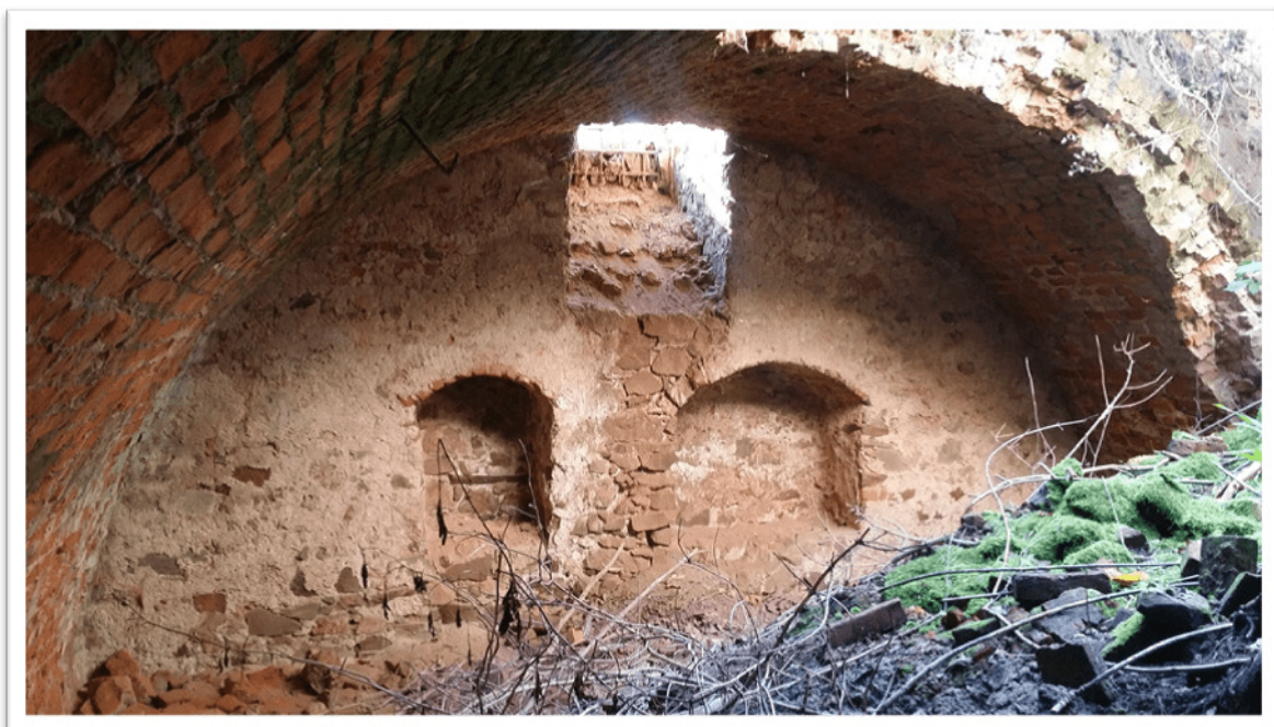
Ruiny Zboru Ariańskiego we Włostowie