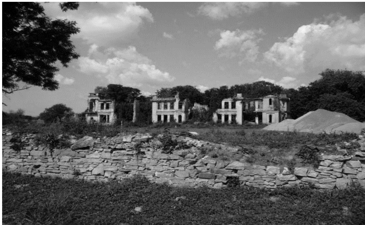
Pałac we Włostowie widok obecny