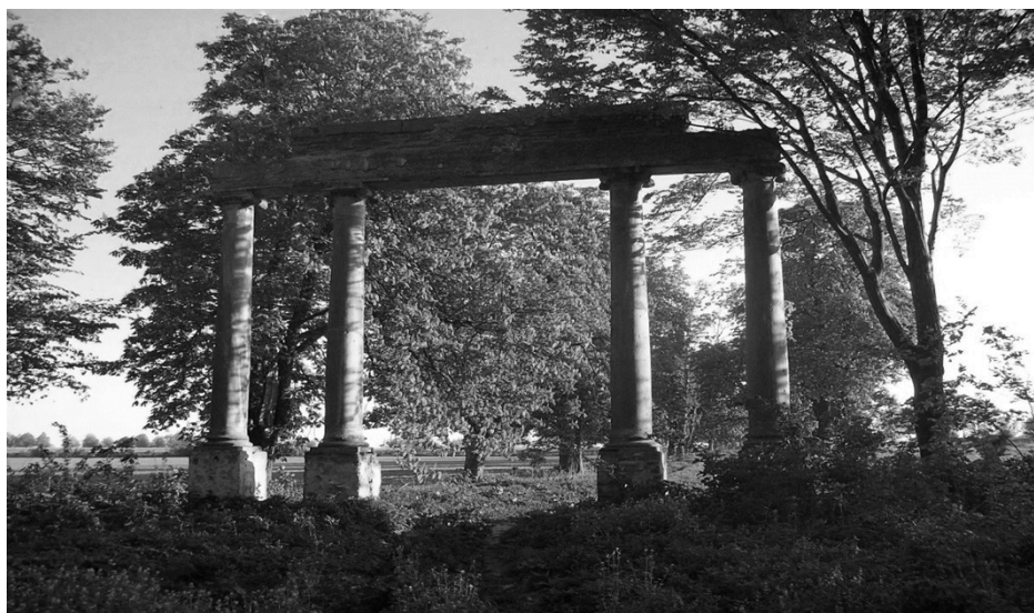
Brama wjazdowa do parku

Obecne założenie parkowe (ok. 10 ha), utrzymane w duchu romantycznym o kierunku krajobrazowym, pochodzi z połowy XIX w., a więc z okresu budowy nowej siedziby włostowskich panów. Zapewne park w tym miejscu istniał wcześniej, czyli już w XVIII w.