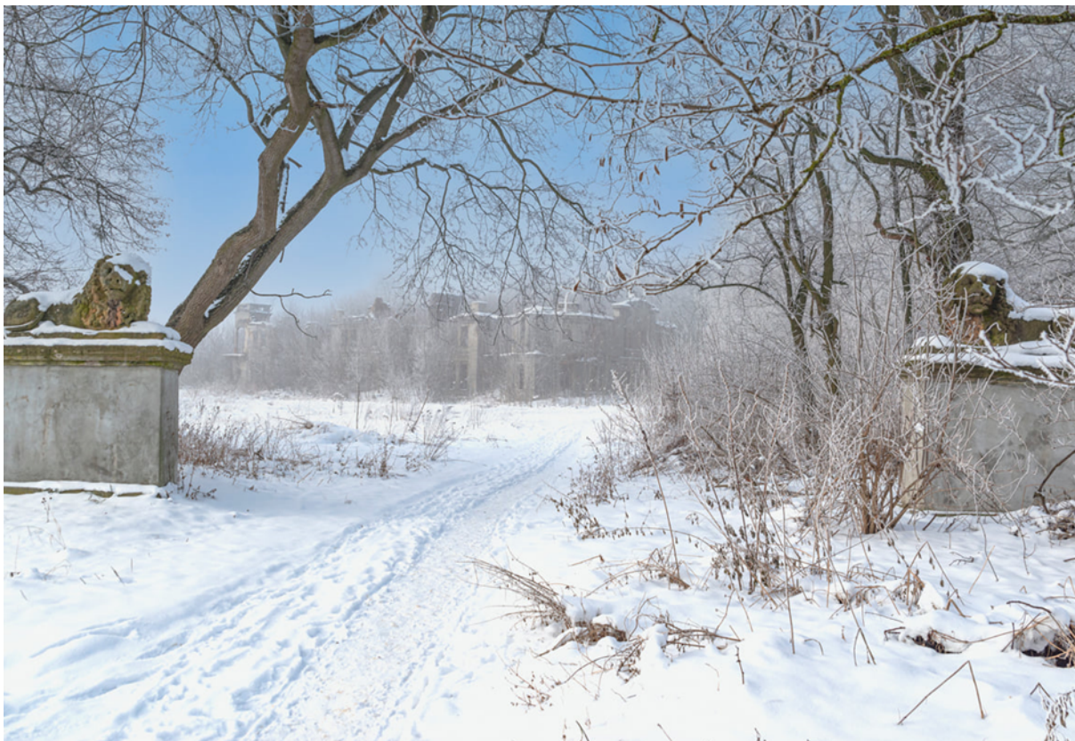
Ruiny Pałacu Karskich we Włostowie w zimowej odświeżeniu