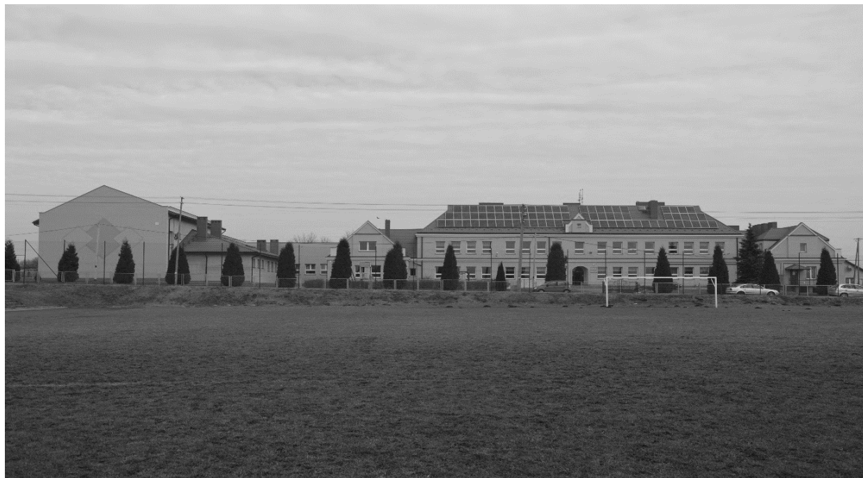
Widok na Szkołę Podstawową we Włostowie od strony boiska sportowego