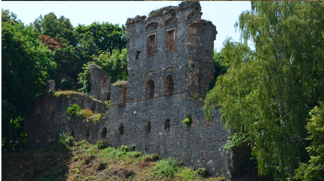
Ruiny zamku w Międzygórzu, gmina Lipnik, archiwum Urzędu Gminy w Lipniku