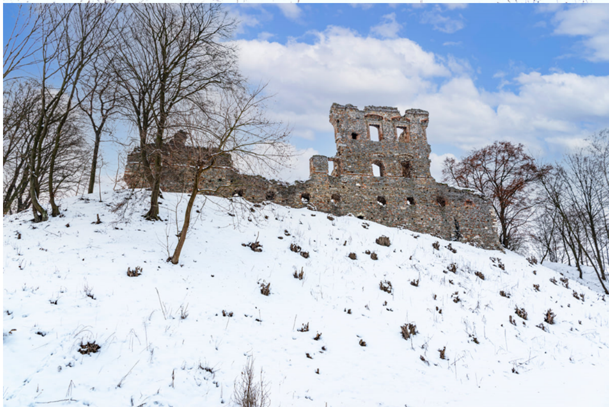
Ruiny zamku w Międzygórze w zimowej odśnie