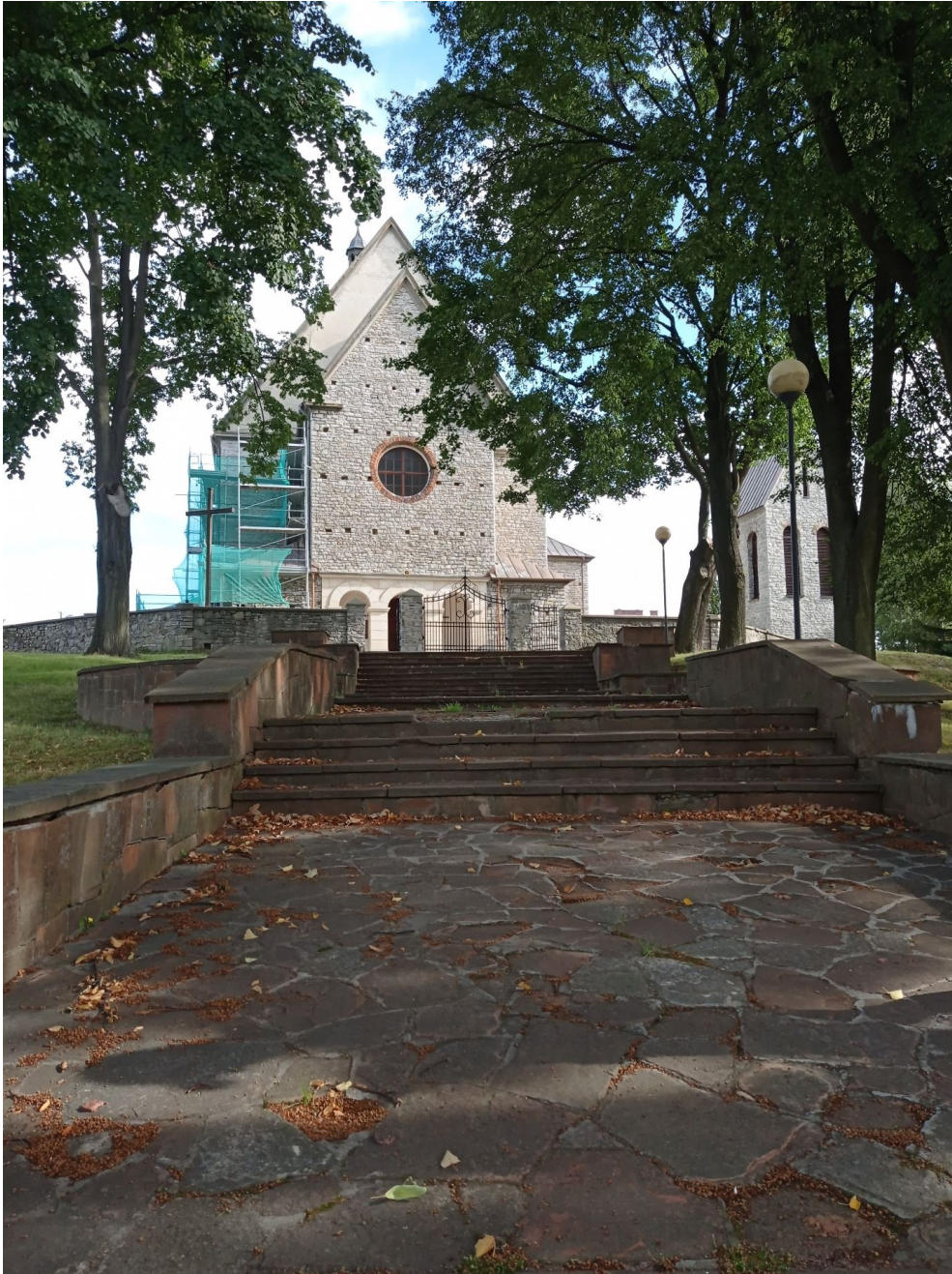
Fot. Fot.Łukasz Wodecki