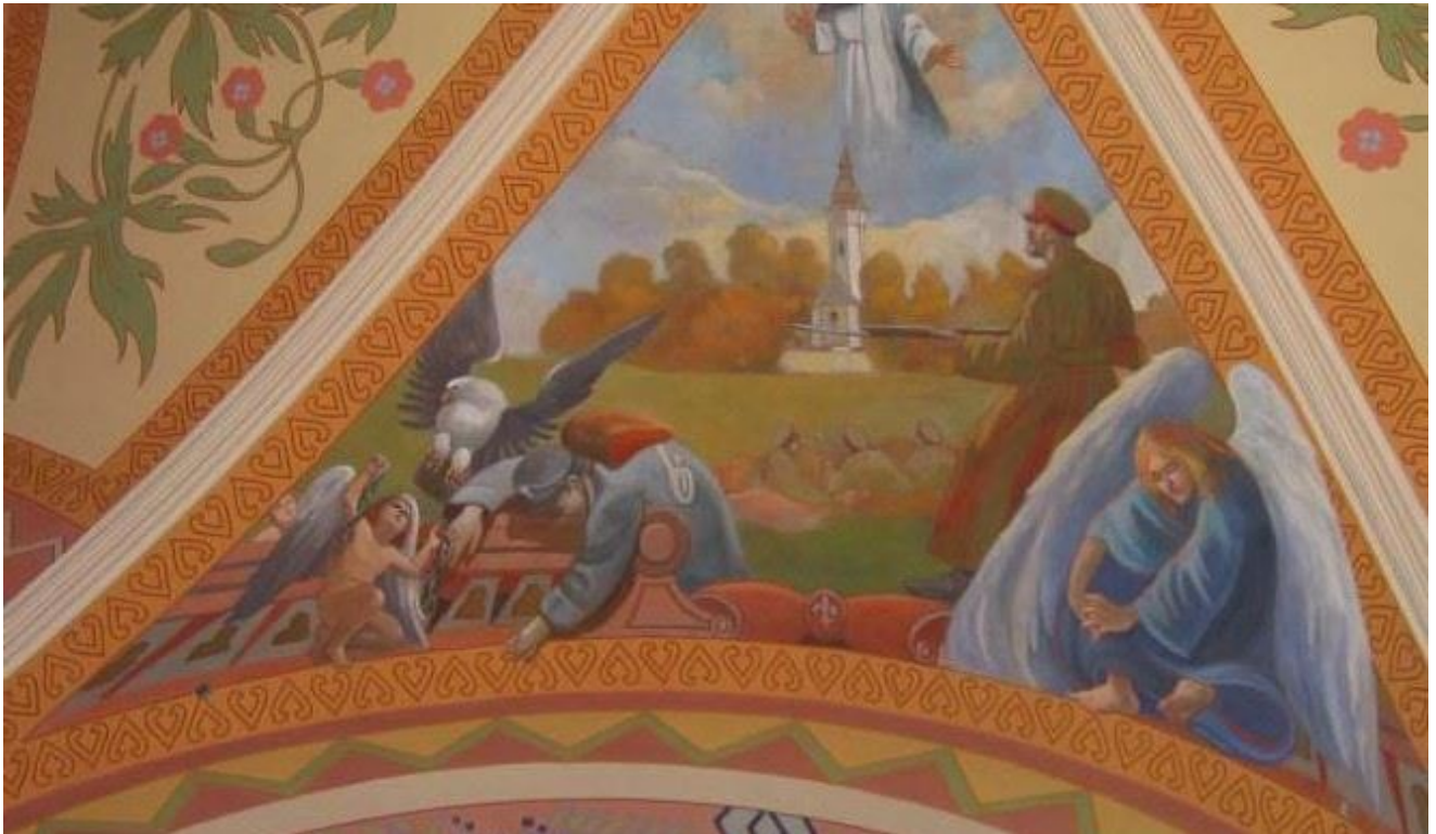
Wnętrze kościoła parafialnego p. w. św. Jacka

Wśród zabytków ruchomych na terenie gminy znajdują się obiekty stanowiące wyposażenie kościoła: Zespół Kościoła Parafialnego p. w. św. Jacka w Leszczynach.