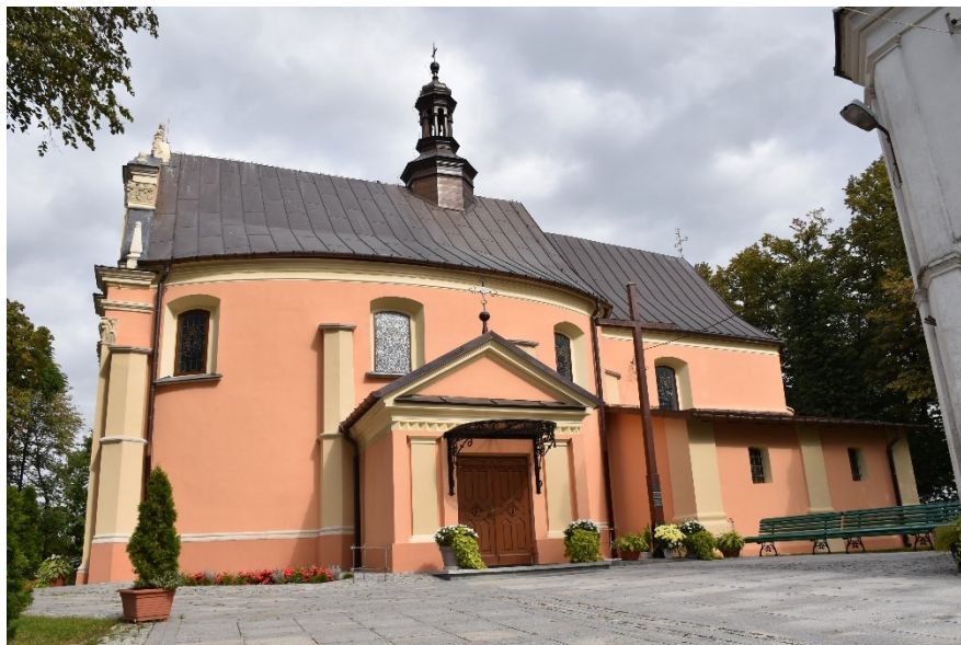
Rys. 3. Kościół Parafialny w Samborcu

Kościół Parafialny w Samborcu został prawdopodobnie wybudowany w połowie XIII w. przez Pawła z Samborca. W czasie wojen szwedzkich kościół został zniszczony. Od 1688 r. rozpoczęto