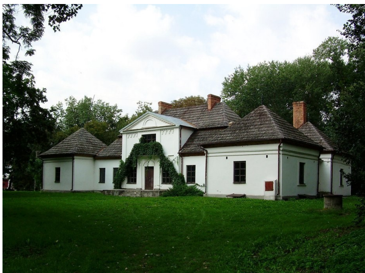
Rys. 7. Dworek w Skotnikach

Posiadłość co najmniej od pierwszej połowy XIV w. do 1945 r. w rękach Bogoriów Skotnickich. Dwór wraz z otaczającym go parkiem krajobrazowym z resztkami starodrzewiu położony wśród łąg doliny Wisły, na obszernym, niewysokim wzniesieniu, otoczonym pozostałościami fosi i wału, z resztkami parku. Zniszczony w 1945 r., odnowiony 1948-49. Zwrócony frontem na południowy-wschód, parterowy, podpiwniczony. Korpus budynku z końca XVIII w., drewniany, otynkowany, na rzucie prostokąta. Przy jego bokach krótszych cztery murowane, kwadratowe alkierze z 2 poł. XVII w. lub początek XVIII w. o grubych murach, wysunięte wydatnie przed lico elewacji frontowej i ogrodowej. Z boków, w przestrzenie między alkierzami wbudowano późniejsze sionki. Od frontu pośrodku płytki ryzalit z nadbudowanym ok. poł. XIX w. drewnianym piętrem, ryzalit od tyłu wzniesiony w 1945-49. Wnętrze dwutraktowe, w alkierzach po jednej izbie. Dwa kominki w obramieniach z końca XVIII w. Pod korpusem korytarzowe starsze piwnice murowane z kamienia, sklepienie kolebkowo. Tylne naroża alkierzy i naroża przy wejściu południowo-zachodnim wsparte wydatnymi, skośnymi szkarpami. Ściany alkierzy zwieńczone gzymsami. Na korpusie dach łamany polski, gontowy, pary alkierzy kryte wspólnymi dachami czterospadowymi. W wieźbie użyte belki stropowe z polichromią w kwiaty z XVIII w. Dwór alkierzowy z XVII wieku murowany, przebudowywany pod koniec XVIII wieku.