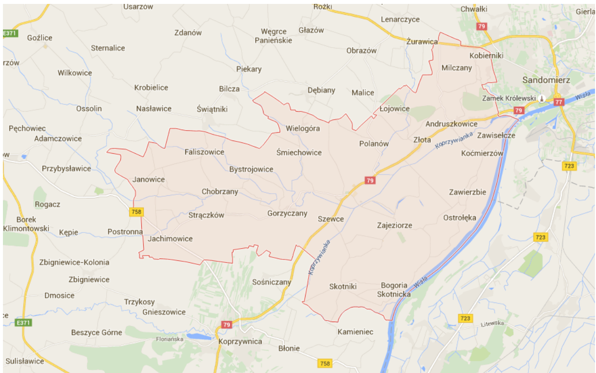
Rys. 2. Gmina Samborzec