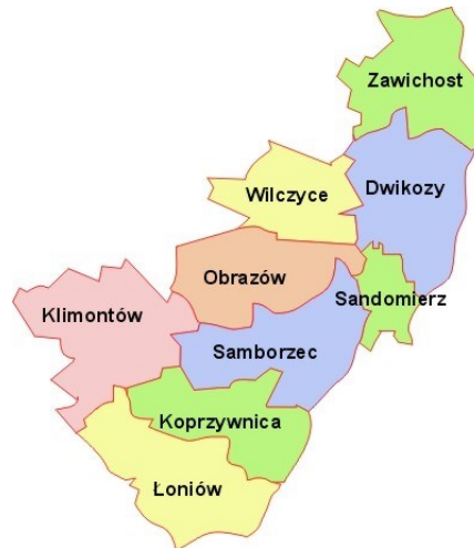
Rys. 1. Położenie Gminy Samborzec.

Gmina Samborzec jest jedną z dziewięciu gmin dzisiejszego powiatu sandomierskiego i położona jest w jego południowo-wschodniej części nad lewym brzegiem Wisły. Gmina Samborzec pod względem fizjologicznym leży w obrębie dwóch odmiennych geologicznie i geomorfologicznie jednostek. Część północno-zachodnia należy do Wyżyny Sandomierskiej, a część południowo-wschodnia leży w Kotlinie Sandomierskiej. Duża część gminy leży na Nizinie Skotnickiej. Jej powierzchnia wynosi 30 km 2 , a zaczyna się od dawnego ujścia Koprzywianki i dochodzi do Krakówki - Sandomierskiego przedmieścia. Obejmuje ona wsie: Zawisełcze, Bogoria Skotnicka, Ostrołęka, Koćmierzów, Skotniki i Zajeziórze - leżą one w dolinie Wisły. Występują tu gleby utworzone z aluwiów rzecznych, o dobrych fizyczno-chemicznych parametrach, nadające się pod uprawę prawie wszystkich roślin, łatwe do uprawy mechanicznej.