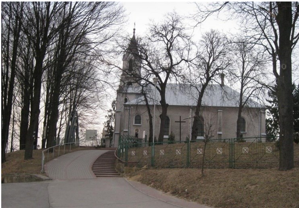
Rys. 5. Kościół Parafialny w Chobrzeżanach