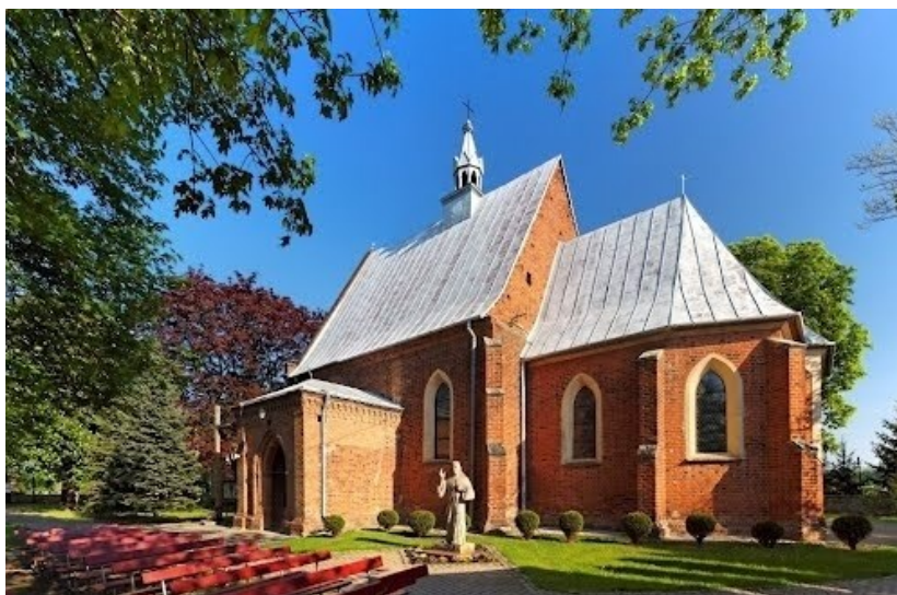
Rys. 4. Kościół Parafialny w Skotnikach

W Skotnikach znajduje się kościół pod wezwaniem Św. Jana Chrzciciela. Sama parafia w Skotnikach wzmiankowana była w dokumentach pochodzących z 1323 r. jako własność Bogoriów Skotnickich (od 1944 r.). Pierwszy murowany kościół ufundował w 1347 r. Jarosław Bogoria - bp gnieźnieński. Konsekracja kościoła odbywa się w 1370 r. Pierwszy gruntowny remont przeprowadzono w 2 połowie XVIII w., wtedy też dobudowano kruchtę, przedsionek i 2 kondygnację nad zakrystią. Drewnianą zakrystię zastąpiono murowaną, ustawiono figurę św. Jana Chrzciciela. W XIX w. przekształcony został zachodni szczyt kościoła, na kalenicy dachu wzniesiono sygnaturkę, a cały zespół kościelny został otoczony kamiennym murem. Już w XX w. wybudowano plebanię. Obecnie w skład zespołu kościoła parafialnego p.w. św. Jana Chrzciciela w Skotnikach wchodzi: kościół, dzwonnica, figura św. Jana Chrzciciela i ogrodzenie.