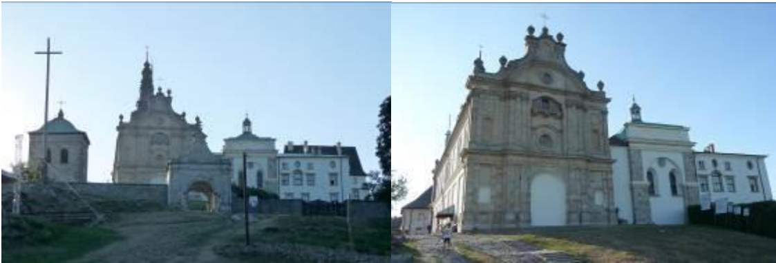
Zdjęcia nr 3, 4. Zespół klasztorny, Święty Krzyż

Zespół klasztorny benedyktynów obejmujący kościół pw. Trójcy Św., klasztor, dzwonnice, ogrodzenie z bramą i bramę wsch. oraz dawny szpital, położony jest nieco poniżej szczytu Łysej Góry, w kierunku płn.-wsch. Usytuowany w otwartej przestrzeni, dominuje nad okolicą, dookoła – puszcza jodłowa. Wzgórze opada stromym zboczem wsch. do Nowej Słupi, po którym wiedzie Droga Królewska, w górnej części wyłożona kamieniem. Ruch kołowy prowadzi od zach. Teren zespołu wrzecionowaty, wydłużony na linii wsch.-zach., częściowo naturalny, częściowo splantowany, otoczony jest murami oporowymi i ogrodzeniem z bramami. Zespół składa się z orientowanego kościoła – stanowiącego pld. zamknięcie prostokątnego wirydarza klasztornego i klasztoru – razem tworzących zamknięty czworobok zabudowań z krążgankami obiegającymi wirydarz; od zach. dwa skrzydła na rzucie litery L, które otaczają dziedziniec otwarty na pld. Na osi płn. skrzydła klasztoru – tzw. wielki ryzalit; między nim a bramą główną – obszerny plac gospodarczy otoczony wysokim, kamiennym murem. W płn.-zach. części założenia – budynek dawnego szpitala, przed nim rozległy, owalny plac – dawny dziedziniec więzienny. Obszar założenia określają mury oporowe, ogrodzenia i bramy. Brama główna – w części wsch. Między bramą a kościołem – dzwonnica. Elementem współczesnym jest tu wieża przekaźnika radiowo-telewizyjnego o wysokości 157 m, wzniesiona w 1966 r., zlokalizowana w odległości ok. 100 m od zespołu.