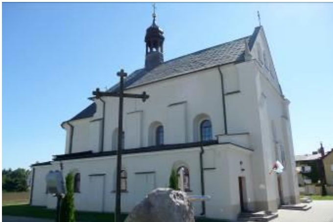
Zdjęcie nr 1. Kościół parafialny pw. św. Wawrzyńca w Nowej Słupi