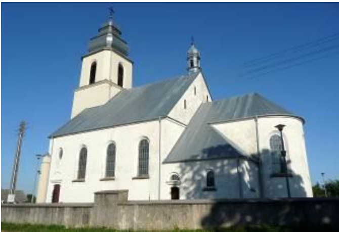
Zdjęcie nr 2. Kościół pw. Św. Mikołaja Biskupa, Dębno

Kościół wzniesiony został w 1936 r. na miejscu lokalizacji starszego kościoła. Na rzucie prostokąta z węższym, zamkniętym półkoliście prezbiterium ujętym parą prostokątnych aneksów i z pięciokondygnacyjną wieżą w fasadzie, częściowo wpuszczoną w mury korpusu. W narożach fasady – niskie cylindryczne wieżyczki, w szczycie dachu nawy - sygnaturka. Ściany murowane, tynkowane, dach kryty blachą.