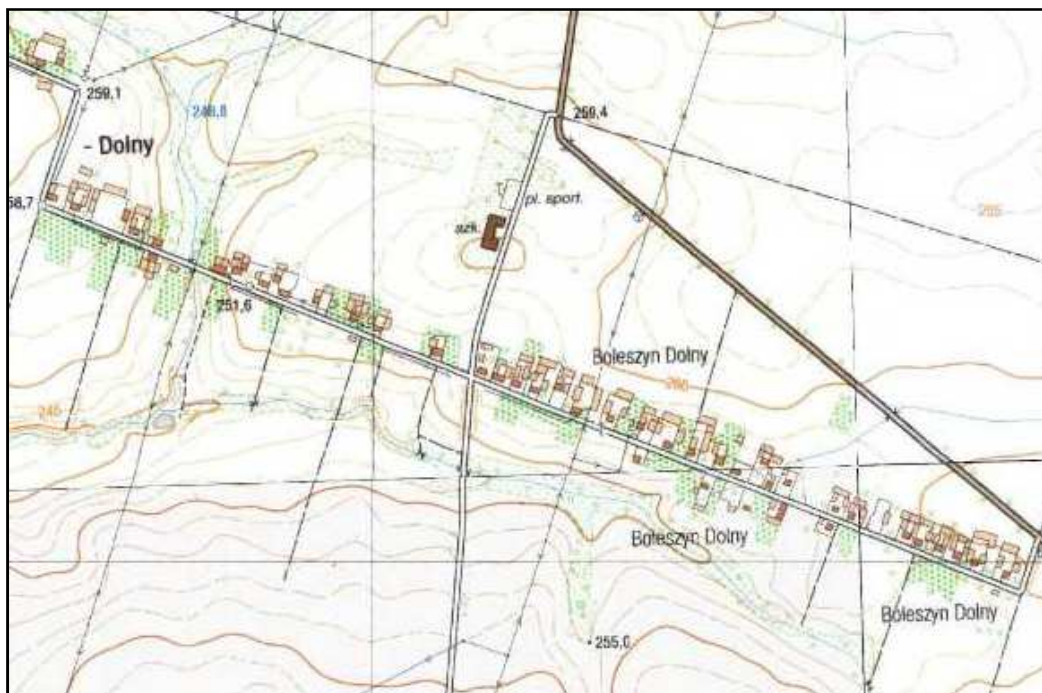
Rysunek 3. Boleszyn Dolny - charakterystyczny przykład tradycyjnej ulicowej zabudowy wiejskiej na terenie Gminy Waśniów.

Nie mniej ważnym elementem krajobrazu kulturowego Gminy Waśniów są zachowane ziemiańskie siedliska dworów wraz z folwarkami i parkami przydworskimi takie jak: Boksyce, Garbacz, Czajęcice, Grzegorzowice, Kunin, Nagorzyce, Mirogonowice, Sarnia Zwola, Wronów. Te zabytkowe zespoły zostały ukształtowane w pełnej koegzystencji z układami ruralistycznymi stanowiąc ich integralną część. Choć w wyniku przemian ustrojowych w poł. XX w. grunty rolnicze dworów uległy parcelacji, ocalały parki podworskie o charakterze krajobrazowym ukształtowane w XVIII – XIX w. Ich układy przestrzenne w większości wpisują się podziały katastralne wiosek zachowując formę zbliżoną do regularnych prostokątów jak np. parki w Boksycach, Garbacz, Grzegorzowicach, Kuninie, Mirogonowicach i Wronowie. (vide: karty adresowe zabytków Gminy Waśniów) Pozostałe: w Czajęcicach, Nagorzycach, i Sarniej Zwoli, swój nieregularny układ zawdzięczają zróżnicowanemu ukształtowaniu terenu w połączonym z naturalnymi ciekami wodnymi wykorzystanymi do uformowania sztucznych oczek wodnych, sadzawek wzbogacających walory krajobrazowe (n.p. Sarnia Zwola) W parkach podworskich zachowało się kilka budynków dworskich