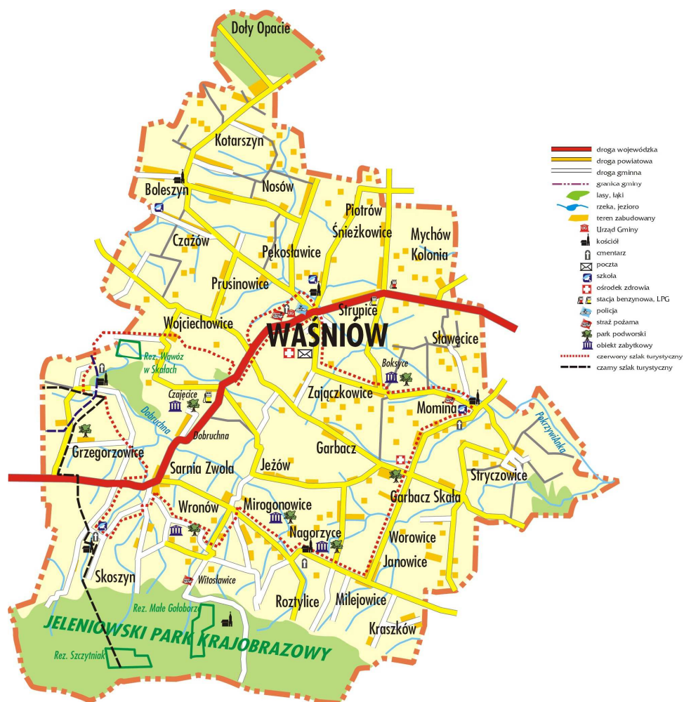
Rysunek 1. Granice administracyjne Gminy Waśniów.