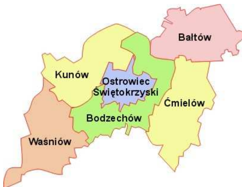
Rysunek 2. Położenie gminy Waśniów na tle powiatu ostrowieckiego.