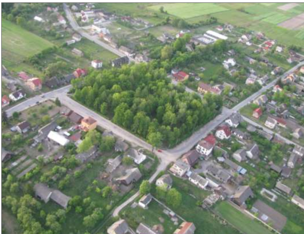
Widok z lotu ptaka. Autor: Paweł Wicher

Założone przez Mikołaja Reja miasto Oksza od zwykłej wsi różniło się tym, że miało prawa miejskie oraz wielki czworoboczny rynek i wieloboczny układ osady.