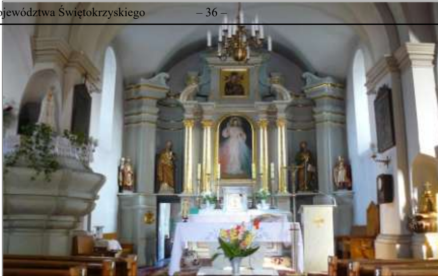
Wystrój kościoła - ołtarz główny