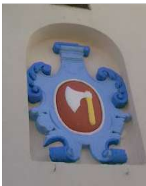
Kamienny kartusz herbowy