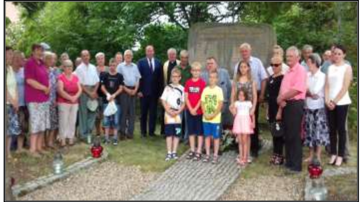
Uroczystości upamiętniające pomordowanych w dniu 4 sierpnia 1944 r. mieszkańców Lipna

W dniu 17 września 2012 r. w Oksie poświęcono i odsłonięto obelisk oraz posadzono 7 „Dębów Pamięci”, upamiętniających żołnierzy Wojska Polskiego i Funkcjonariuszy Policji Państwowej - ofiar Zbrodni Katyńskiej związanych z gminą Oksa.