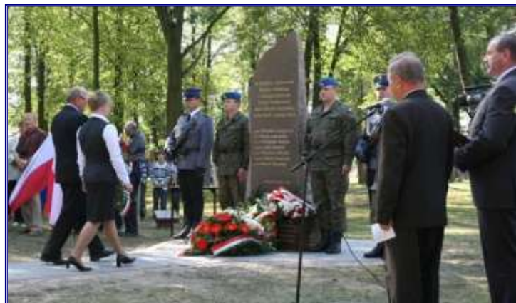
Uroczyste poświęcenie i odsłonięcie obelisku oraz posadzenie 7 „Dębów Pamięci”