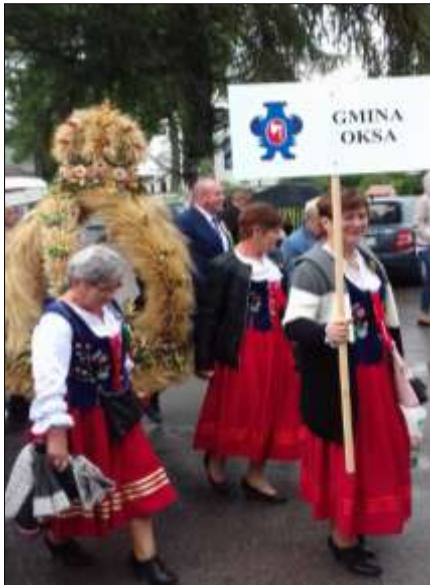
Korowód dożynkowy- Sobków, 2018 r.