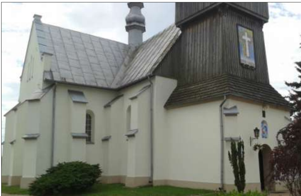
Elewacja od strony półn. - zach.