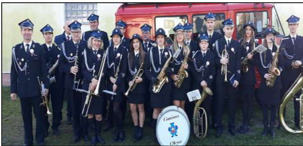
Orkiestra dęta z Zakrzowa

Od kilku lat na terenie gminy działa orkiestra dęta, która swymi występami uświetnia uroczystości patriotyczno – kościelne.