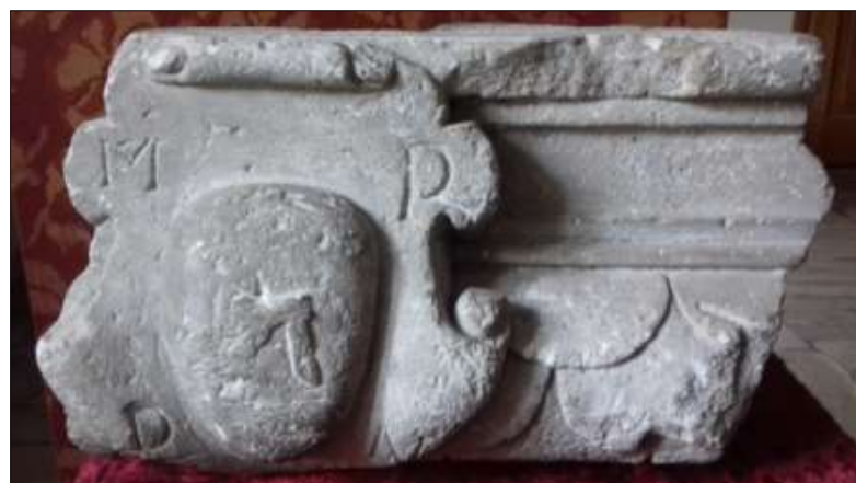
Kartusz herbowy wykopany przy ul. Jędrzejowskiej w Oksie