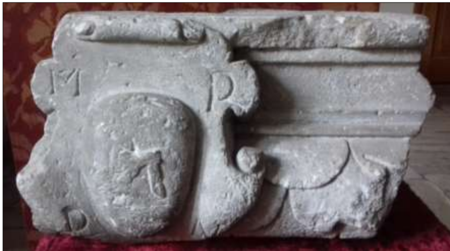
Kartusz herbowy poety