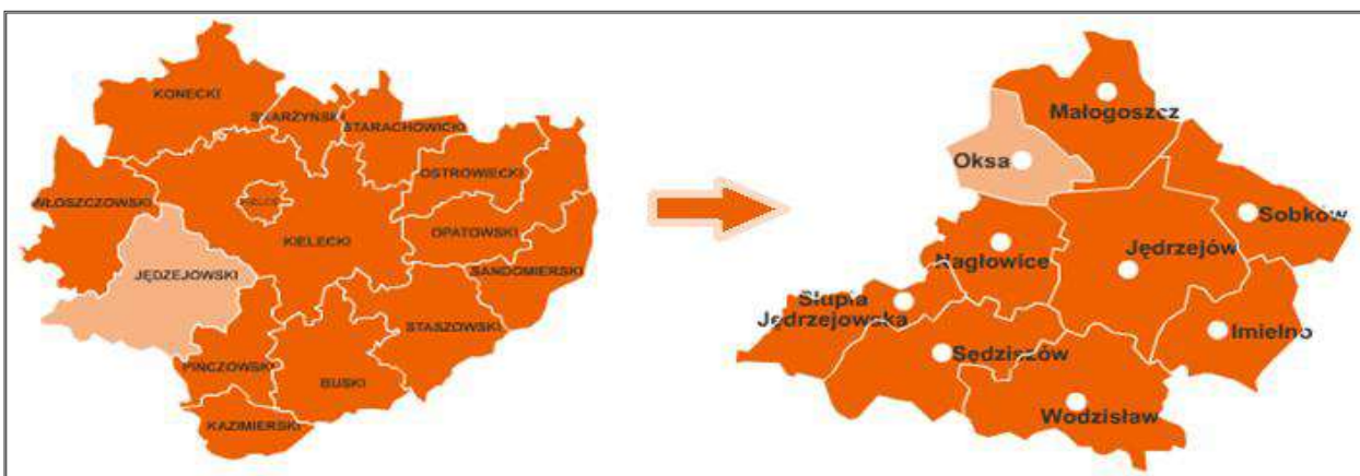
Położenie gminy na tle województwa i powiatu.

Gmina Oksa położona jest w zachodniej części województwa świętokrzyskiego w pn.- zach. części powiatu jędrzejowskiego. Powierzchnia Gminy wynosi 91 km 2 , co stanowi 0,8% powierzchni województwa oraz 7,2% powierzchni powiatu.