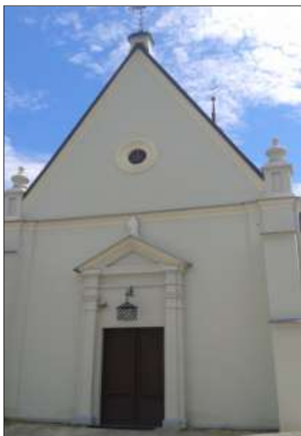
Wejście główne do kościoła

W jego centralnej części znajduje się obraz Matki Boskiej z Dzieciątkiem, pochodzący z ok. 1700 r. Matka Boża Szkaplerzna z Węgleszyna jest otoczona wielką czcią. Dotąd zachowała się tradycja tłumnych odpustów 16 lipca.