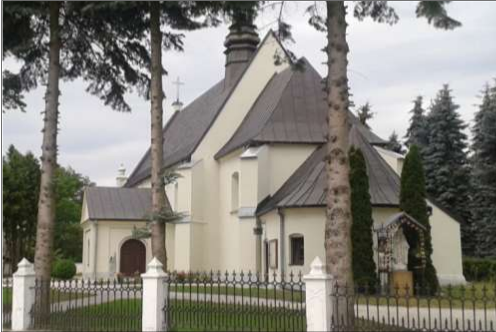
Widok ogólny od strony drogi powiatowe

„Słownik Geograficzny Królestwa Polskiego” z 1884 r., t. V podaje m.in.: Osiedlił się tu w XIV w. ród szlachecki hrabiego Jelita z Morska w Wieluńskim (...). Florian z Morska, biskup krakowski (1366-1380) wystawił w miejscu istniejącego już tu kościoła drewnianego nowy, murowany pw. św. Andrzeja. Data powstania węgleszyńskiej parafii nie jest znana.