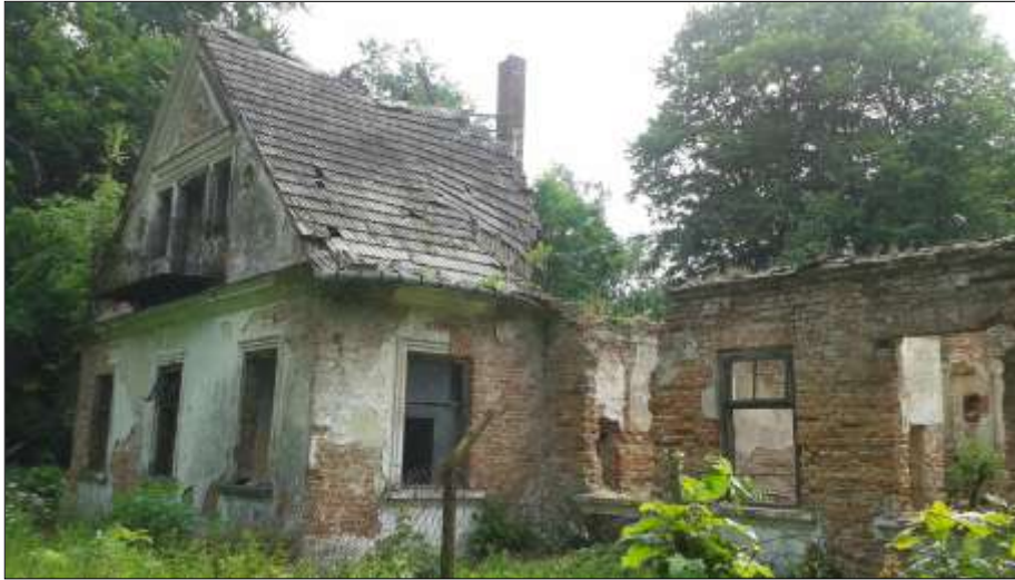
Fragment skrzydła od strony dawnego folwarku