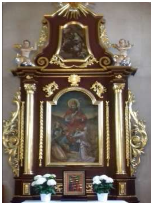
Ółtarz od strony północnej

Kościół ma sklepienie beczkowe. U wejścia znajduje się przedsionek, a nad nim wznosi się drewniana dzwonnica. Chór oparty jest na dwóch słupach drewnianych, posiada organy o dziewięciu głosach. Nad wejściem głównym do kościoła widoczny jest kamienny kartusz z herbem Rejów – Okszą.