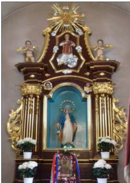
Ółtarz od strony południowej