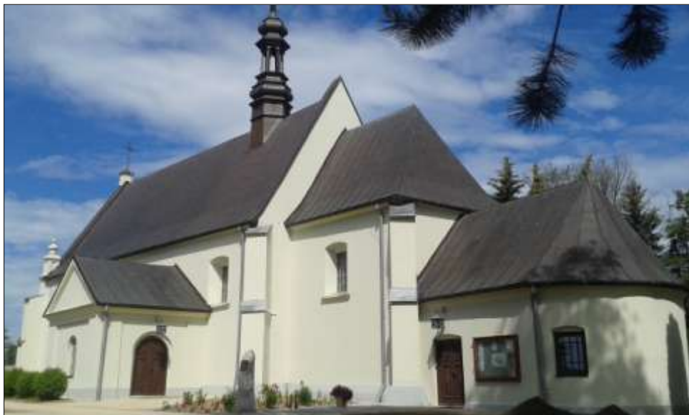
Widok obecny od strony pfd. - wsch.

Wyróżnić należy również zabytki stanowiące uzupełnienie zespołu kościoła parafialnego, jako obiekty decydujące o kontekście przestrzennym i architektonicznym cennego zabytku wpisanego do rejestru zabytków: