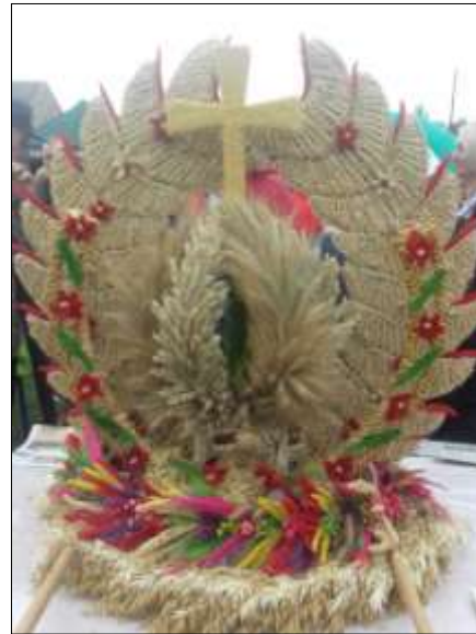
Wieniec KGW z Dębiny