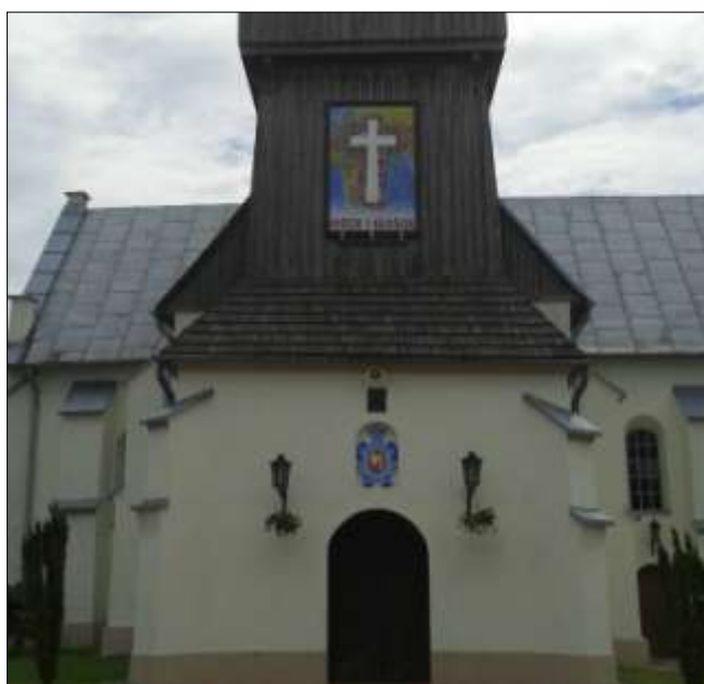
Wejście główne do kościoła

Kościół ma sklepienie beczkowe. U wejścia znajduje się przedsionek, a nad nim wznosi się drewniana dzwonnica. Chór oparty jest na dwóch słupach drewnianych, posiada organy o dziewięciu głosach. Nad wejściem głównym do kościoła widoczny jest kamienny kartusz z herbem Rejów – Okszą.