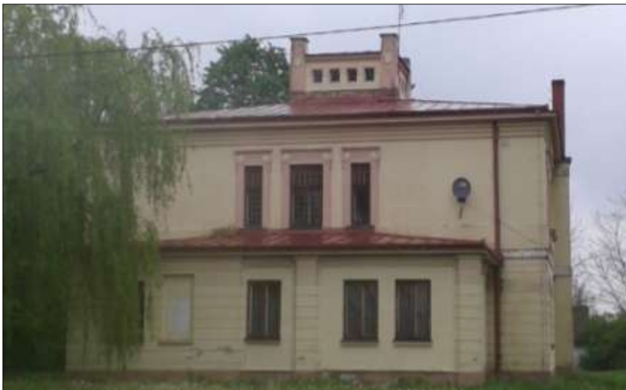
Elewacja pld. - zach.

Po 1945 r. mieściła się w nim szkoła, mieszkania lokatorskie, później przedszkole. Od września 2014 r. budynek nie jest użytkowany i niszczeje.