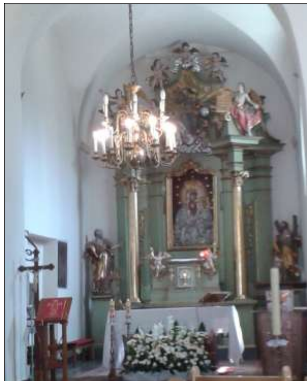
Wystrój kościoła – ołtarz główny

Ze względów bezpieczeństwa nie publikuje się szczegółowych danych dotyczących zabytków ruchomych. Ich stan zachowania jest z reguły bardzo dobry - poddawane są bieżącym konserwacjom.