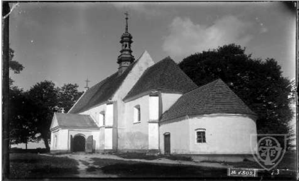
Lata 1905-1910

W 1367 r. bp krakowski Florian z Mokrska wzniósł w Węgleszynie murowany, gotycki kościół pw. św. Andrzeja Apostoła na miejscu starego, drewnianego. Kościół przetrwał do naszych czasów w nieco zmienionym kształcie.