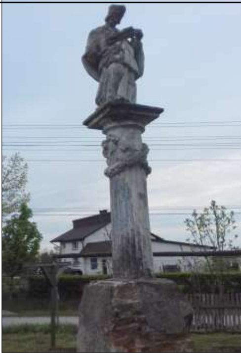
Figura św. Nepomucena w Węgleszynie