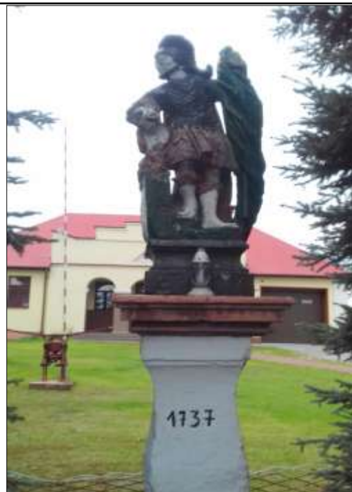
Figura św. Floriana w Oksie