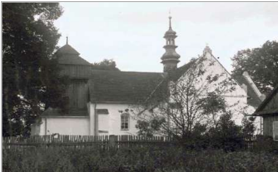
Dawny zbór kalwiński Rejów.

się synody protestanckie. W 1678 został przejęty przez cystersów jędrzejewskich i został filią parafii Konieczno.