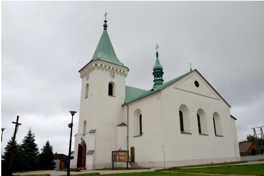
Fot. 1. Kościół p.w. św. Piotra i Pawła w Radoszycach, widok od strony zach. i płd..