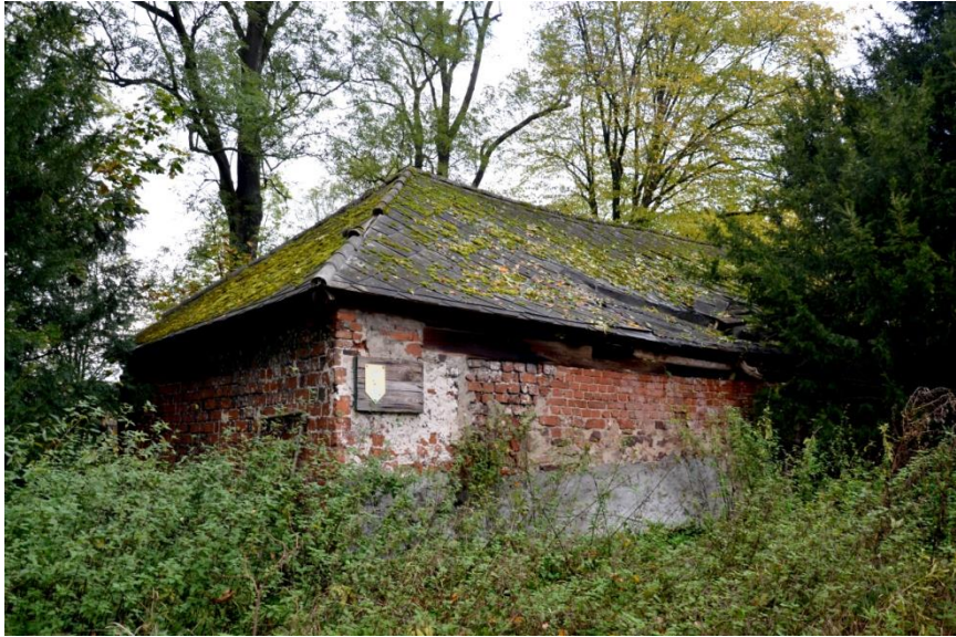
Fot. 2. Radoszyce, budynek "winiarni".

Dom gotycki miał plan wydłużonego prostokąta, zach. część budynku była podpiwniczona, izbę przyziemia przykrywał prawdopodobnie belkowy strop. Budynek został zinterpretowany jako piętrową, ceglana kamienicę - gotycki pałac z 6 izbami na obu kondygnacjach oraz dwie sale o znacznych rozmiarach (8,5x10,5 m.).