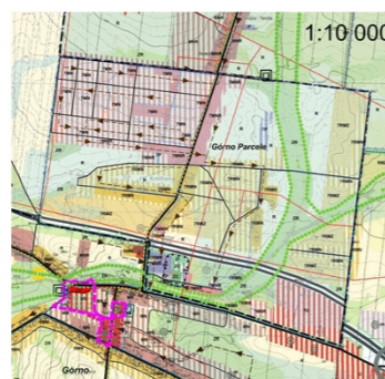
WYRYS ZE STUDIUM UWARUNKOWAN I KIERUNKÓW ZAGOSPODAROWANIA PRZESTRZENNEGO GMINY GÓRNO

Projekt planu sporządzono na kopciach mapy przyjętej do zasobów Powiatowego Ośrodka Dokumentacji Geodezyjnej i Kartograficznej Starostwa Powiatowego w Kielcach (nr licencji GN-III.6642.4251.2015_2604_P)