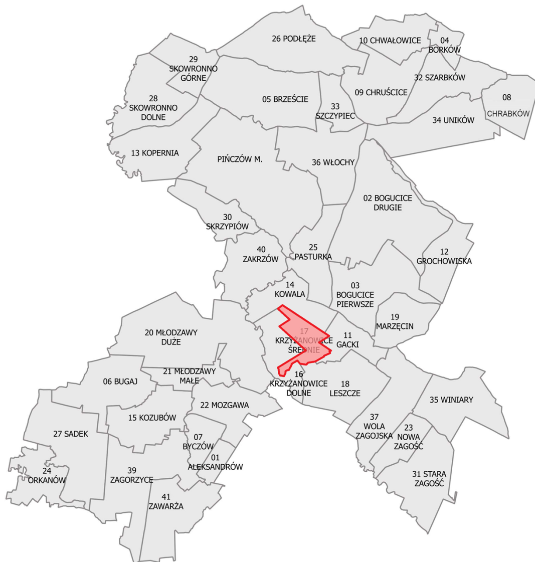
Mapa obszaru Sołectwa Krzyżanowice Średnie