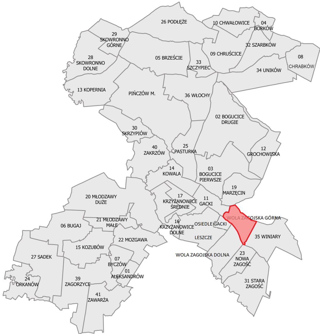
Mapa obszaru Sołectwa Wola Zagojska Górna