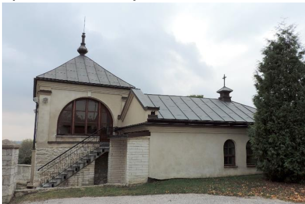
Zdjęcie nr 16. Plebania, ob. kaplica przedpogrzebowa w zespole kościoła parafialnego pw. św. Jakuba Apostoła, Szczaworyż

Datowanie: 1630 r., 1904 r. - nadbudowa piętra.