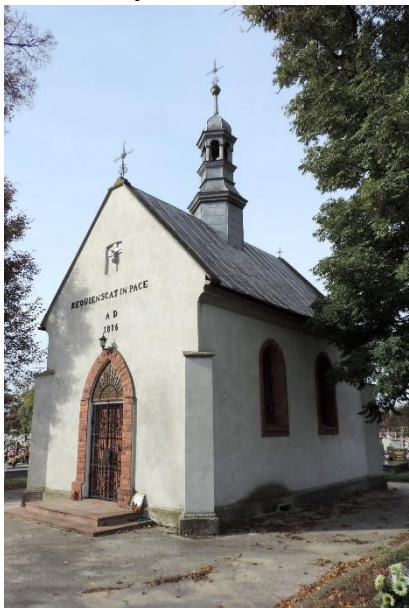
Zdjęcie nr 13. Kaplica cmentarna na cmentarzu parafialnym, Szaniec