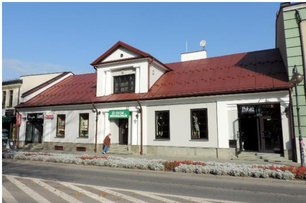
Zdjęcie nr 37. Dom, pl. Zwycięstwa 27 w Busku - Zdroju