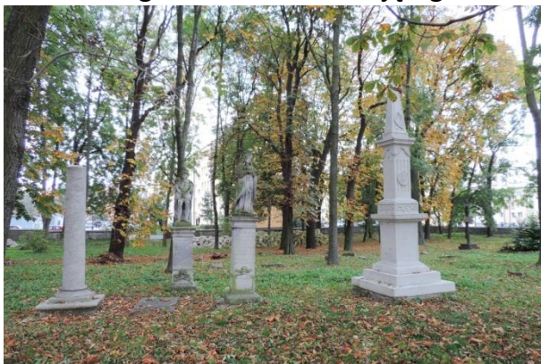
Zdjęcie nr 5. Teren starego cmentarza otaczającego kościół św. Leonarda w zespole w Busku - Zdroju