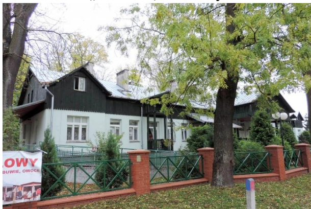
Zdjęcie nr 31. Willa „Zielona”, ul. 1 Maja 39 w Busku - Zdroju

Datowanie: XIX/ XX w., rekonstrukcja - 1994 r.