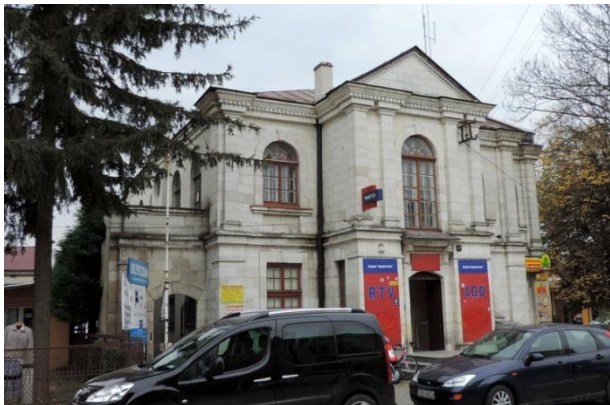
Zdjęcie nr 19. Synagoga, ob. dom towarowy, ul. Partyzantów 6 w Busku - Zdroju