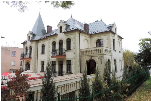
Zdjęcie nr 33. Willa „Derśław”, al. Mickiewicza 18 w Busku - Zdroju