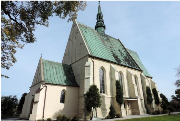
Zdjęcie nr 11. Kościół parafialny pw. Wniebowzięcia NMP, Szaniec

Datowanie: k. XV w., XVI w., XIX w., 1914 r.