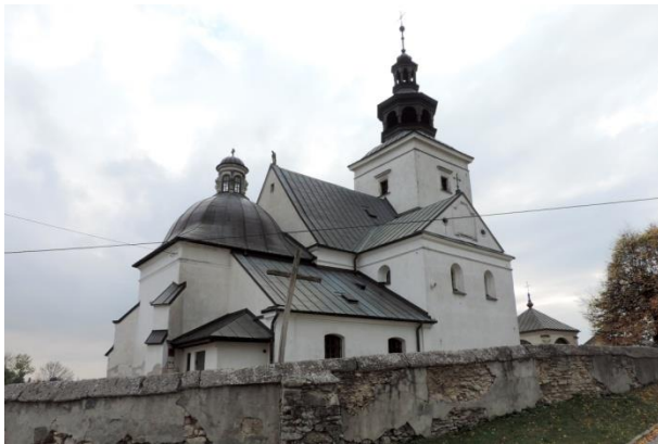
Zdjęcie nr 15. Kościół parafialny pw. św. Jakuba St. Apostoła, Szczaworyż

Datowanie: 1613 r., 1630 r., 1726 r., 1783 r., k. XIX w.