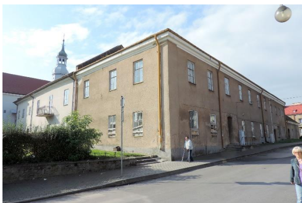
Zdjęcie nr 2. Klasztor w zespole klasztornym norbertanek, ul. Bohaterów Warszawy 8/ Sądowa 1 w Busku - Zdroju