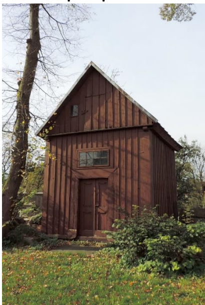
Zdjęcie nr 14. Kaplica pw. św. Antoniego w zespole kościelnym, Szaniec