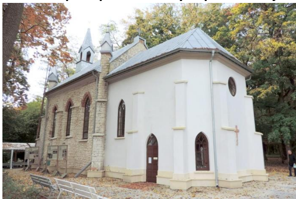
Zdjęcie nr 1. Kaplica pw. św. Anny w parku zdrojowym, Busko - Zdrój