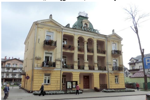
Zdjęcie nr 30. Willa „Oblęgorek”, ul. 1 Maja 19 w Busku - Zdroju