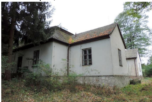
Zdjęcie nr 20. Dwór w zespole, Radzanów