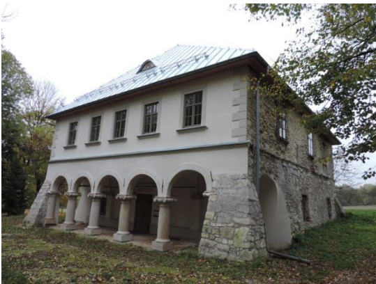
Zdjęcie nr 22. Dwór, Widuchowa