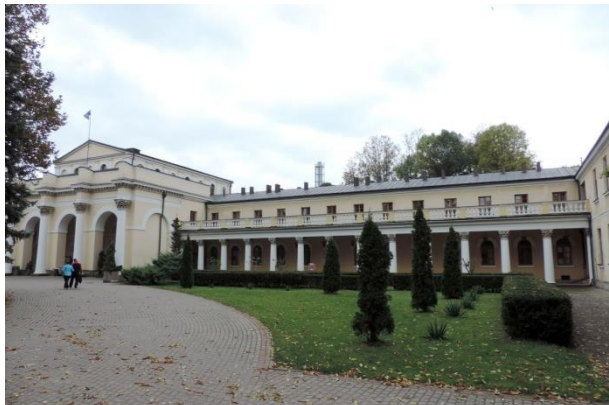
Zdjęcie nr 23. Łazienki (sanatorium „Marconi”) w zespole uzdrowiskowym w Busku - Zdroju