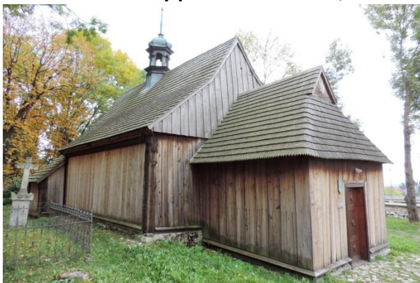
Zdjęcie nr 4. Kościół cmentarny pw. św. Leonarda, ul. Bohaterów Warszawy w Busku - Zdroju