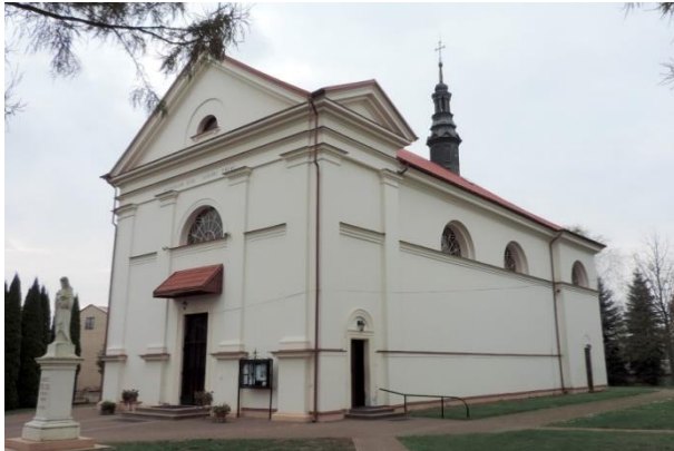
Zdjęcie nr 9. Kościół parafialny pw. św. Wojciecha w zespole, Janina