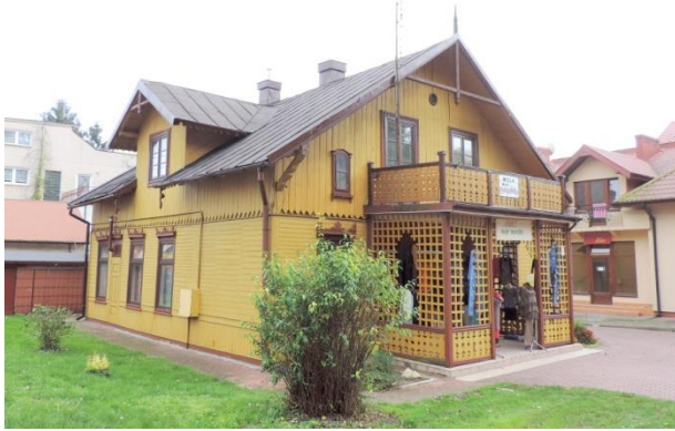
Zdjęcie nr 32. Willa „Bagatela Mała”, ul. 1 Maja 15 w Busku - Zdroju