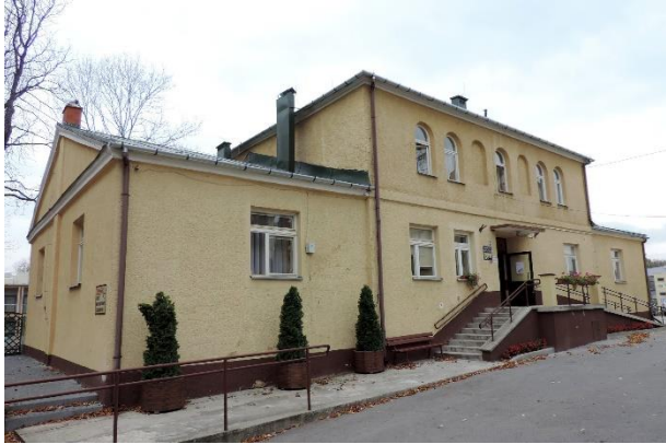
Zdjęcie nr 25. Pawilon zachodni - sanatorium nr 2 (dawny szpital św. Mikołaja), ul. 1 Maja 3 w Busku - Zdroju