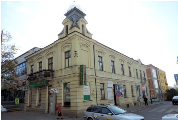
Zdjęcie nr 36. Dom, pl. Zwycięstwa 10 w Busku - Zdroju