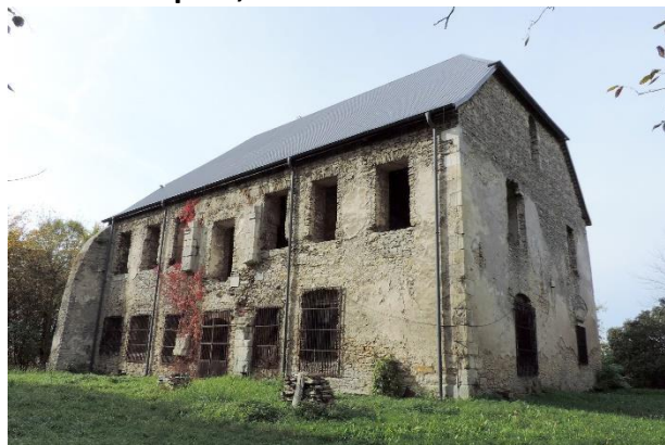
Zdjęcie nr 21. Dwór w zespole, Szaniec

Datowanie: XV w. (przed 1499 r.), rozbudowany w latach 1580 - 1609 .