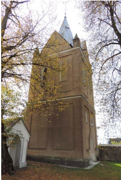
Zdjęcie nr 12. Dzwonnica w zespole kościelnym pw. Wniebowzięcia NMP, Szaniec