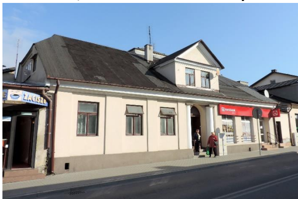
Zdjęcie nr 34. Dom, ul. Bohaterów Warszawy 4 w Busku - Zdroju