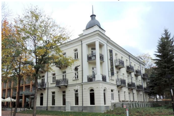
Zdjęcie nr 29. Willa „Bristol”, ul. 1 Maja 1 w Busko - Zdroju