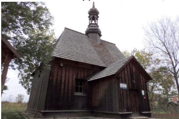
Zdjęcie nr 6. Kościół filialny pw. św. Stanisława, Chotelek