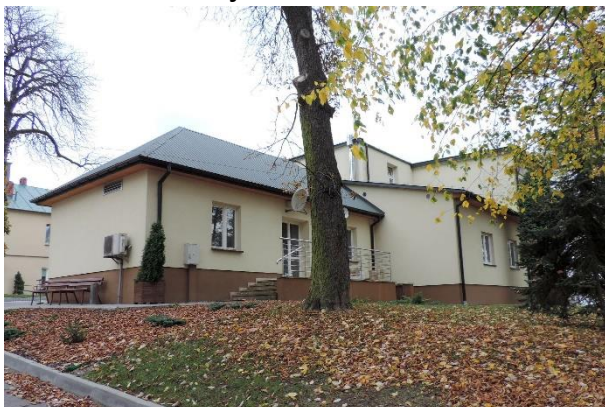
Zdjęcie nr 26. Pawilon południowy - sanatorium nr 2 (dawny szpital św. Mikołaja), ul. 1 Maja 3 w Busku - Zdroju