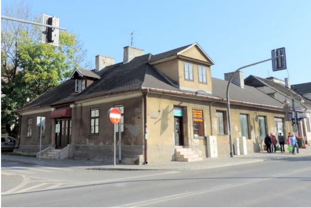
Zdjęcie nr 35. Dom, ul. Bohaterów Warszawy 6 w Busku - Zdroju