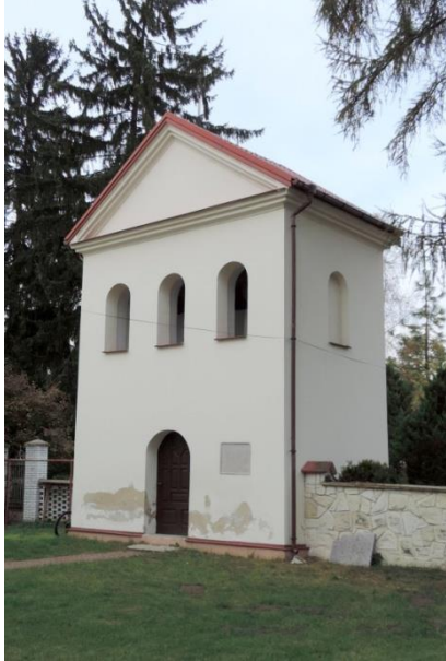
Zdjęcie nr 10. Dzwonnica w zespole kościoła parafialnego pw. św. Wojciecha, Janina