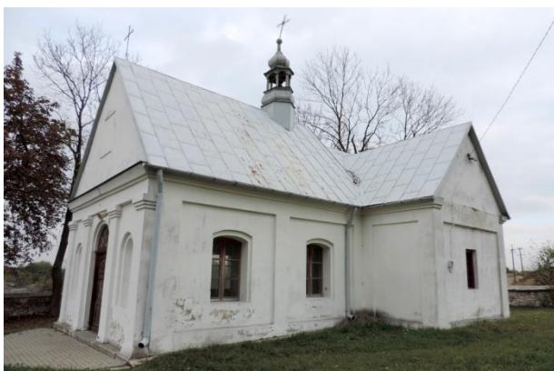
Zdjęcie nr 17. Kościół filialny pw. NMP, ob. kaplica pw. Matki Boskiej Anielskiej, Widuchowa