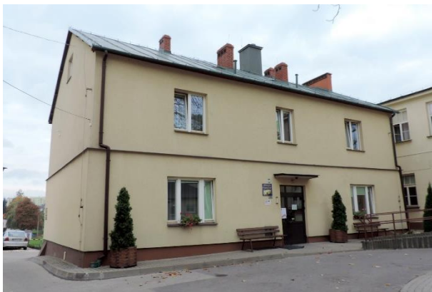
Zdjęcie nr 27. Pawilon północny - sanatorium nr 2 (dawny szpital św. Mikołaja), ul. 1 Maja 3 w Busku - Zdroju