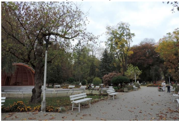
Zdjęcie nr 24. Park w zespole uzdrowiskowym w Busku - Zdroju