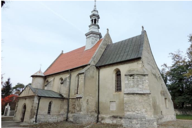
Zdjęcie nr 7. Kościół parafialny pw. św. Marii Magdaleny w zespole, Dobrowoda

Datowanie: ok. poł. XIV w., XV w., lata 1524 - 1525 r., pocz. XX w.