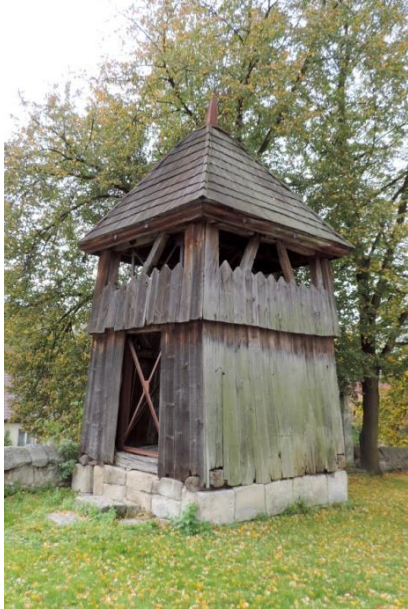
Zdjęcie nr 8. Dzwonnica w zespole kościoła parafialnego pw. św. Marii Magdaleny, Dobrowoda