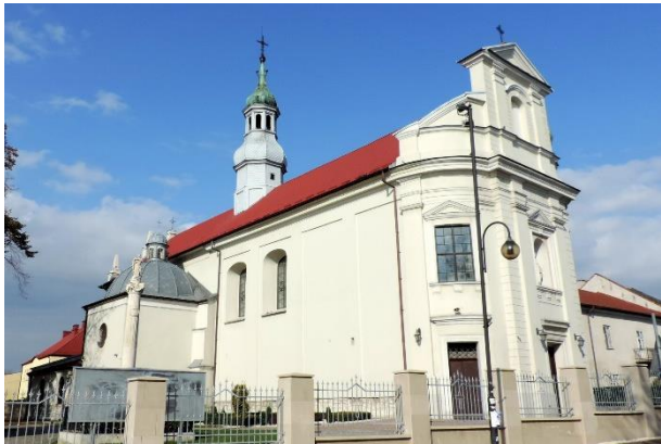
Zdjęcie nr 3. Kościół parafialny pw. Niepokalanego Poczęcia NMP w zespole klasztornym norbertanek, ul. Bohaterów Warszawy 8 w Busku - Zdroju

Datowanie: lata 1592 - 1621 r., ok. 1804, lata 40 - te XX w.