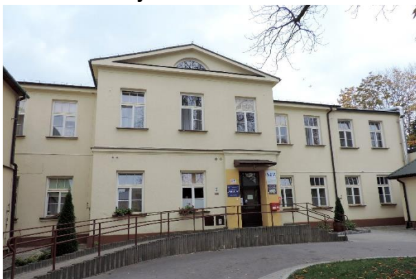
Zdjęcie nr 28. Pawilon wschodni - sanatorium nr 2 (dawny szpital św. Mikołaja), ul. 1 Maja 3 w Busku - Zdroju