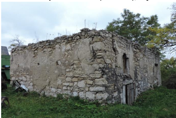
Zdjęcie nr 18. Zbór protestancki (ariański), Pęczelice