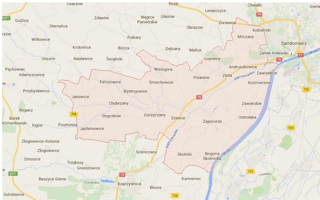
Rys. 2. Gmina Samborzec

kulturowego o cechach rolniczych, fakt ten potwierdza nie tylko historia, ale również elementy krajobrazu kulturowego, które do dziś przetrwały na tych terenach. Wszystkie one związane są z działalnością i kulturą rolniczą, z którą obszar ten związany był od zawsze, a która dziś wydaje się stać tu na dość wysokim poziomie.