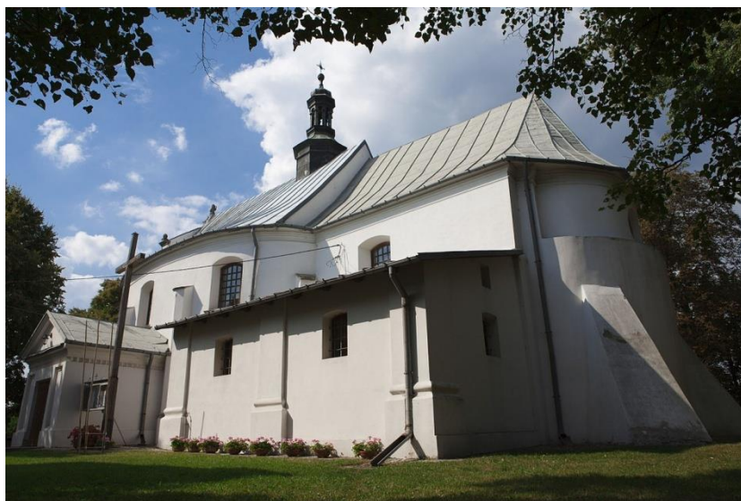
Rys. 3. Kościół Parafialny w Samborcu

Kościół Parafialny w Samborcu został prawdopodobnie wybudowany w połowie XIII w. przez Pawła z Samborca. W czasie wojen szwedzkich kościół został zniszczony. Od 1688 r. rozpoczęto odbudowę, która trwała do 1691 r. W tym czasie kościół został powiększony przez dobudowanie nawy