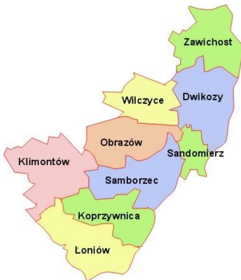
Rys. 1. Położenie Gminy Samborzec na tle powiatu sandomierskiego.