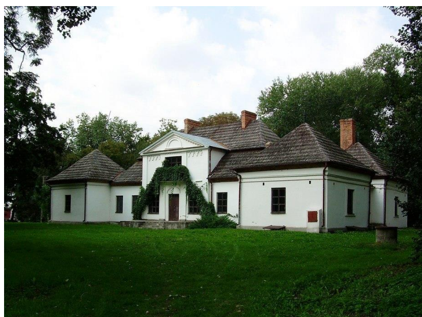
Rys. 7. Dworek w Skotnikach