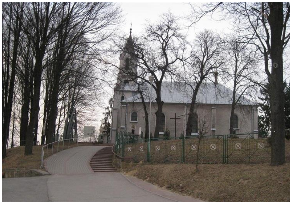
Rys. 5. Kościół Parafialny w Chobrzeżanach