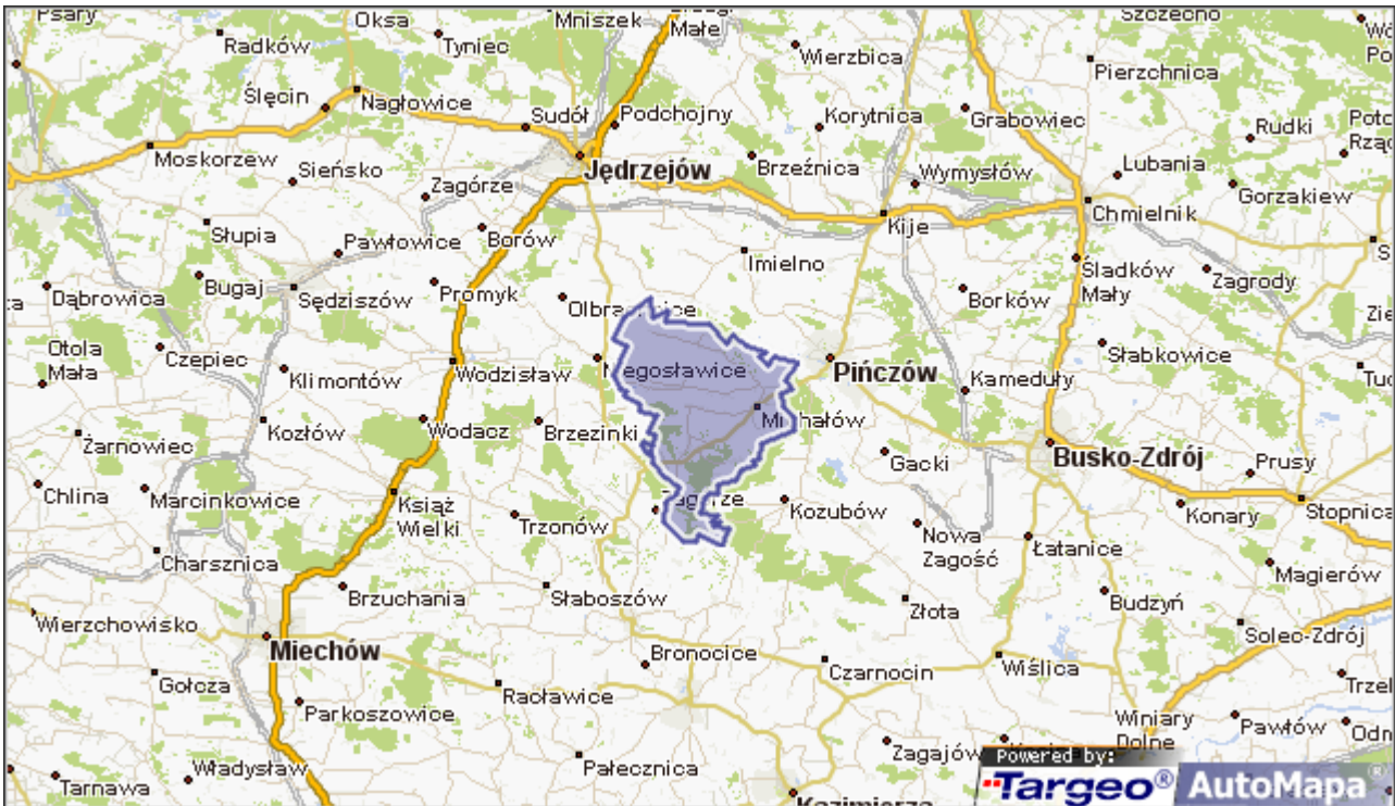
Rys.2. Lokalizacja Gminy Michałów.

Powierzchnia gminy wynosi 11 209 ha. Gminę zamieszkuje 4788 osób (wg stanu na 30.XII.2013r.). Gmina ma charakter rolniczy, użytki rolne zajmują 7928 ha jej całkowitej powierzchni. Grunty orne zajmują 6866 ha, sady 42 ha, łąki 750 ha a pastwiska 270 ha. Dane te odnoszą się do końca 2005 r. Powierzchnia gruntów leśnych ogółem wynosi 2317,02 ha (wg danych na koniec 2013r.), co stanowi 20,02 % powierzchni gminy. W tym grunty leśne publiczne obejmują powierzchnię 1899,02 ha, a grunty leśne prywatne 418 ha. Lasy w większości administrowane są przez Lasy Państwowe (Nadleśnictwo Pińczów). Lesistość poszczególnych sołectw jest zróżnicowana – od ok. 45 % w sołectwach Góry i Polichno do zupełnie pozbawionych lasów miejscowości Tur Górny, Zagajówek czy Zawale Niegosławskie.