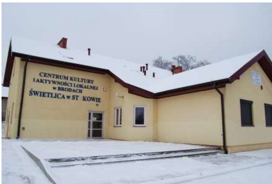
Zdjęcie 55: Centrum Kultury i Aktywności Lokalnej oddział w Stykowie

Zespoły artystyczne działające w ramach Centrum Kultury i Aktywności Lokalnej: