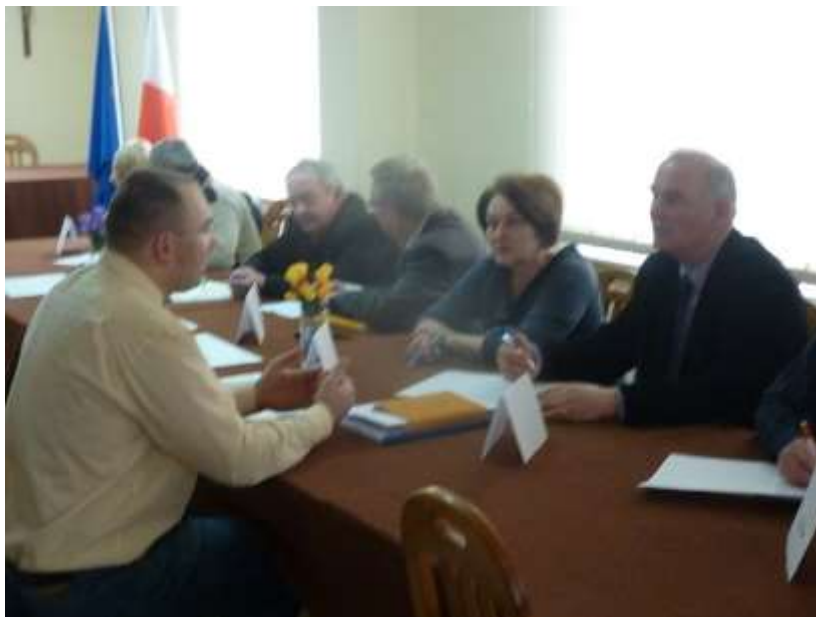
Zdjęcie 7: Konsultacje podczas zadania w parach