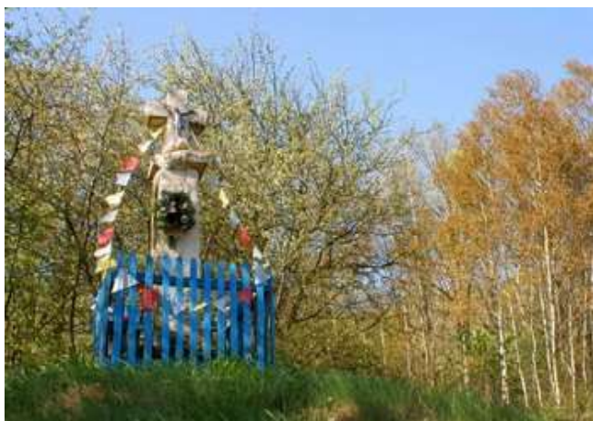
Zdjęcie 27: Kapliczka Chrystusa Frasobliwego w Brodach

Warto również zwrócić uwagę na charakterystyczną cechę miejscowości wchodzących w skład gminy Brody a dokładnie na występujące tu bardzo licznie kapliczki przydrożne. Tak samo często spotkać tu można także krzyże i wolno stojące figury Maryjne lub związane z wiarą katolicką. Najczęściej widoczne są koło wylotów dróg wiodących do danej osady, stoją na centralnych miejscach poszczególnych miejscowości oraz w pobliżu kościołów. Niektórzy mieszkańcy mają tego typu „zabudowę” na swoich prywatnych posesjach. W Brodach niedaleko torów i Zalewu Brodzkiego, przy starej drodze znajduje się kapliczka z 1817 roku. Każdego roku kapliczka jest odnawiana. Mimo, że stoi na uboczu mieszkańcy stale ją pielęgnują.