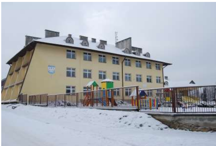
Zdjęcie 43: Szkoła Podstawowa w Krynkach oraz Publiczne Gimnazjum w Krynkach