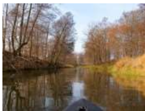
Zdjęcie 14: Rzeka Kamienna i Zdjęcie 15: Rzeka Kamienna

Na rzece Kamiennej w 1964 roku na miejscu dawnej „Staszicowskiej tamy” powstała zapora ziemna z czterokomorowym jazem, który reguluje poziom wody. Pierwotnie istotną motywacją do rozpoczęcia tej inwestycji była konieczność stworzenia punktu ujęcia wody dla potrzeb Zakładów Górniczo - Metalowych w Zębcu. Ostatecznie jednak, samo ujęcie przestało być niezbędne i nie zostało wykonane. Zalew spełnia obecnie nie tylko funkcję