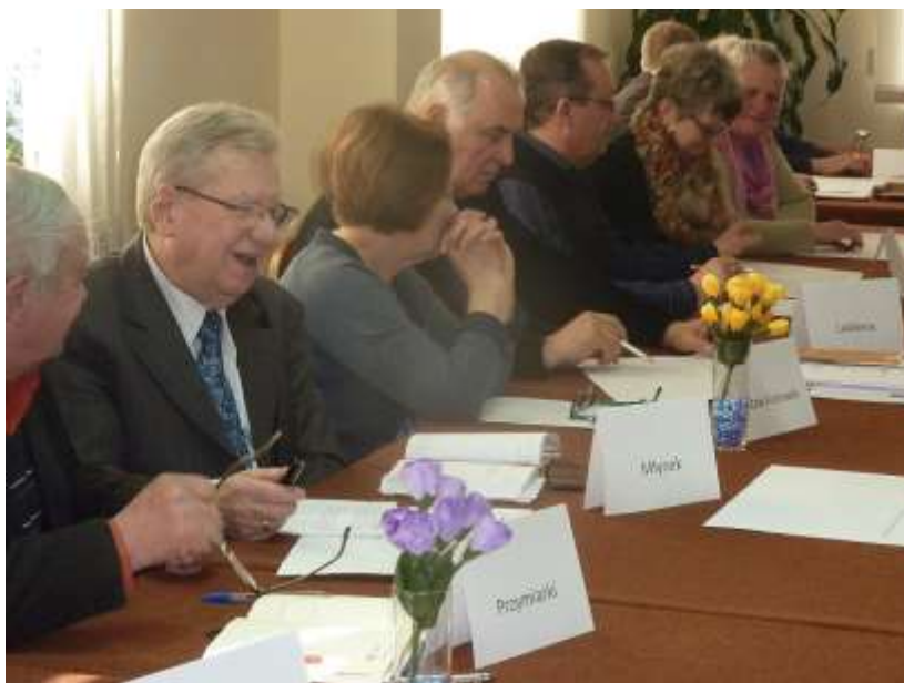
Zdjęcie 9: Praca w zespołach