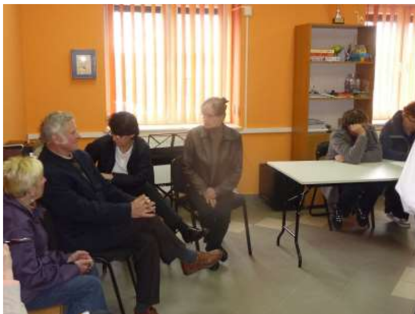
Zdjęcie 12: Spotkanie z mieszkańcami w Stykowie