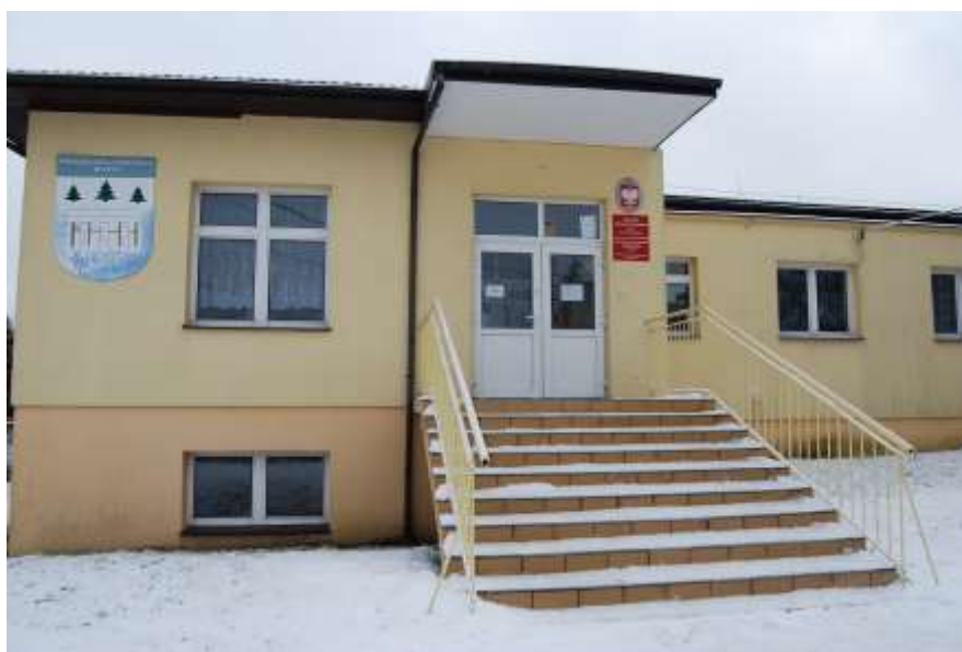
Zdjęcie 44: Szkoła Podstawowa w Lipiu

Szkoła jest niewielka, liczy 34 uczniów. Natomiast liczba etatów nauczycielskich wynosi 6,5. Szkoła daje zatrudnienie jednej woźnej. Placówka posiada 5 sal lekcyjnych (w tym sala komputerowa, w której znajduje się 11 komputerów), biblioteka oraz boisko zewnętrzne.