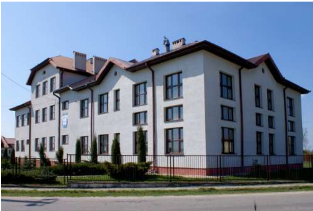
Zdjęcie 40: Szkoła Podstawowa w Adamowie - fot. Urząd Gminy w Brodach

W szkole uczy się łącznie 82 uczniów: 72 w PSP i 10 w zerówce. Placówka zatrudnia 11 nauczycieli a także jednego woźnego i jednego pracownika gospodarczego. Szkoła dysponuje 9 salami lekcyjnymi, biblioteką, świetlicą, salą gimnastyczną i boiskiem zewnętrznym. Z tym, że sala gimnastyczna nie spełnia wszystkich potrzeb gdyż jest zbyt mała. Ponadto w szkole jest pracownia językowa, z której korzystają wszystkie dzieci. Do dyspozycji uczniów jest 10 komputerów ale istnieje potrzeba zakupu kolejnych. Szkoła jako jedna z nielicznych prowadzi zajęcia e- learningowe.