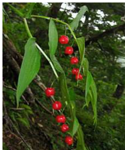
Zdjęcie 19: Arnika górská, Zdjęcie 20: Liczydło górskie

Urwiska wzdłuż rzeki Kamiennej porośnięte są lasem na ubogich stanowiskach piaszczystych. Słabsze gleby porastają bory mieszane i świeże bory sosnowe. Wśród użytków leśnych można wyodrębnić również lasy na ziemiach średnio żyznych i żyznych, charakteryzujące się dobrymi warunkami bioklimatycznymi. Biorąc zaś pod uwagę grunty orne, na terenie gminy Brody bardzo małą część stanowią ziemie szczególnie chronione przed zmianą użytkowania na cele nierolnicze. W większości tereny gminy pokrywają gleby lessowe. Występują one w miejscowościach takich jak: Krynki i Brody. Gleby są średnio przydatne pod uprawy rolne a miejscami słabe i bardzo słabe. Także tu występują rodzaje chronione, jak np. wawrzynek główkowaty, wisienka stepowa, zawilec wielkokwiatowy, len złocisty, aster gawędka. W najbardziej niedostępnych dla człowieka rejonach, w głębi lasu żyje wiele gatunków zwierząt. Wytrwały wędrowiec w tej „oazie spokoju” może natknąć się i zobaczyć z bliska jelenie, sarny, dziki oraz borsuki w swoim naturalnym środowisku. Jeśli zaś zwierzęta nie wyjdą im na przeciw istnieje szansa, że przynajmniej uda się zlokalizować ich ślady. Można tu też usłyszeć głos jastrzębia gołębiarza wijącego gniazdo a także sokoła