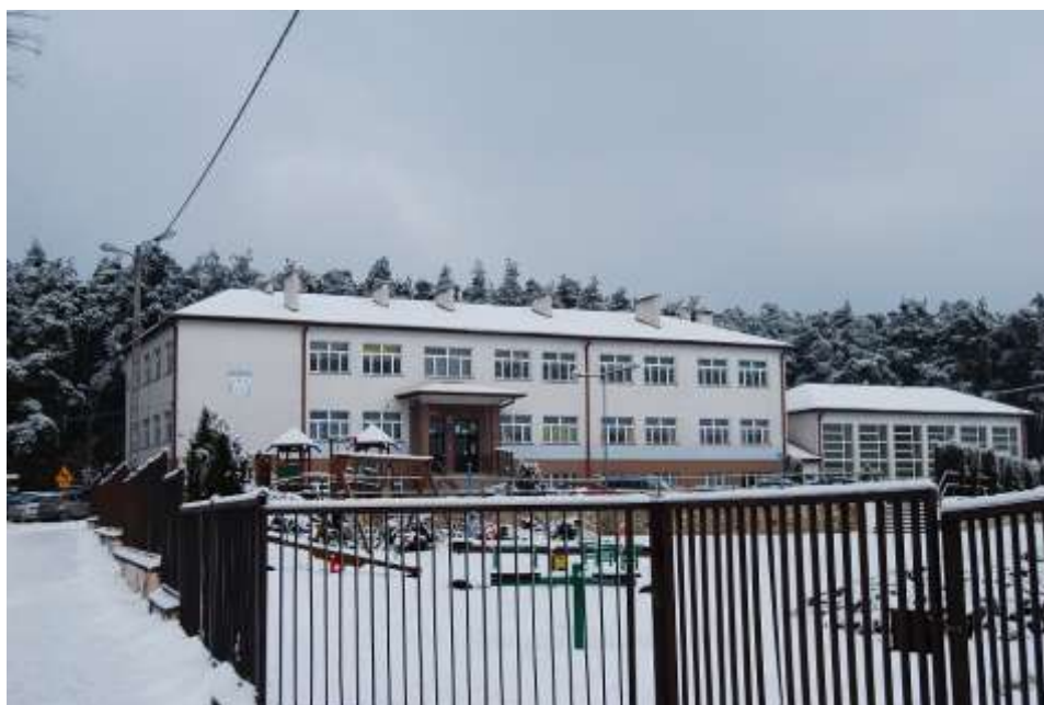
Zdjęcie 47: Szkoła Podstawowa w Stawie Kunowskim

Dzieci pobierają naukę w klasach oddzielnych. Pogłębiają swoje zdolności i umiejętności poprzez udział w różnych kołach zainteresowań. Począwszy od klasy „0” uczą się dwóch języków obcych oraz informatyki. Nauczyciele dbają o bezpieczeństwo i wszechstronny rozwój dzieci. Wychodząc naprzeciw zapotrzebowaniu środowiska Stowarzyszenie powołało z dniem 01.09.2003 r. Przedszkole dla dzieci w wieku od 3-5 lat, a od 01.09.2004r. pierwszą klasę Gimnazjum. Rodzice dzieci uczących się w/w placówkach chętnie uczestniczą w pracach na rzecz szkoły. 27 Aktualnie w szkole kształcą się 78 uczniów PSP oraz 25 dzieci w oddziale przedszkolnym. W szkole pracuje 10 nauczycieli, 2 sprzątaczkę i jedna kucharka. Uczniowie mają do dyspozycji 13 komputerów oraz pracownię językową. Szkoła posiada 8 sal lekcyjnych, salę gimnastyczną, boisko zewnętrzne, bibliotekę oraz świetlicę.