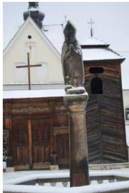
Zdjęcie 29 :Figura Chrystusa Frasobliwego, Zdjęcie 30: Figura św. Stanisława Biskupa w Krynkach

Równie znana i widoczna jest kapliczka św. Jana Nepomucena w Lubieni , kapliczka w Lipiu z 1849 postawiona w dobie panowania epidemii cholery oraz kapliczka z 1912 roku w Stykowie.