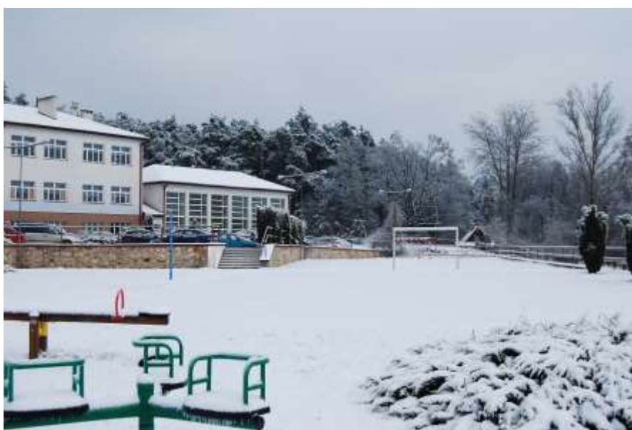
Zdjęcie 53: Sala gimnastyczna oraz boisko przy szkole w Stawie Kunowskim

Na hali sportowej w Krynkach organizowane są rozgrywki w ramach Ligi Piłki Halowej. Celem zmagania jest popularyzacja halowej piłki nożnej wśród mieszkańców gminy Brody a także całego powiatu starachowickiego. Jest to także propagowanie formy aktywnego wypoczynku. Dodatkowo na obiektach zaliczanych do infrastruktury sportowej mają miejsce mecze w ramach Amatorskiej Ligi Piłkarskiej.