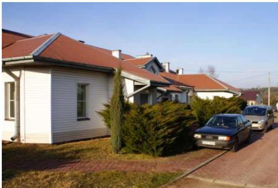
Zdjęcie 38: Ośrodek zdrowia Styków

Gmina Brody zrealizowała w ostatnim czasie projekt pn. Zagospodarowanie przestrzeni publicznej przy Ośrodku Zdrowia w Brodach z siedzibą w Krynkach – wartość dofinansowania wyniosła 104 309 zł.