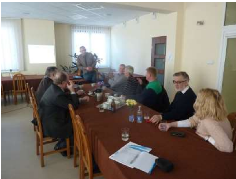
Zdjęcie 5: Spotkanie z przedsiębiorcami

Przedsiębiorcy wskazali również potrzeby i działania, które należy podjąć, aby pobudzić przedsiębiorczość w Gminie. W tym celu oczekują od Gminy: