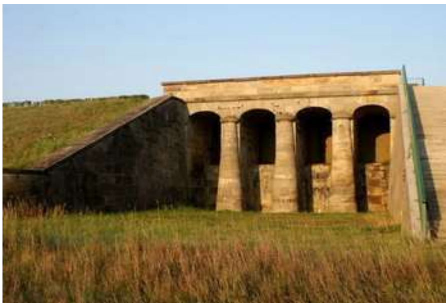
Zdjęcie 23: Zabytkowy przelew wodny w Brodach

Niegdyś służył do spiętrzania wód rzeki napędzając urządzenia walcowni i zakładu hutniczego w Brodach. Jaz po dziś dzień jest w świetnym stanie architektonicznym i malowniczo wkomponowanym we współczesną tamę. Obiekt ten stanowi nieodłączny element gminy i dlatego znalazł się w jej herbie. Część zabytkowej tamy przypomina o wielkim budowniczym Staropolskiego Okręgu Przemysłowego, - księdzu Stanisławie Staszicu, który w 1816 r. objął stanowisko Generalnego Dyrektora Przemysłu i Kunsztów w Królestwie Kongresowym. Choć zachowany fragment posiada charakter reliktowy jest on także istotnym zabytkiem z punktu widzenia techniki ponieważ: