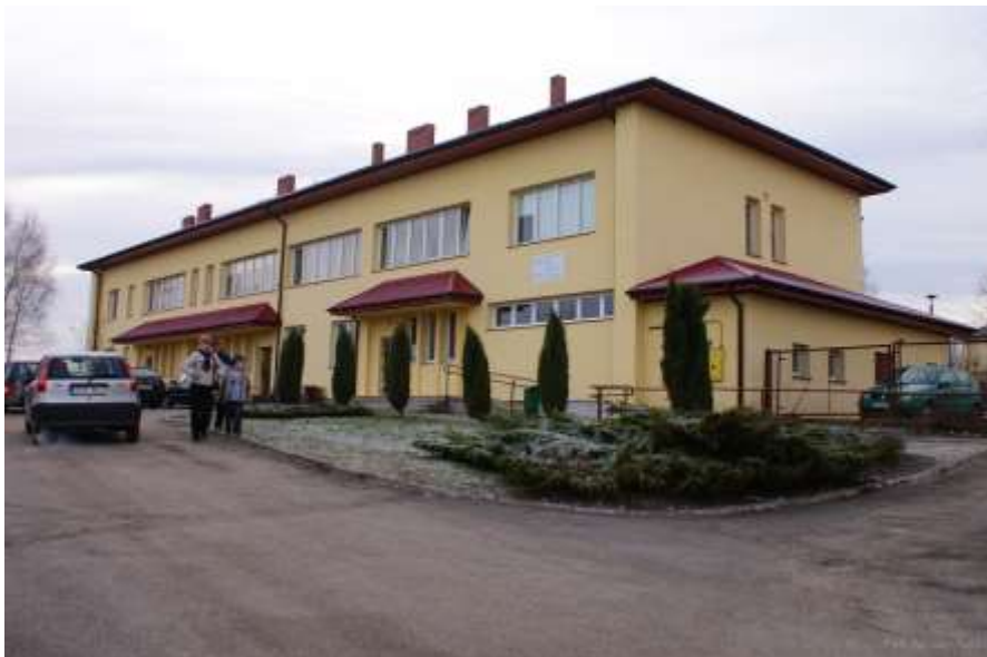
Zdjęcie 37: Ośrodek zdrowia Krynki

Gmina Brody zrealizowała w ostatnim czasie projekt pn. Zagospodarowanie przestrzeni publicznej przy Ośrodku Zdrowia w Brodach z siedzibą w Krynkach – wartość dofinansowania wyniosła 104 309 zł.