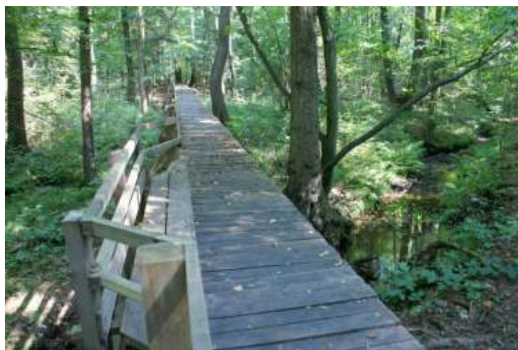
Zdjęcie 34: Rezerwat „Rosochacz”

Rezerwat "Rosochacz" położony jest w pobliżu miejscowości Lubienia, na skraju lasu, przy trasie Starachowice - Lubienia. Rosnące przy trasie pomnikowe drzewa tworzą coś na kształt bramy wejściowej do rezerwatu. Obejmuje on lasy obszaru rzeczki Świętojanki. Obszar ten jest trudno dostępny ze względu na bagniste podłoże lasu, które stanowi jednocześnie enklawę cennej flory i fauny Lasów Iłżeckich. Przebiega tędy ok. dwukilometrowa ścieżka dydaktyczna, przy której możemy poznawać interesujące i chronione gatunki roślin. W tym celu wybudowano tam specjalne pomosty do obserwacji. Rośnie tu m. in. wawrzynek wilczelyko, cis, rosiczka okrągłolistna, widłak jałowcowaty, widłak wroniec, lilia złotogłów, podkolan biały, starzec Fuchsa. Dla rezerwatu „Rosochacz” obowiązuje plan ochrony 16 .