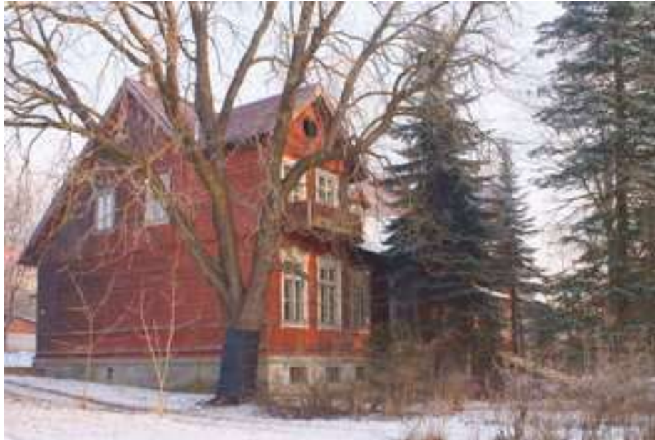
Zdjęcie 25: Modrzewiowy Dom w Brodach

Listę obiektów zabytkowych zamyka linia kolejki wąskotorowej. Jest usytuowana w bliskim sąsiedztwie miejscowości Lipie. Jej trasa biegnie ze Starachowic do Iłży. Aktualnie linia jest uruchomiona na odcinku Starachowice – Lipie i zajmuje w Rejestrze Zabytków jednocześnie numer 1184 z 14.02.1995 oraz A.827.