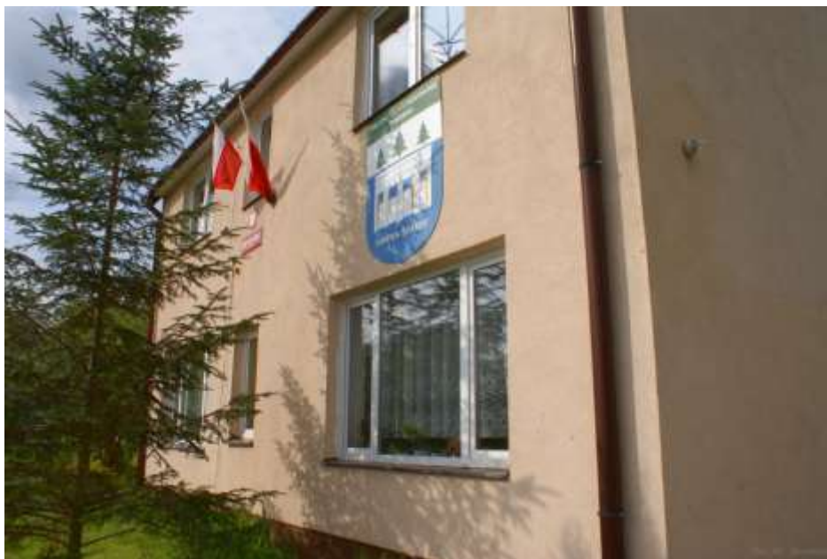
Zdjęcie 48: Szkoła Podstawowa w Rudnik