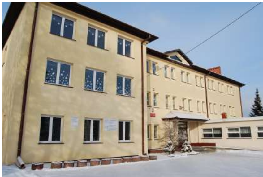
Zdjęcie 45: Szkoła Podstawowa w Lubieni