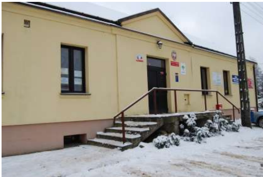
Zdjęcie 24: Budynek klasycystyczny z 1840 roku w Brodach

Na liście zabytków figurują jeszcze dom zarządu dawnej walcowni i pudlingarni. Znajduje się w pobliżu Urzędu Gminy w Brodach i zwany jest także budynkiem klasycystycznym z 1840 roku.