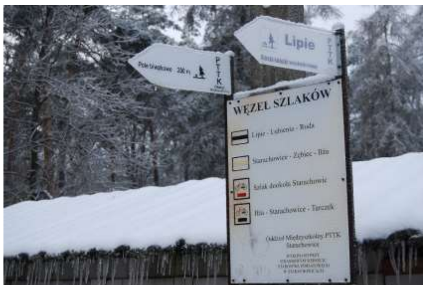
Zdjęcie 21: Informacja turystyczna w Lipiu

Gmina Brody to także bogactwo szlaków turystycznych. Zarówno piesi jak i miłośnicy jazdy na rowerze znajdą tu coś dla siebie.