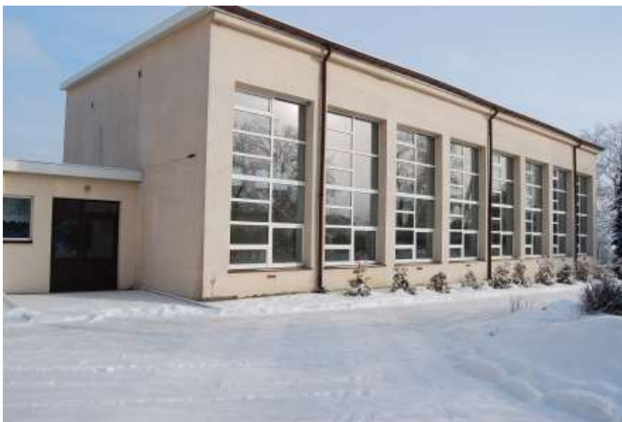
Zdjęcie 52: Sala gimnastyczna przy Szkole Podstawowej w Lubieni