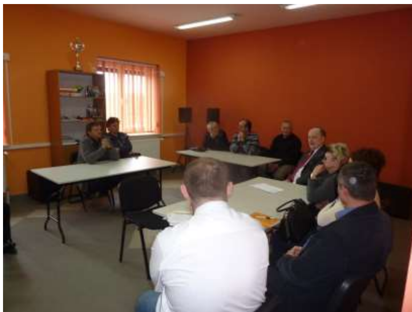
Zdjęcie 11: Spotkanie z mieszkańcami w Stykowie