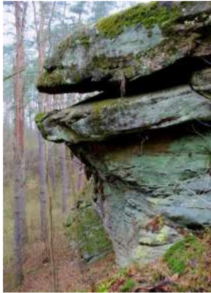
Zdjęcie 35: Rezerwat „Skały w Krynkach”

Celem ochrony jest ochrona i zachowanie monumentalnych bloków piaskowca dolnotriasowego. Niektóre skały swoim kształtem przypominają okapy, ambony lub wielkie grzyby. Osady powstawały na dnie koryta rzeki, o czym świadczy ich uziarnienie i warstwowania przekątne. Interesujący jest fakt, że niedaleko od rezerwatu, w Krynkach znajduje się odsłonięcie skał powstałych w podobnym okresie, lecz w środowisku morskim (zobacz: ściana skalna w Krynkach). W skraju rezerwatu można odnaleźć także mroczny wąwóz z pionowymi, wysokimi ścianami skalnymi sięgającymi 10 m. Dla Rezerwatu „Skały w Krynkach” obowiązuje plan ochrony 17 .