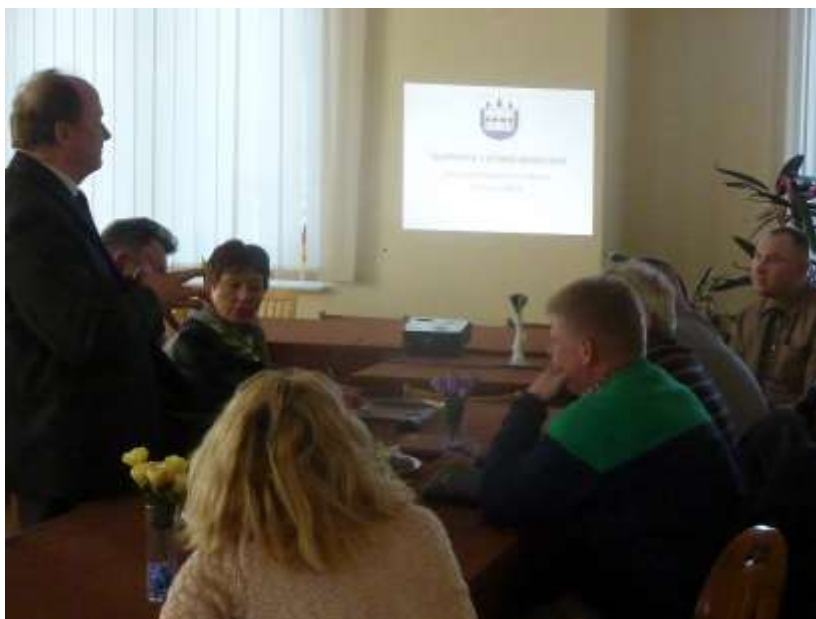
Zdjęcie 3: Spotkanie 2 z przedsiębiorcami

Podczas spotkania omówiono aktualną sytuację w obszarze „przedsiębiorczość” na terenie Gminy. Jako największego przedsiębiorcę wskazano firmę Zębiec, która zatrudnia ok.700 osób. Cała reszta to mikro, małe lub średnie przedsiębiorstwa.