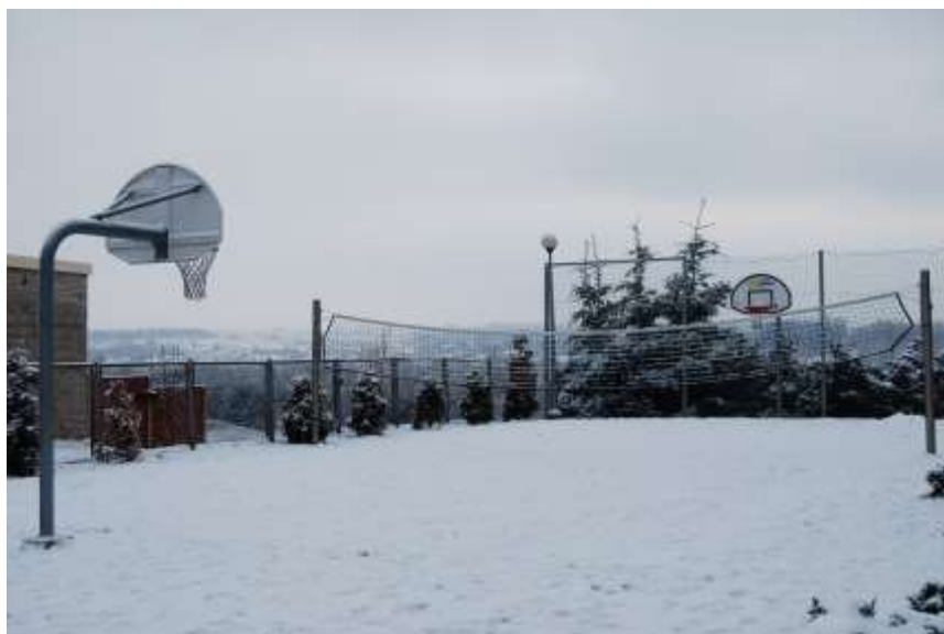
Zdjęcie 50: Boisko przy budynku szkoły w Dziurowie