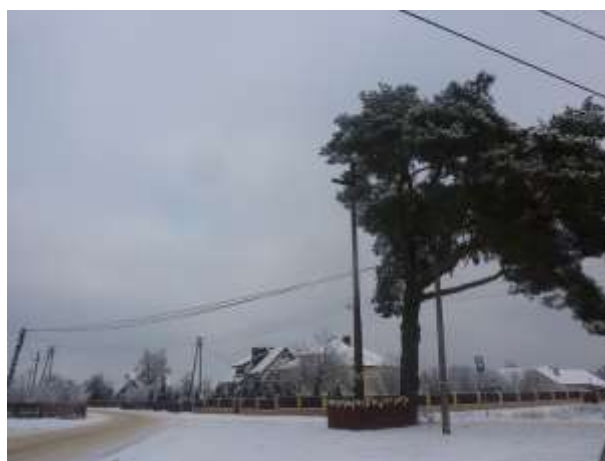
Zdjęcie 31: Kapliczka w Stykowie