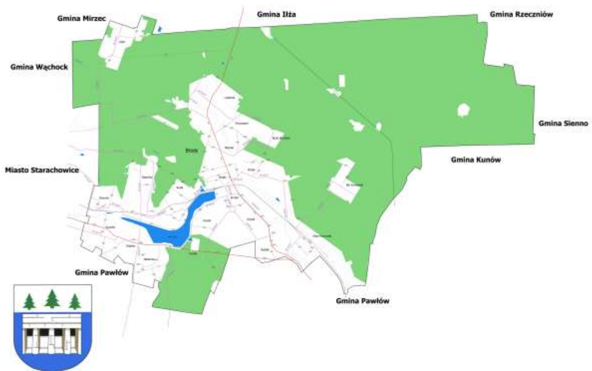
Mapa 1: Mapa Gminy Brody – Urząd Gminy Brody

Gmina Brody usytuowana jest w północno – wschodniej części województwa świętokrzyskiego, w powiecie starachowickim. Gmina leży na pograniczu trzech mezoregionów geograficznych takich jak: Wyżyna Opatowska, Podgórze Iłżeckie, Wzgórza Kunowskie. W promieniu około 50 km od Brodów znajdują się Radom i Kielce. 1 Graniczy od północy z gminą Iłża, od północnego – zachodu z gminą Mirzec zaś od północnego- wschodu z gminą Rzecznów. Następnie od wschodu graniczy z gminą Sienno oraz gminą Kunów. Od południa z gminą Pawłów a po zachodniej stronie z gminą Wąchock oraz miastem Starachowice. Przez teren gminy Brody przepływa rzeka Kamienna.