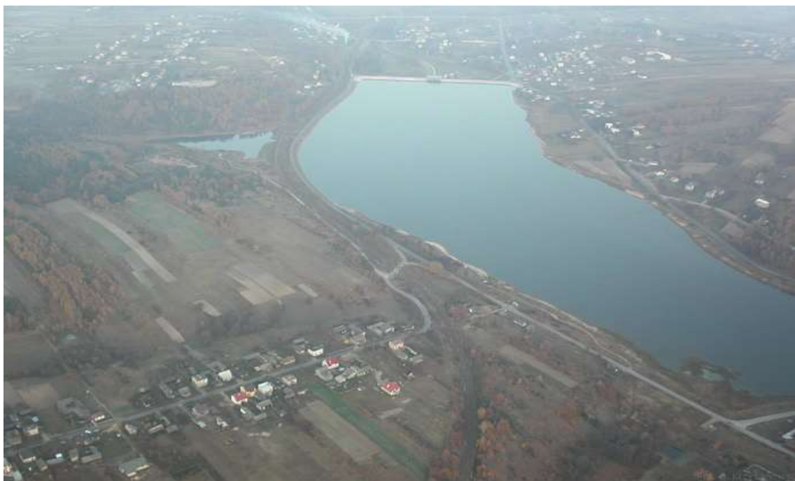
Zdjęcie 16: Zalew Brody z „lotu ptaka” - fot. Urząd Gminy Brody

Urodę krajobrazu dodatkowo urozmaica rzeka Kamienna oraz zbiornik retencyjny na niej wybudowany. Sama rzeka ma charakter górski i wyznacza szlaki komunikacyjne oraz osiedleńcze. Natomiast zalew pełni przede wszystkim rolę retencyjną. Jednak przy okazji jest to miejsce o znaczeniu turystycznym i rekreacyjnym. Dzięki wspólnym staraniom i chęciom udało się zagospodarować tereny wokół akwenu tak by miejscowi oraz przyjezdni mogli tu w aktywny sposób spędzać czas wolny. Jest to pewnego rodzaju centrum turystyczne z rozwiniętą bazą noclegową i gastronomiczną. „Perła” regionalnego krajobrazu doceniana jest przez wielu miłośników sportów wodnych. Do dyspozycji są tu: trzy przystanie oraz wypożyczalnie żaglówek, motorówek, rowerów wodnych itp. Zalew równie chętnie odwiedzają wędkarze. Spacerując wzdłuż linii brzegowej można oglądać pobliskie skały, chronione w rezerwatach, wliczane do pomników przyrody.