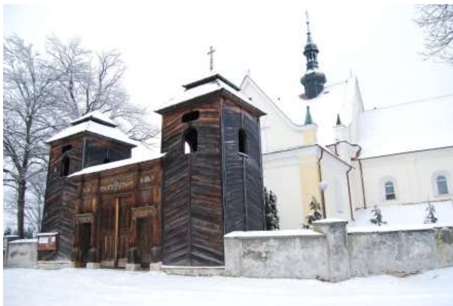
Zdjęcie 22: Kościół w Krynkach