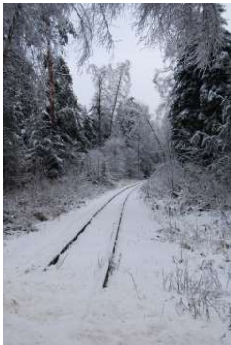
Zdjęcie 26: Fragment kolejki wąskotorowej w okolicy miejscowości Lipie fot. GRACZKOWSKI DOTACJE Spółka z o.o.

Listę obiektów zabytkowych zamyka linia kolejki wąskotorowej. Jest usytuowana w bliskim sąsiedztwie miejscowości Lipie. Jej trasa biegnie ze Starachowic do Iłży. Aktualnie linia jest uruchomiona na odcinku Starachowice – Lipie i zajmuje w Rejestrze Zabytków jednocześnie numer 1184 z 14.02.1995 oraz A.827.