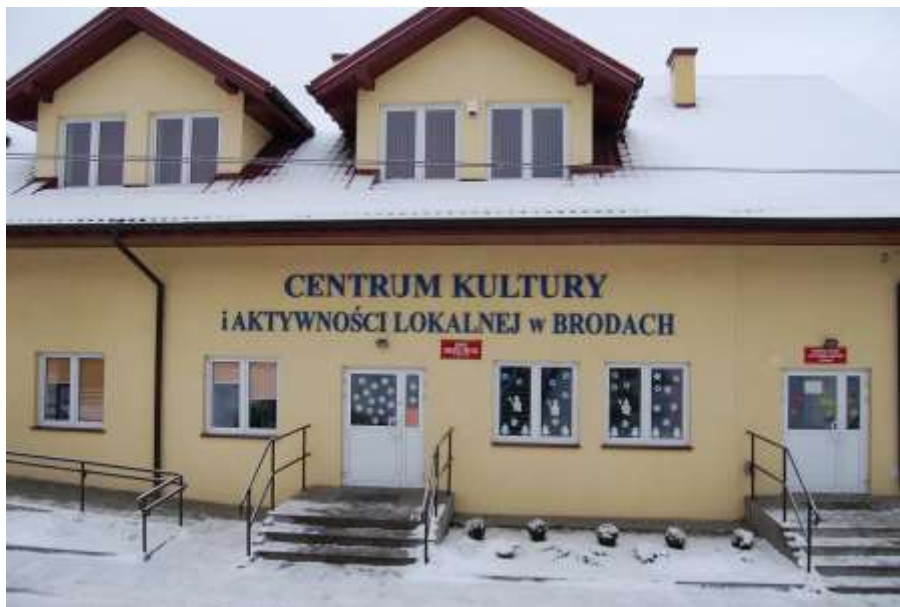
Zdjęcie 54: Centrum Kultury i Aktywności Lokalnej w Brodach

Animatorami działań o charakterze kulturalnym są lokalne władze, które starają się wychodzić naprzeciw oczekiwaniom i potrzebom mieszkańców w tym zakresie. Dodatkowo na terenie gminy znajduje się Centrum Kultury i Aktywności Lokalnej wspierające i organizujące liczne imprezy kulturalne i sportowe.