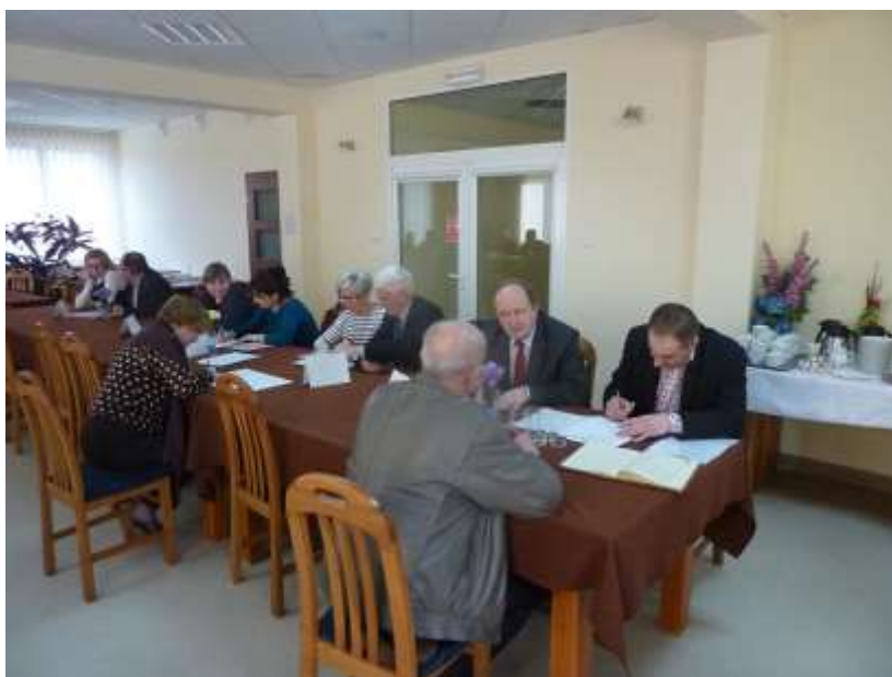
Zdjęcie 8: Praca w parach