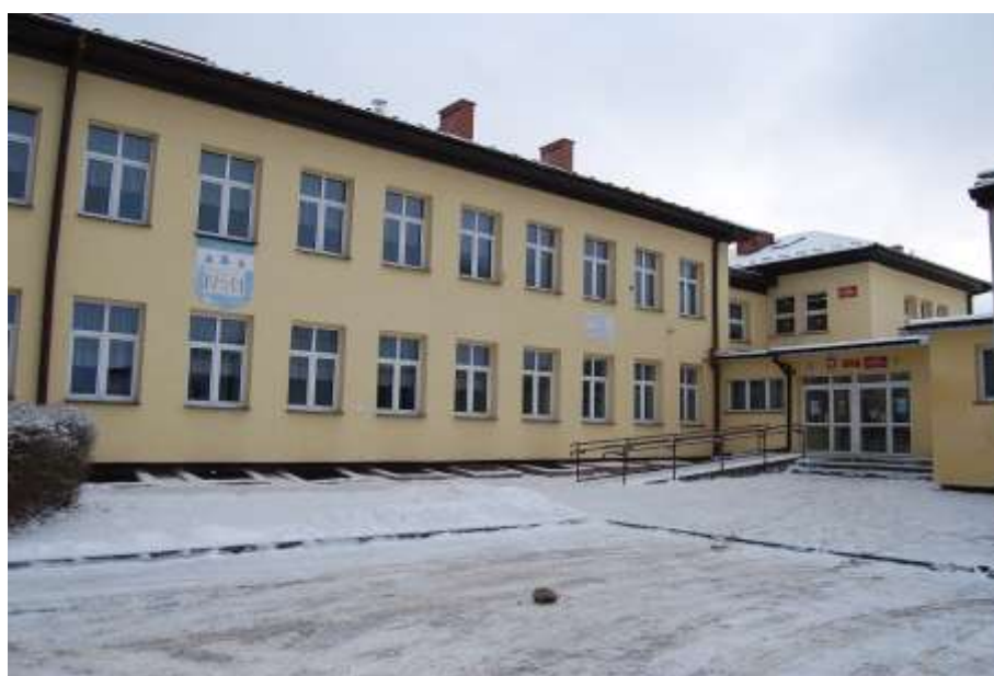
Zdjęcie 49: Szkoła w Stykowie

Aktualnie szkoła kształci 132 uczniów. Zatrudnia 14 nauczycieli oraz 2 sprzątaczkę, 1 kucharkę, 1 intendentkę i woźnego na ½ etatu. Budynek mieści 8 sal lekcyjnych z czego jedna przeznaczona jest dla oddziału przedszkolnego. Do dyspozycji uczniów jest 30 komputerów, biblioteka, świetlica, stołówka, sala gimnastyczna i boisko zewnętrzne.