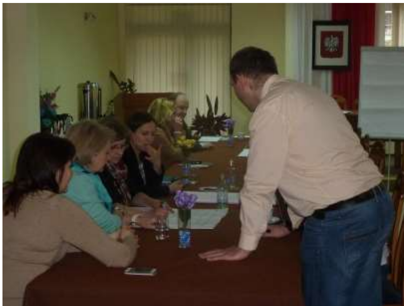
Zdjęcie 1: Spotkanie 1 z organizacjami pozarządowymi i szkołami