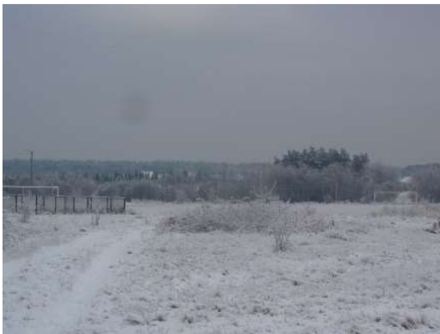
Zdjęcie 51: Boisko przy szkole w Lipiu