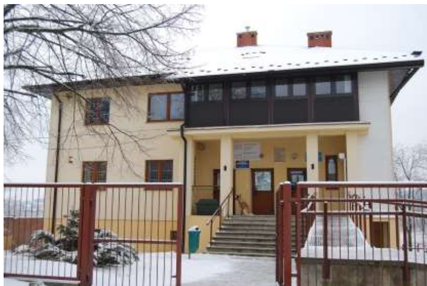
Zdjęcie 39: Ośrodek Zdrowia w Lubieni