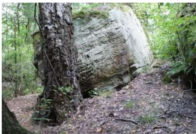
Zdjęcie 36: Rezerwat „Skały pod Adamowem”

przypadku skał w Krynkach nadały im bardzo nietypowe. Widoczne i liczne są drobne urzeźbienia powierzchni skał w postaci głębokich owalnych wgłębień przedzielonych koronkowymi żeberkami. Można tu też podziwiać rośliny porastające skały takie jak paprotka zwyczajna, zanokcica skalna, rojnik pospolity. Specyficzny mikroklimat powierzchni skał sprzyja także licznym porostom i mchom. Warto zwrócić uwagę na drzewostan rosnący na północ od ciągu skał. Mimo, że od dawna prowadzono tu wyrąb drzew, to malownicze położenie oraz sentyment do tego miejsca kolejnych pokoleń leśników sprawiły, że zachował się ponad stuletni bór sosnowo dębowy z domieszką brzozy 19 .