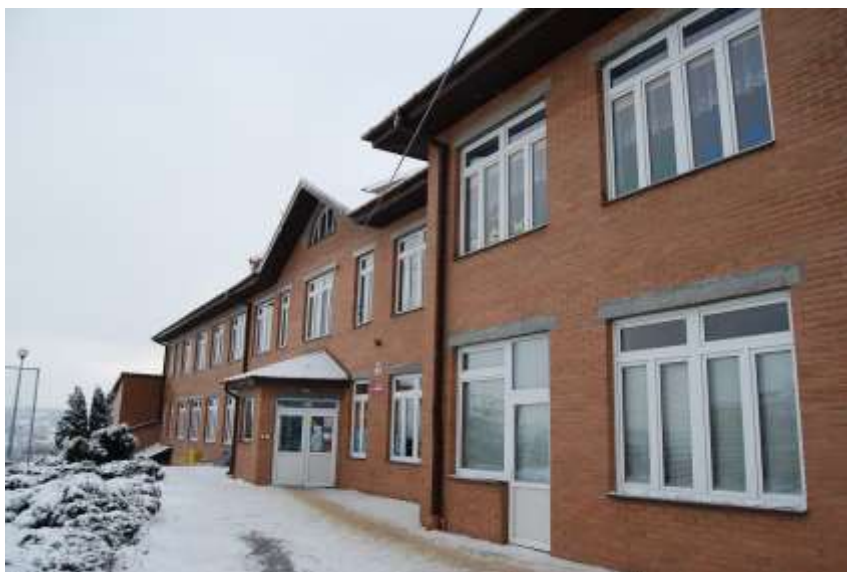
Zdjęcie 42: Szkoła Podstawowa w Dziurówie