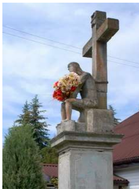
Zdjęcie 28: Figura Chrystusa Frasobliwego w Brodach

Także w Brodach znajduje się wyżej widoczna Figura Chrystusa Frasobliwego. Sporo tego typu zabytków znajduje się również w miejscowości Krynki. Wspomniana już wcześniej rzeźba św. Stanisława Biskupa obok kościoła, pochodząca najprawdopodobniej z drugiej połowy XVI w. Ponadto Figura Chrystusa Frasobliwego z XIX w., kapliczka św. Jana Napomucena datowana na początek XIX w., kapliczka w Krynkach z 1904 r. przedstawiająca Matkę Boską, która została ustawiona w 50-tą rocznicę dogmatu o niepokalanym poczęciu Najświętszej Maryi Panny.