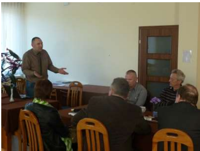
Zdjęcie 4: Spotkanie 2 z przedsiębiorcami

Podczas spotkania omówiono aktualną sytuację w obszarze „przedsiębiorczość” na terenie Gminy. Jako największego przedsiębiorcę wskazano firmę Zębiec, która zatrudnia ok.700 osób. Cała reszta to mikro, małe lub średnie przedsiębiorstwa.