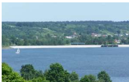
Zdjęcie 17: Zalew Brody, Zdjęcie 18: Zalew Brodzki