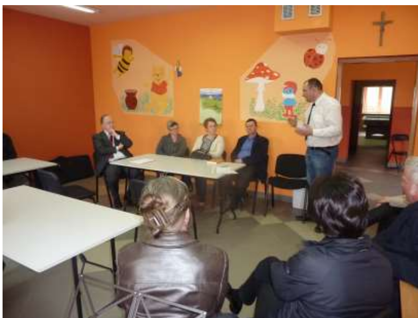
Zdjęcie 10: Spotkanie z mieszkańcami w Stykowie