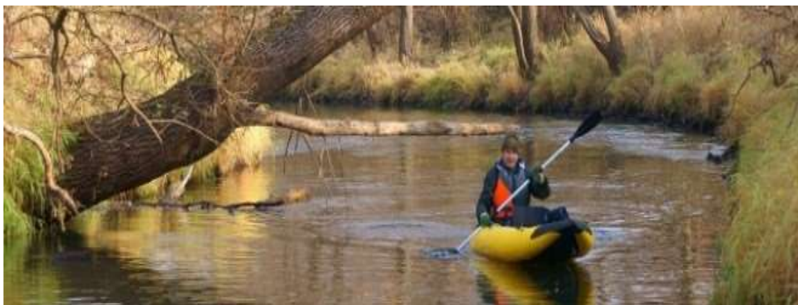
Zdjęcie 13: Rzeka Kamienna

Przez obszar gminy przepływa rzeka Kamienna, która jest rzeką II rzędu –lewy odpływ Wisły, o charakterze rzeki górskiej. Na prawie całym odcinku przepływa przez województwo świętokrzyskie. Aczkolwiek zarówno jej źródło oraz ujście znajdują się na obszarze województwa mazowieckiego. Na rzece powstało kilka zbiorników w tym jeden na terenie gminy Brody o nazwie Zalew Brodzki. Do rzek stałych na terenie gminy zalicza się także Ruśnię wpływającą bezpośrednio do Zalewu Brodzkiego, Brodek znajdujący ujście wpadając do Kamiennej w okolicach Brodów oraz kilka cieków i strumieni o stosunkowo małym przepływie, zamienionych w części na rowy odwadniające.