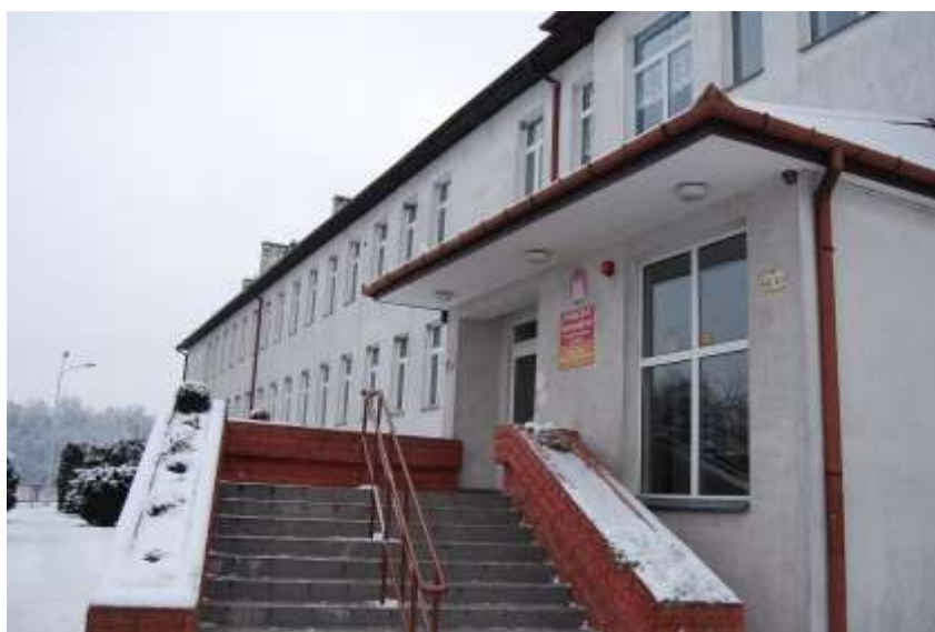
Zdjęcie 46: Szkoła w Rudzie

Szkoła Podstawowa nie jest zbyt dobrze wyposażona. W związku z czym korzysta z wyposażenia należącego do Gimnazjum w Rudzie. Do PSP uczęszcza 32 uczniów, którzy mają do dyspozycji 2 sale lekcyjne. Liczba etatów nauczycielskich wynosi 2,5. Natomiast jeśli chodzi o część gimnazjalną to uczęszcza do niego aż 170 uczniów, których naucza 21 nauczycieli. Dodatkowo placówka zatrudnia woźnych na 3 pełnych etatach, kucharzy na 2 pełny etatach, pomoc kucharza na 1 pełnym etacie, intendenta na 1 pełnym etacie oraz kierowcę na 1 pełnym etacie. Dla Gimnazjum przewidziano 11 sal lekcyjnych. Placówka dysponuje biblioteką, świetlicą, salą gimnastyczną, boiskiem zewnętrznym. Do dyspozycji uczniów jest 10 komputerów.