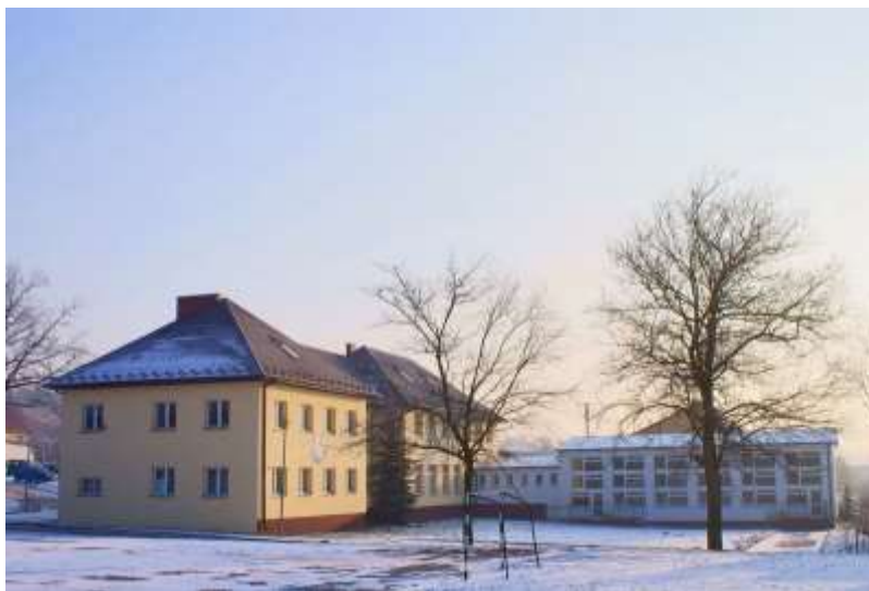
Zdjęcie 41: Szkoła Podstawowa w Brodach

Szkoła naucza 89 uczniów w PSP oraz 17 w oddziale zerowym. Zatrudnia 11 nauczycieli oraz 2 woźne. W szkole jest 10 komputerów stacjonarnych - otrzymanych w ramach projektu Prezydenta RP w 2003 r., a także 20 netbooków otrzymanych w ramach projektu Świętokrzyski Program Rozwoju Edukacji w 2010 r. oraz 2 laptopy. Do użytku ma 8 sal lekcyjnych, bibliotekę, świetlicę, stołówkę, sale gimnastyczną i boisko zewnętrzne.