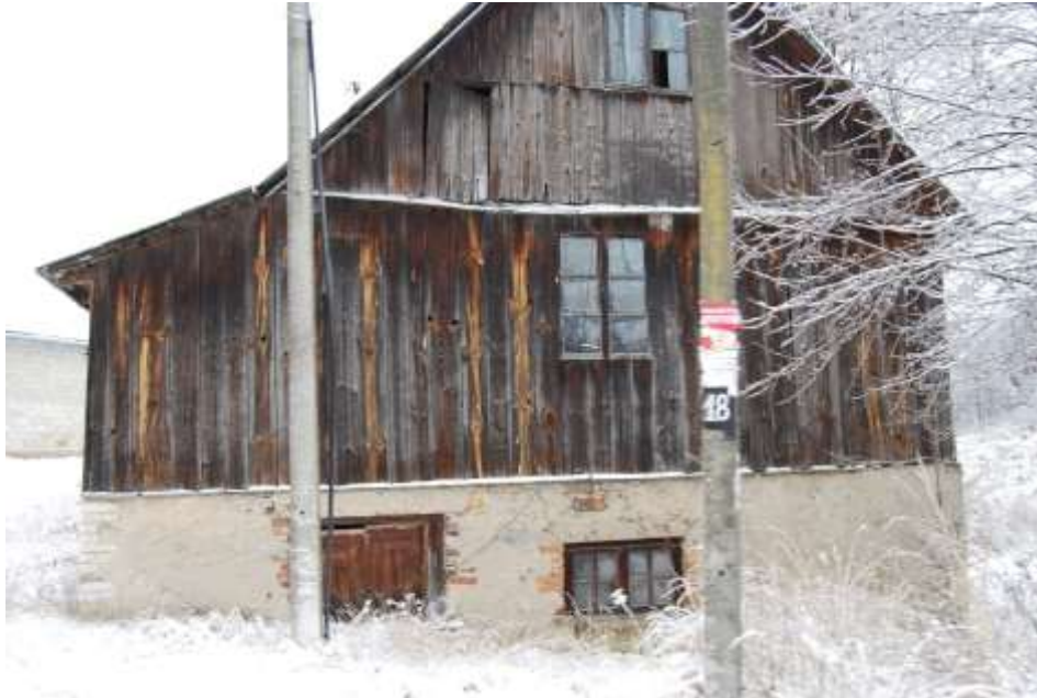
Zdjęcie 33: Jeden z dawnych młynów w Młynku

dawno przestały mleć ziarno, to w niektórych zachowały się jeszcze mechanizmy przemiałowe. Do dziś zachowały się cztery stare młyny: w Stykwie , Młynku , Stawie Kunowskim oraz w Brodach .