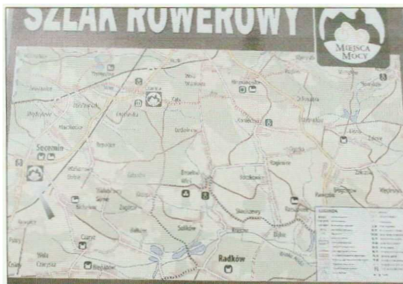
Zdjęcie nr 7. Szlak rowerowy „Miejsca Mocy”