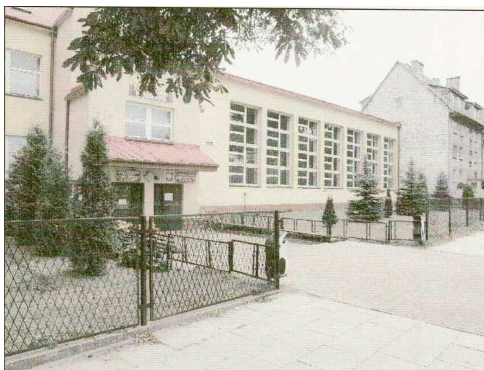
Zdjęcie nr 6. Szkoła Podstawowa im. Jana Zawady oraz Gimnazjum im. Jana Pawła II w Seceminie

Szkoła Podstawowa im Jana Zawady w Seceminie rozpoczęła swoją działalność dydaktyczno-wychowawczą w 1937 roku. Ze względu na powiększającą się liczbę dzieci uczęszczających do placówki, szkoła posiadająca jedynie 9 sal dydaktycznych nie była w stanie zapewnić odpowiednich warunków do nauki. W związku z powyższym jednym z najważniejszych zadań władz samorządowych była rozbudowa i modernizacja placówki. Inwestycja ta była realizowana w III etapach. Ostatni zakończył się w 2004 roku oddaniem do użytku nowych sal dydaktycznych, stołówki oraz szatni. W chwili obecnej w dwukondygnacyjnym budynku szkoły, którego ogólna powierzchnia użytkowa wynosi 1868 m 2 , mieści się 19 sal dydaktycznych, co w zupełności zaspokaja potrzeby miejscowości Secemin oraz pobliskich wsi (w tym Marchocic). Nauka w placówce obejmuje klasy od I do VI oraz klasy gimnazjalne, placówki szkół ponad gimnazjalnych do których uczęszcza młodzież z Marchocic znajdują się we Włoszczowie.