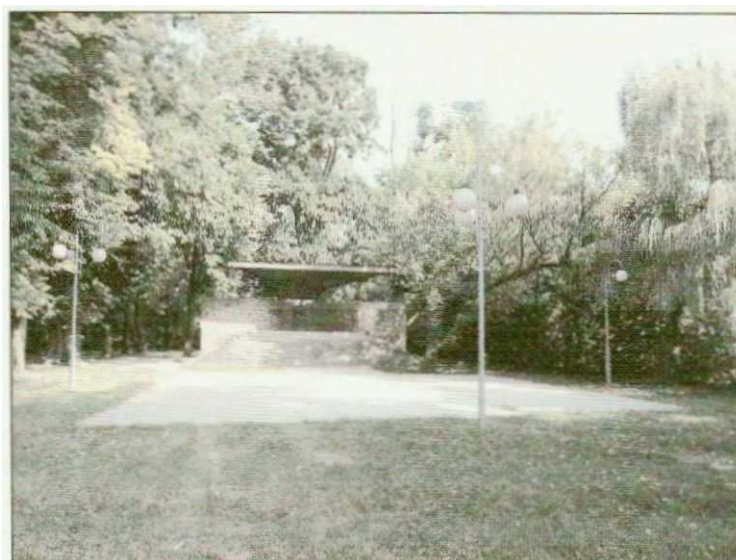
Zdjęcie nr 6. Muszla koncertowa, fot. InicjatywaLokalna.pl

Na terenie parku zlokalizowana jest niewielka muszla koncertowa, miejsca gdzie odbywają się gminne imprezy plenerowe. Jest to rodzaj małego amfiteatru ze sceną i zadaszeniem. W ramach realizacji inwestycji zagospodarowania parku, zaplanowano budowę nowego obiektu, pełniącego funkcję miejsca zgromadzeń na około 800 osób.