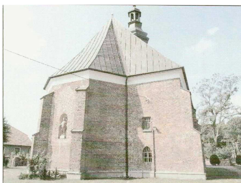
Zdjęcie nr 8. Kościół p.w. Św. Katarzyny i Jana Ewangelisty w Seceminie