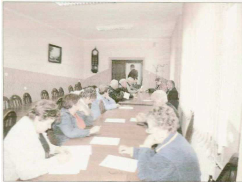
Zdjęcie nr 1. Debata strategiczna 15.09.2008