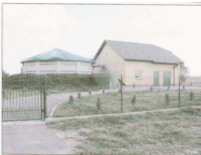
Zdjęcie nr 11. Widok oczyszczalni z zasilaniem energetycznym

Na terenie miejscowości brak jest kanalizacji sanitarnej. W tym zakresie gmina realizuje projekt, którego przedmiotem jest budowa kanału sanitarnego w miejscowości Secemin, Marchocice i Brzozowa. Realizacja inwestycji będzie możliwa dzięki wsparciu z Regionalnego Programu Operacyjnego Województwa Świętokrzyskiego na lata 2007-2013. W ramach projektu zostanie wybudowana kanalizacja jak również powstanie wodociągowa sieć przemysłowa, nowe przyłącza wodociągowe, oraz częściowo zostanie rozbudowane istniejące ujęcie wody w Seceminie. Projekt kanalizacji opiewa na 17 mln zł. Operacja ta jest zgodna z realizowanymi działaniami związanymi z budową oczyszczalni ścieków i kanalizacją sanitarną. Projekt budowy oczyszczalni realizowany od lipca 2006 roku, był dofinansowany z Europejskiego Funduszu Rozwoju Regionalnego w ramach Zintegrowanego Programu Operacyjnego Rozwoju Regionalnego. Inwestycja budowy oczyszczalni ścieków oraz wybudowania części sieci kanalizacyjnej zakończyła się w 2007 roku. Sfinalizowanie całego projektu w znaczny sposób podniesie poziom wyposażenia gminy w podstawową infrastrukturę techniczną oraz poprawi stan środowiska naturalnego