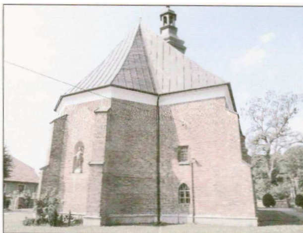
Zdjęcie nr 13. Kościół p.w. Św. Katarzyny i Jana Ewangelisty w Seceminie