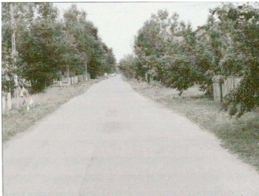
Zdjęcie nr 7. Droga gminna w Marchocicach, fot. InicjatywaLokalna.pl

Brak traktów pieszych wzdłuż pasa drogowego znacznie obniża poziom bezpieczeństwa pieszych. Wybudowanie chodników było jedną z potrzeb rozwojowych wsi, jaka została zgłoszona przez mieszkańców podczas zebrania strategicznego.