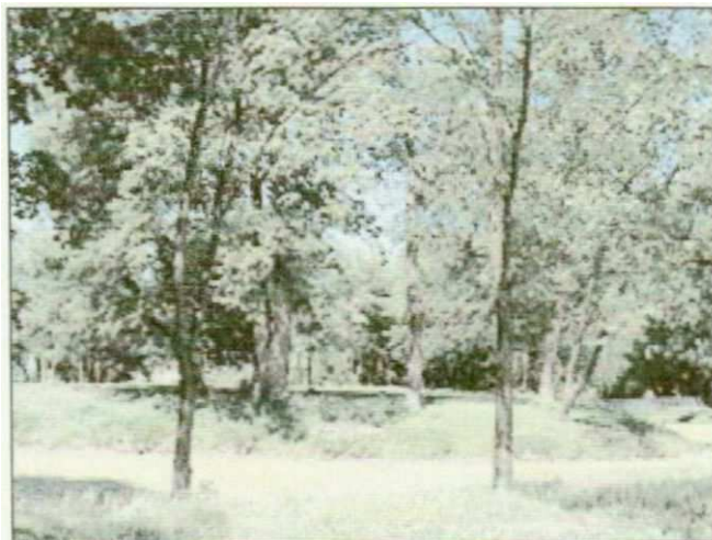
Zdjęcie nr 4. Park z fosą, źródło: www.powiat-wloszczowa.pl

Niedaleko kościoła parafialnego znajdują się resztki parku założonego w XVIII, na terenie, którego usytuowany jest dobrze widoczny kopiec otoczony fosą o wymiarach 20 m. Potocznie jest on nazywany „fortalicją Szafranców”, ponieważ, jak dowodzą badania archeologiczne, tutaj zlokalizowana była średniowieczna budowla mająca spełniać rolę obronną. Prace badawcze dowodzą, że obiekt ten zbudowany został na kształcie prostokąta zlokalizowanego w środkowej partii kopca. Budowlę secemińską można określić mianem fortalicji, najpopularniejszej w epoce średniowiecznej siedziby możnowładców. Jest to ogólna nazwa budowli, pełniącej funkcje wieży mieszkalnej i dworu obronnego. Położony w zachodniej części Secemina kopiec, porośnięty jest drzewostanem parkowym, które łączą się z otoczeniem krótkimi gołbami oraz kładką.