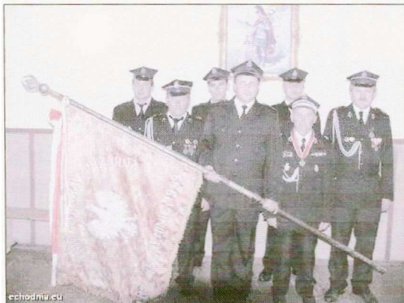
Zdjęcie nr 12. Strażacy OSP w Seceminie