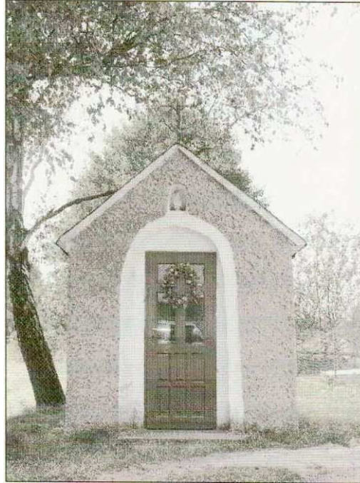
Zdjęcie nr 4. Kapliczka przydrożna

W centralnej części wsi Marchocice zlokalizowana jest murowana kapliczka przydrożna w których odbywają się nabożeństwa majowe.