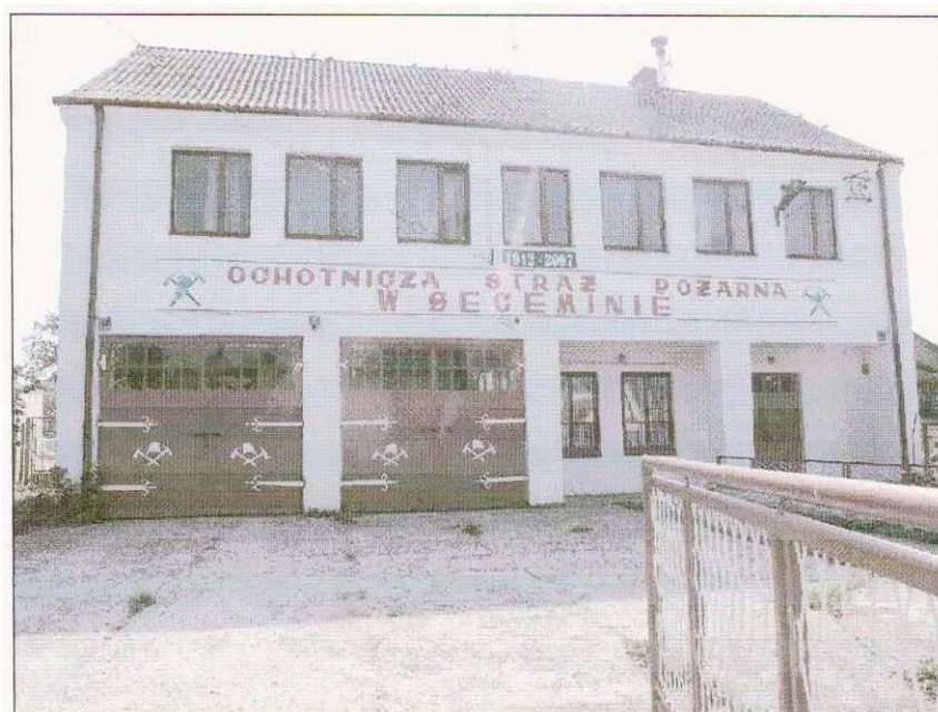
Zdjęcie nr 10. Remiza Ochotniczej Straży Pożarnej w Seceminie