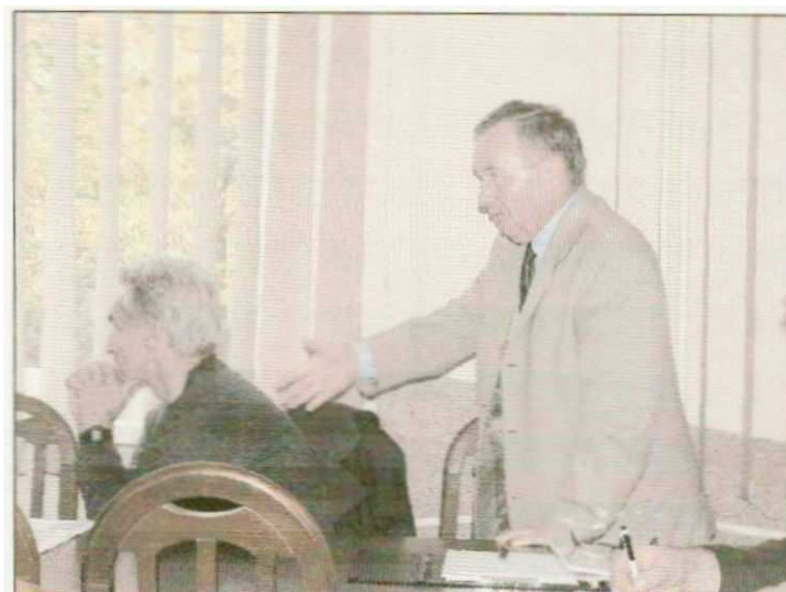
Zdjęcie nr 2. Zebranie wiejskie 15.10.2008 rok