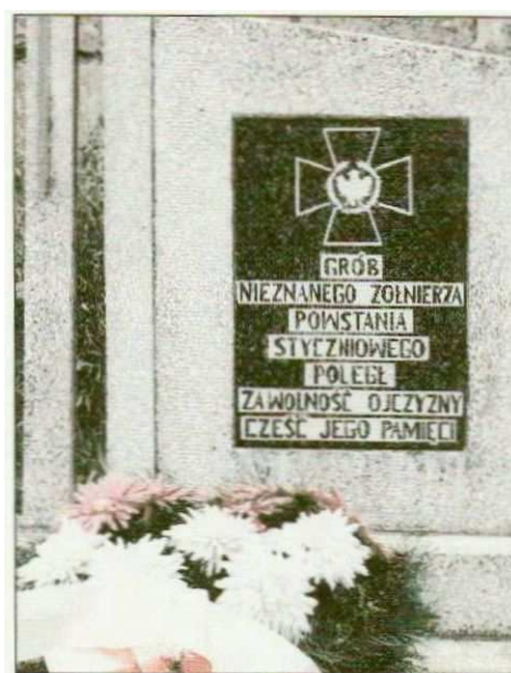
Zdjęcie nr 8.. Grób Nieznanego Żołnierza