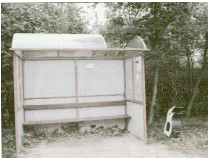
Zdjęcie nr 5. Przystanek autobusowy