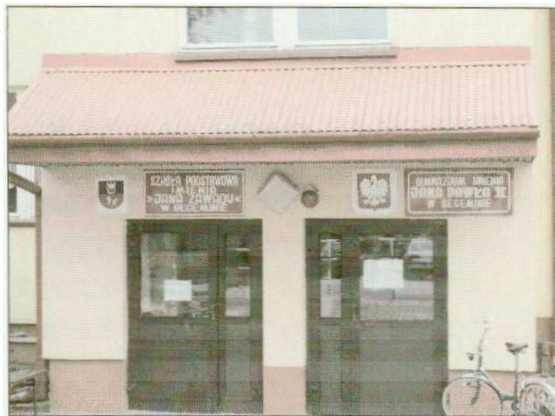
Zdjęcie nr 9. Szkoła Podstawowa im. Jana Zawady oraz Gimnazjum im. Jana Pawła II w Seceminie

W Seceminie udzielana jest opieka przedszkolna, która w zupełności zaspakaja potrzeby miejscowości i otaczających ją wiosek. W bezpośrednim sąsiedztwie budynku przedszkola usytuowany jest plac zabaw.