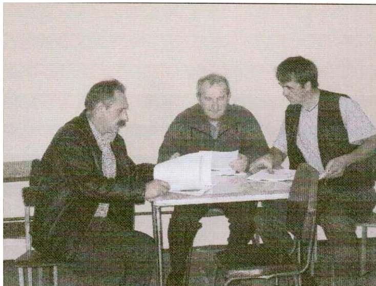
Zdjęcie nr 2. Zebranie wiejskie 12.10.2008 rok