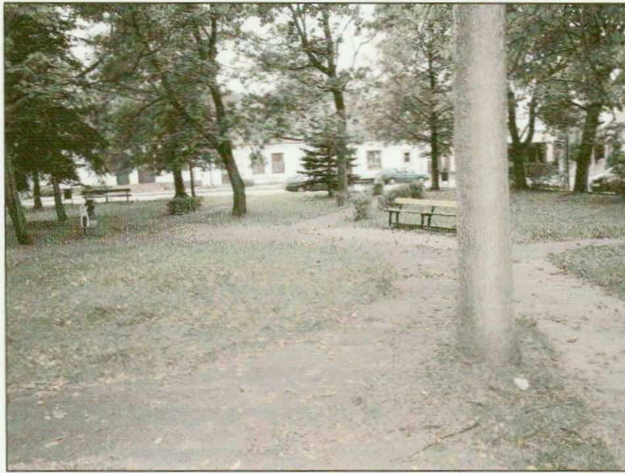
Zdjęcie nr 3. Skwer w centrum Secemina, fot. InicjatywaLokalna.pl